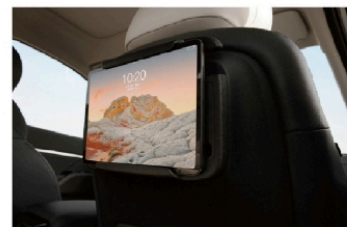
• 后排平板电脑支架