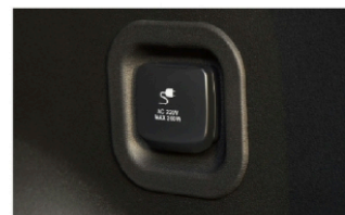
• 220V 后备箱电源