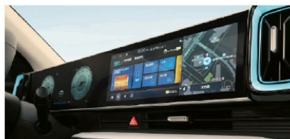
• 12.3英寸智慧双联屏+智能网联系统4.0