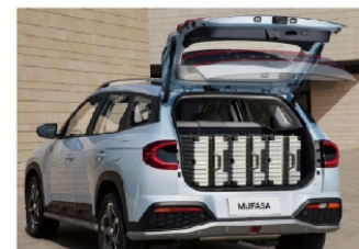
• 451L大容量后备箱 (感应开启式电动尾门)