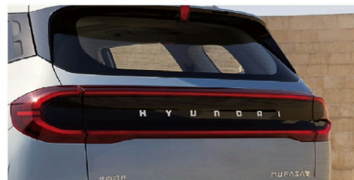
• 曲率引擎式LED组合尾灯