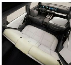
• Multi Zone 智享三区设计