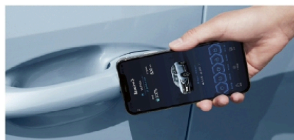
• BLE 手机蓝牙钥匙