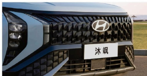
• 参数化宝石前格栅