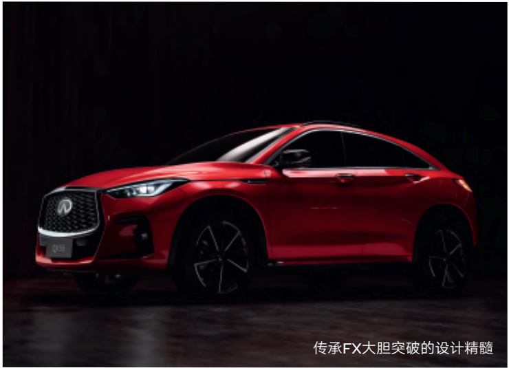
传承FX大胆突破的设计精髓