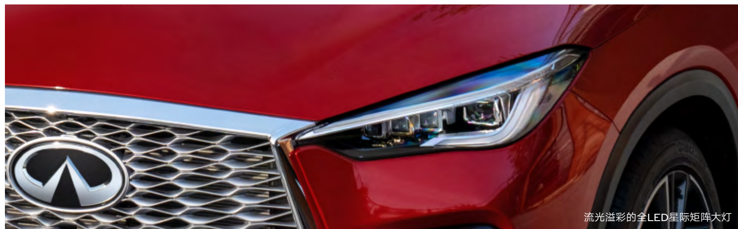
流光溢彩的全LED星际矩阵大灯