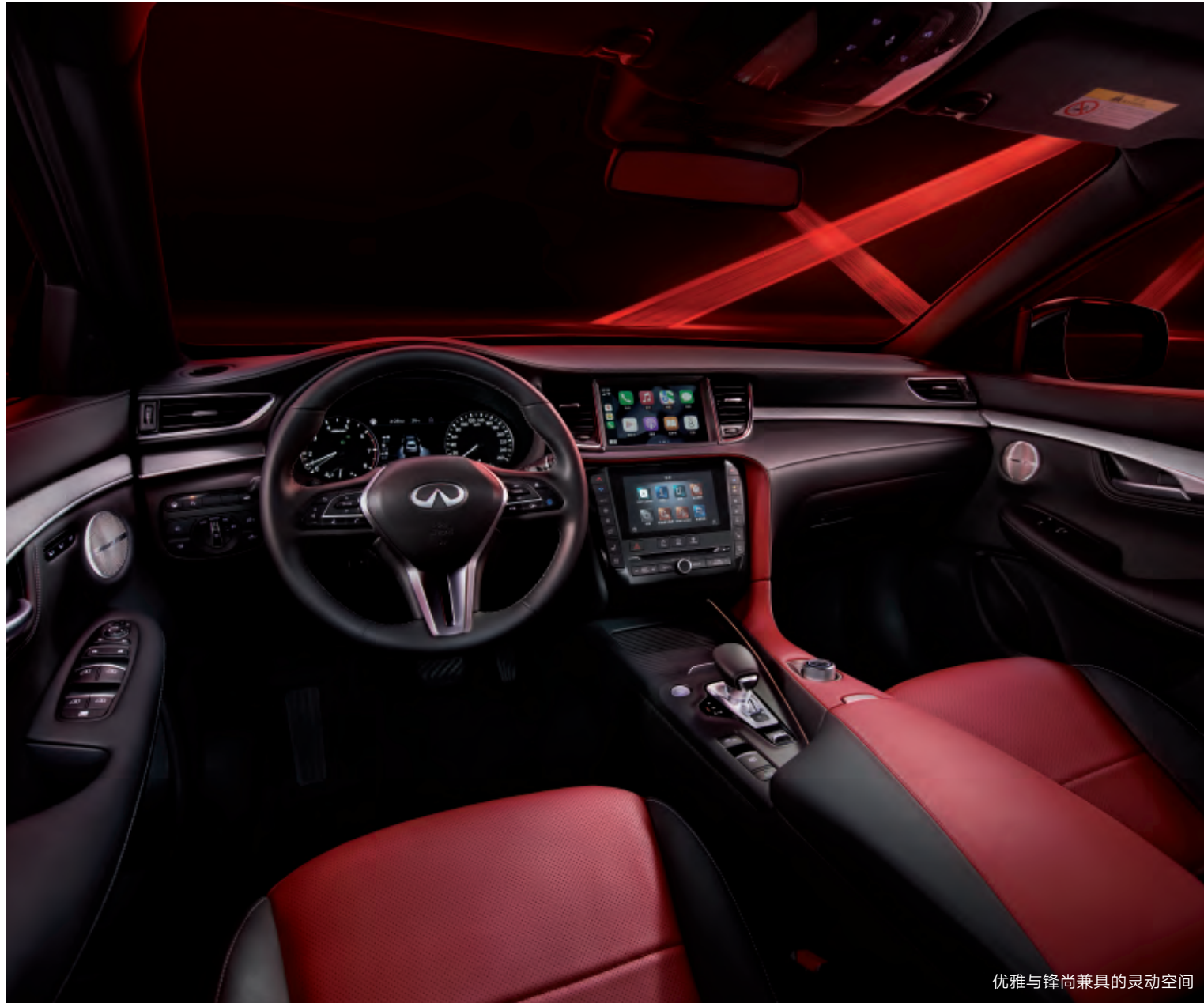
优雅与锋芒兼具的灵动空间

①本型录包括的所有图像、照片、规格、参数、文字描述系制作时可获得的最新产品信息，仅供参考，不保证本型录所描述的产品在当地英菲尼迪授权经销商处一定有售。当您选择英菲尼迪汽车产品时，请以经销商店内展示和销售的实车/实物的配置、样式、规格、颜色为准。②由于印刷色差原因，本型录显示的产品颜色可能与实物略有不同，请于当地英菲尼迪授权经销商处查看实际颜色。③英菲尼迪汽车产品生产厂家及其授权的总经销商有权在任何时候对英菲尼迪汽车产品的价格、颜色、材料、设备、规格和型号作出变动，包括但不限于停止生产特定车型或相关配件。④产品信息的有效性、交货时间以及可供选择的选装精品等可能因为特殊型号、产品组合和促销活动而变化，请详询当地英菲尼迪授权经销商。⑤Bluetooth® 蓝牙的商标和图标都归 Bluetooth SIG, Inc. 所拥有。⑥东风英菲尼迪汽车有限公司拥有对 Infiniti /英菲尼迪®商标、商号、产品名称和标语标识的使用权。⑦本型录于2022年8月26日起投入使用，在本型录投入使用之前，就本型录所描述的产品可能存在其他版本的介绍和描述，如有不一致之处，请以本型录为准。