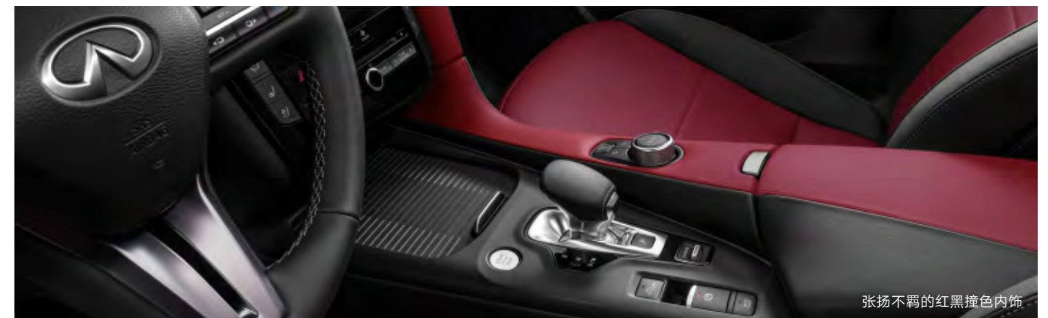
张扬不羁的红黑撞色内饰