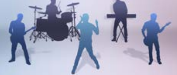
16个扬声器 1个低音音箱 650W功放

精心放置的扬声器和双声道低音音箱传递出饱满精致的声音，为车内所有人带来细致入微的享受。