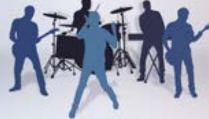
12个扬声器 1个低音音箱 400W功放