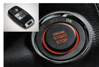
一键启动 & 智能钥匙 & 智能行李箱开启