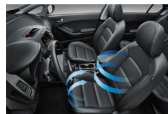
驾驶席电动通风座椅