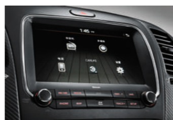
8英寸液晶显示屏(手机互联&UVO)