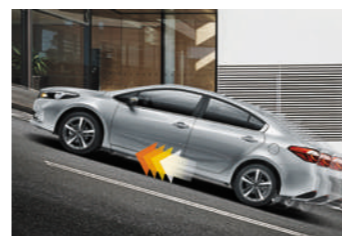
坡道起步辅助系统 (HAC)