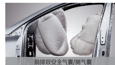
前排双安全气囊/侧气囊