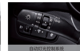
自动灯光控制系统