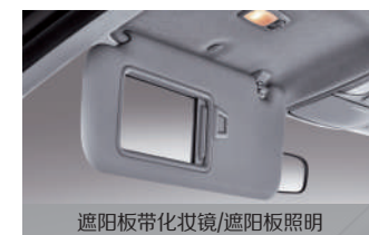
遮阳板带化妆镜/遮阳板照明