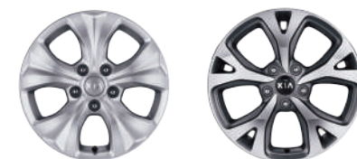
16英寸铝合金轮毂 17英寸铝合金轮毂