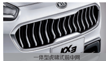
一体型虎啸式前中网