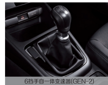
6挡手自一体变速器(GEN-2)