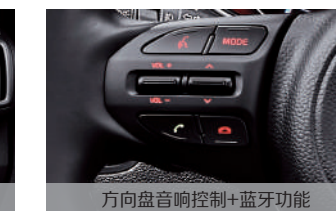
方向盘音响控制+蓝牙功能