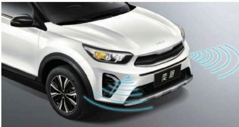
前方驻车雷达 (女性/新手关怀)