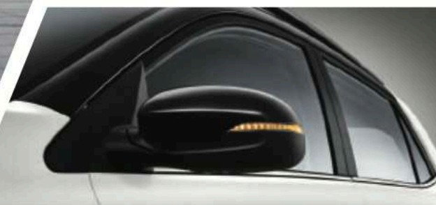
外后视镜集成转向灯