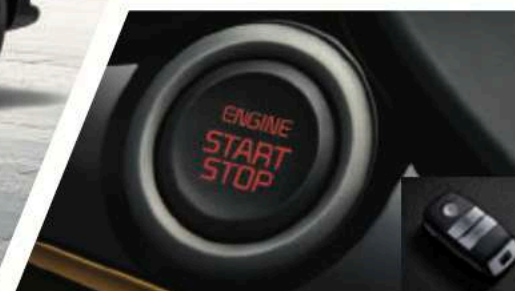
一键启动 & 智能钥匙