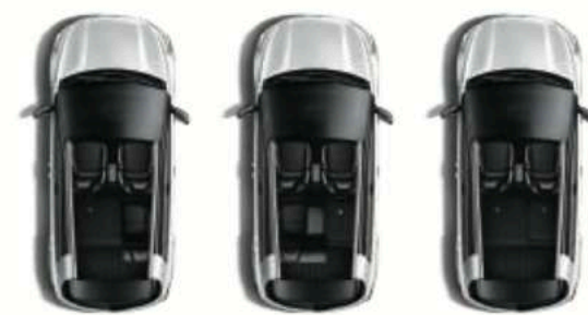
6:4分离座椅 (局部折叠1)