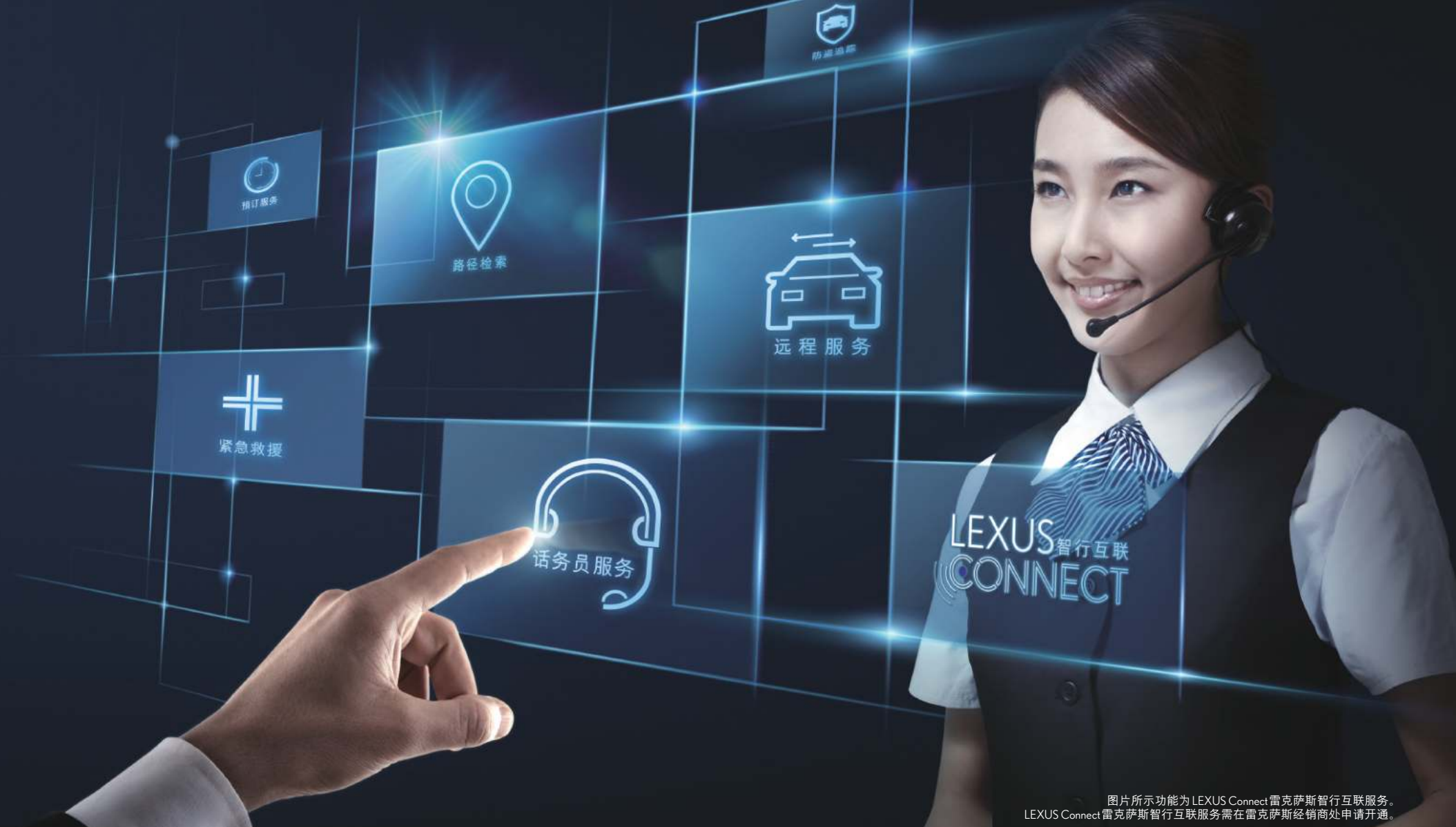
图片所示功能为 LEXUS Connect 雷克萨斯智行互联服务。 LEXUS Connect 雷克萨斯智行互联服务需在雷克萨斯经销商处申请开通。