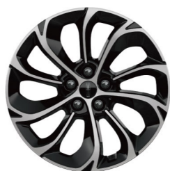
19"高级亮面铝合金轮毂 (尊享版)