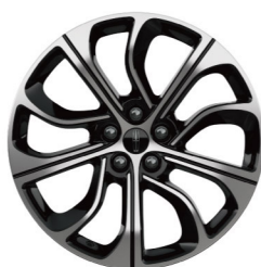
20"高级亮面铝合金轮毂 (尊逸版)