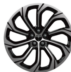
21"高级亮面铝合金轮毂 (尊睿版)