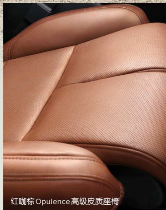
红咖啡 Opulence 高级皮质座椅

初升的天光，浅映出一片别致的梵海蓝。大海独有的魔力，赋予这一主题设计匠心灵思。海湾蓝 Venetian 高级皮质与细沙白缝线精巧配搭，更有点睛之笔雪柚木内饰木条嵌入其中，低调而弥漫优雅。身临座舱，如享帆海飞驰般沁人爽朗。