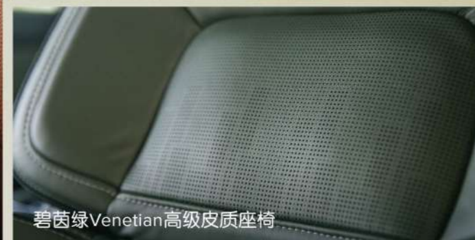
碧茵绿 Venetian 高级皮质座椅