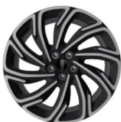
19"亮面铝合金轮毂 (尊逸版 & 尊雅版 & 尊耀版)