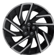
19"亮面铝合金轮毂 (尊逸版 & 尊雅版 & 尊耀版)