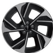
18"亮面铝合金轮毂 (尊悦版 & 尊尚版 & 尊享版)