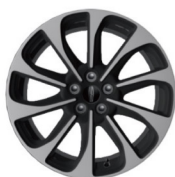
18"亮面铝合金轮毂 (尊享版 & 尊享版)