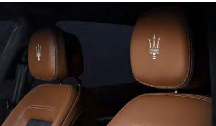
玛莎拉蒂新Quattroporte总裁 - 座椅头枕细节