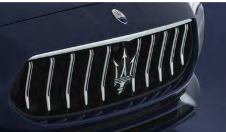
玛莎拉蒂新Quattroporte总裁 - 格栅