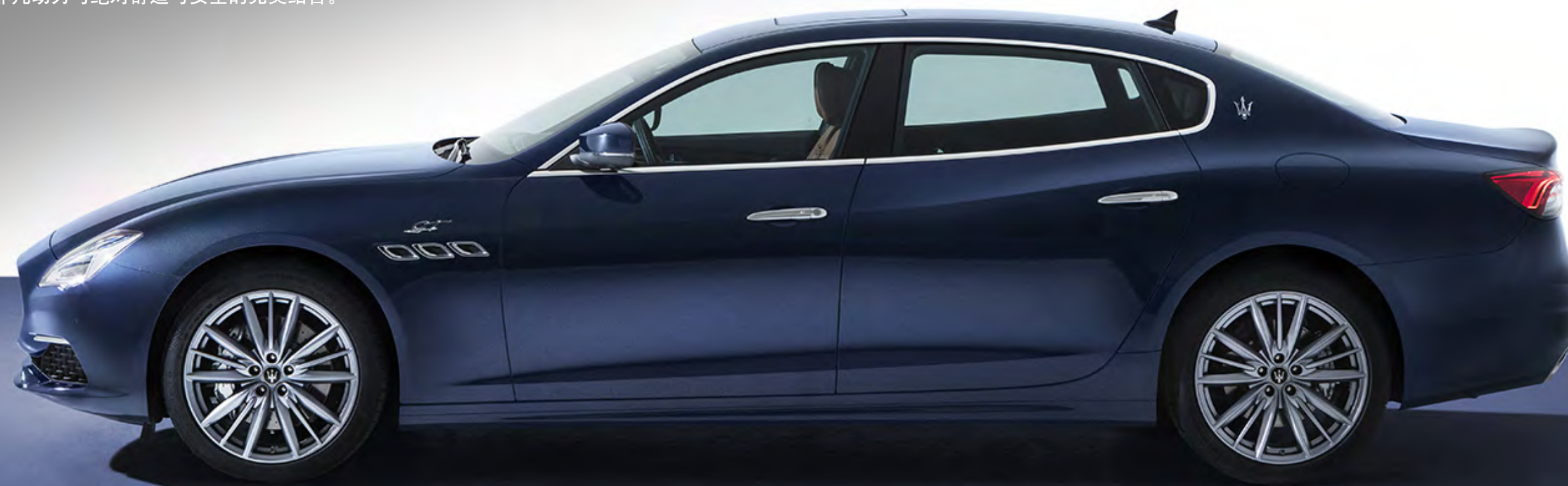
玛莎拉蒂新Quattroporte总裁 - 侧面通风口和GT徽章

大胆创新的设计、强悍的动力，以及一系列高端商务级智能系统，使玛莎拉蒂新Quattroporte总裁不仅具备超跑般的澎湃动力，而且具有卓越的操控效率，华丽且动感十足的夺目外观下蕴藏着奢华大气且宽敞的内部空间。拥有平衡的重量分布、Skyhook电子控制可变阻尼减振器、双材质铸造制动系统的玛莎拉蒂新Quattroporte总裁，是非凡动力与绝对舒适与安全的完美结合。