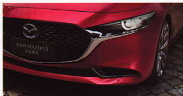
智能LED大灯组 | 自动开闭 | 远近光智能调节