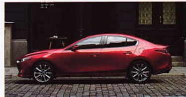
2,726mm越级轴距 | 18英寸铝合金轮毂