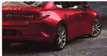
LED尾灯组 | 双出排气运动尾喉