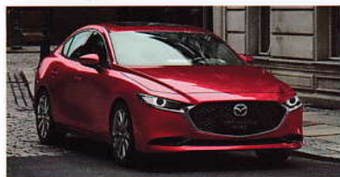
全新魂动之翼 | 矩阵式格栅 | 内部自动开闭