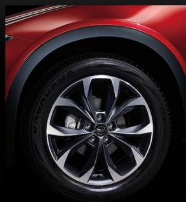
钻石切割19寸铝合金轮毂