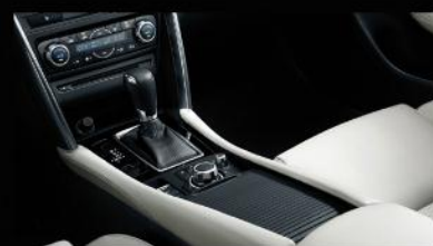
极具未来感的中央操控台