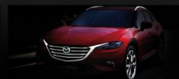
金属色装饰体，炫目连贯