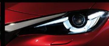
流星眼LED前大灯组合