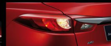
熏黑尾灯，瞬息之间引爆时尚