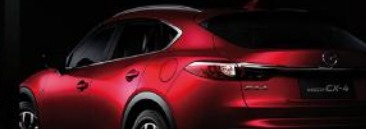
正侧皆梯形造型、大车肩设计