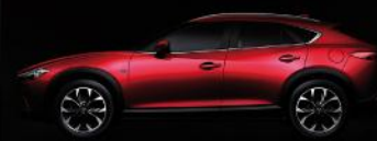
豪华跑车般低宽车身比例