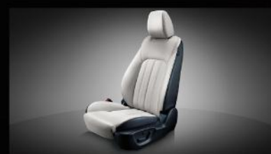
复古式纵向褶皱真皮座椅