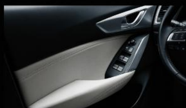
魂动心魄的车门内侧设计