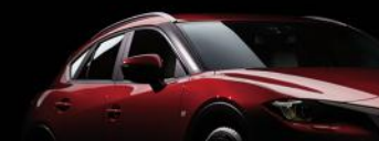
黑色A柱设计，打造悬浮式车顶