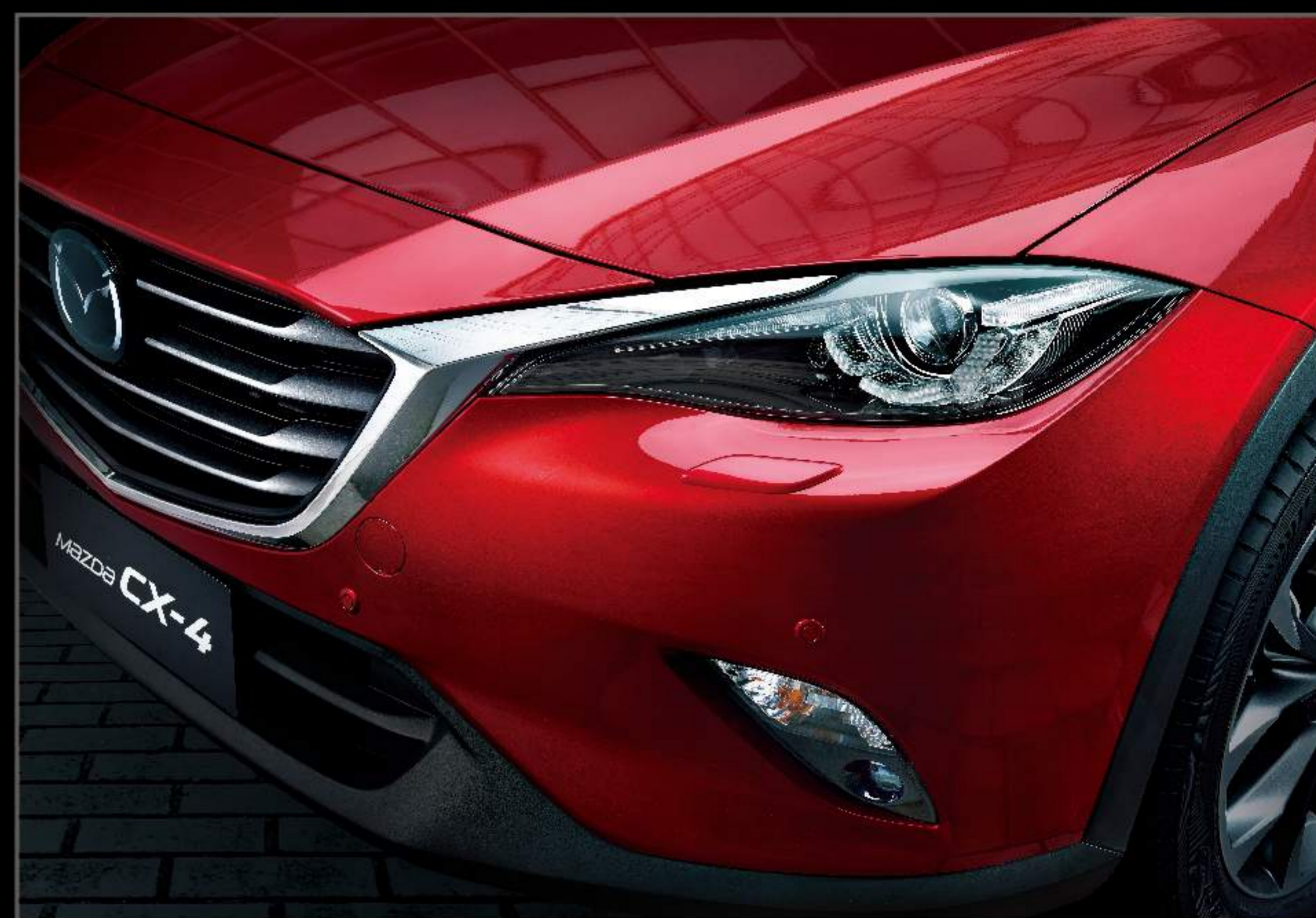
流星眼LED前大灯组合，耀目悦心。