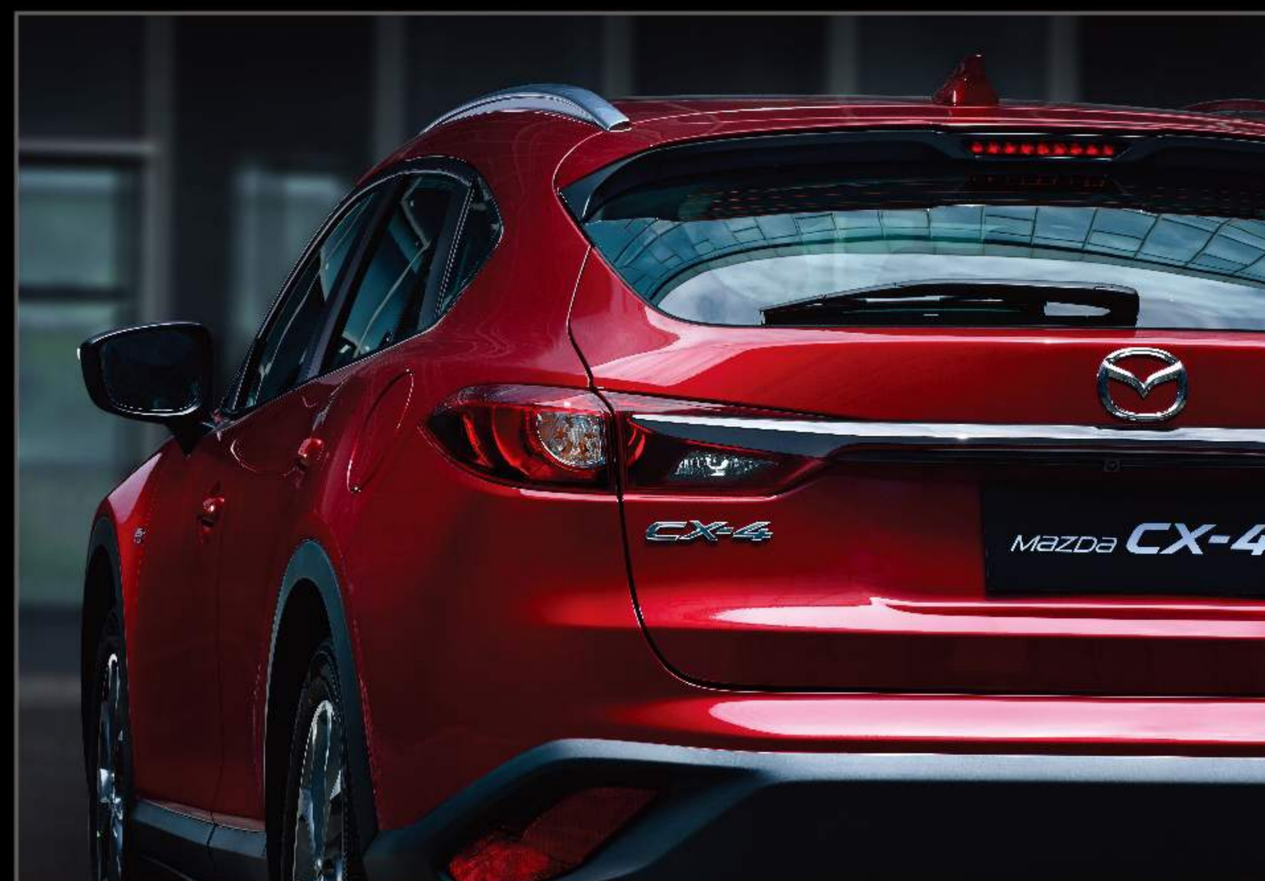
豪华跑车般低宽车身比例，动感华贵。