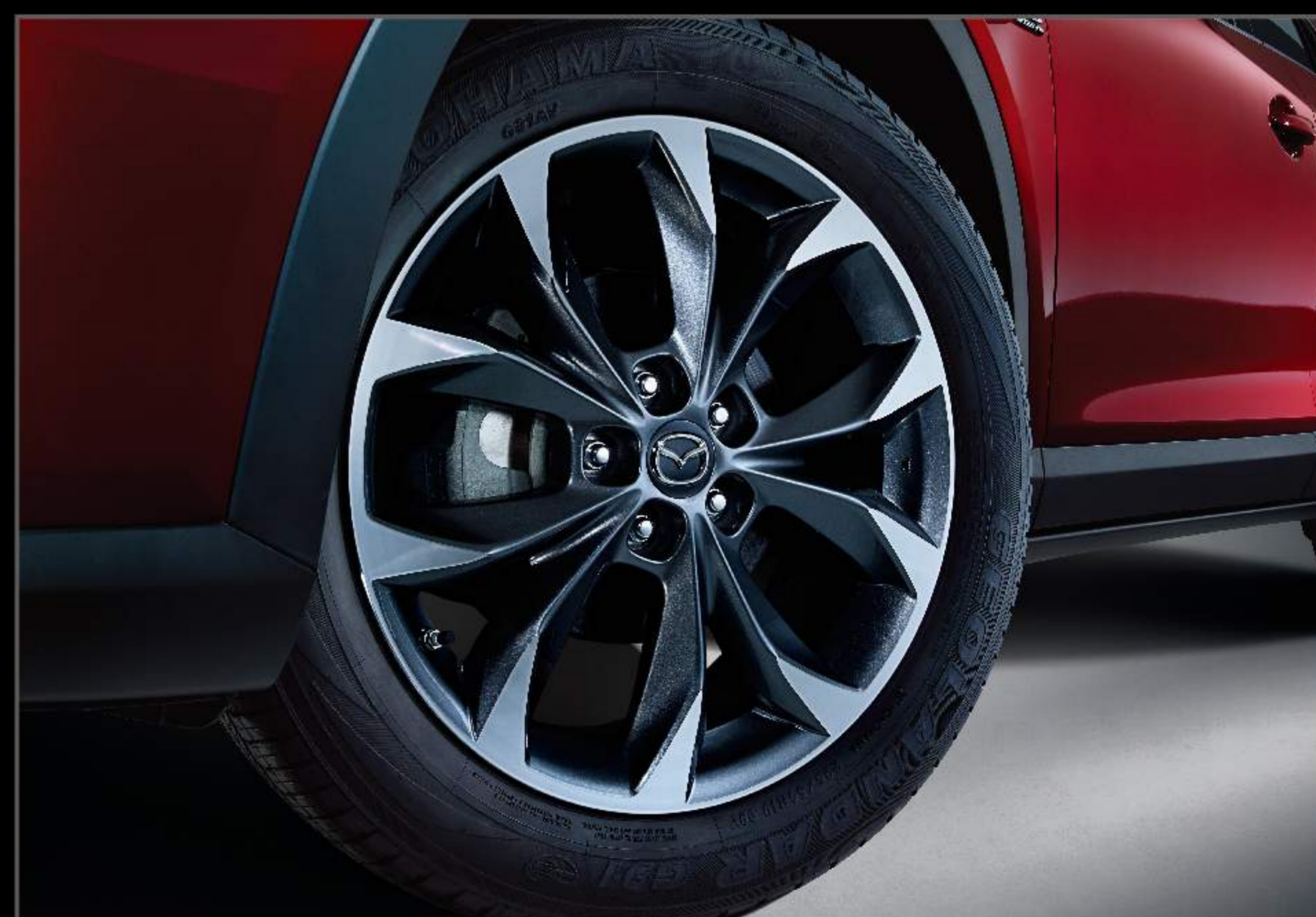
19寸大轮毂，卓尔不凡。