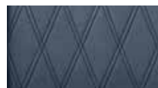
运动座椅，电动可调节，真皮*，菱格纹—靛蓝色