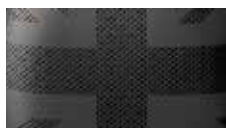
运动座椅，电动可调节，MINI YOURS 闲适真皮—碳黑色