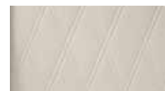
运动座椅，电动可调节，真皮*，菱格纹—星际灰

* 本页所示座椅只说明皮质颜色信息，如对皮质包裹范围有疑问，请以中国市场上市产品为准，或咨询MINI授权经销商。座椅选择可能根据不同车型受到限制，具体详情请参阅详细配置表。