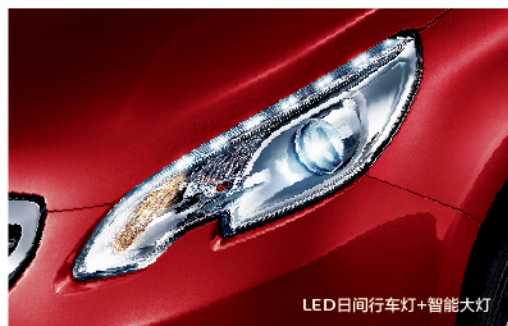
LED日间行车灯+智能大灯