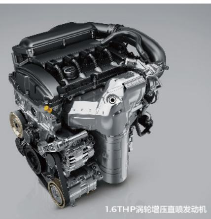
1.6THP涡轮增压直喷发动机

东风标致2008 1.6THP引擎上市， 特别搭载1.6THP涡轮增压直喷发动机 与领先同侪的STT发动机智能启停系统， 更少油耗， 动力更高效， 驾驶体验更痛快! 第三代6速手自一体变速箱， 无论加速减速都顺着你，如此畅快， 让你一路爽到底! Grip Control多路况适应系统， 雪地、泥泞、沙地模式任你去撒野! 有不安分的芯，当然越玩越带劲!