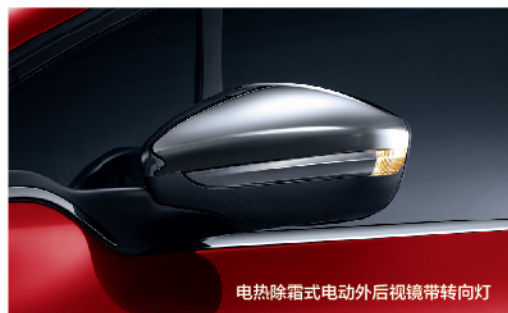
电热除霜式电动外后视镜带转向灯