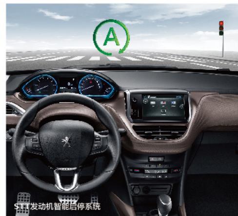
STT发动机智能启停系统