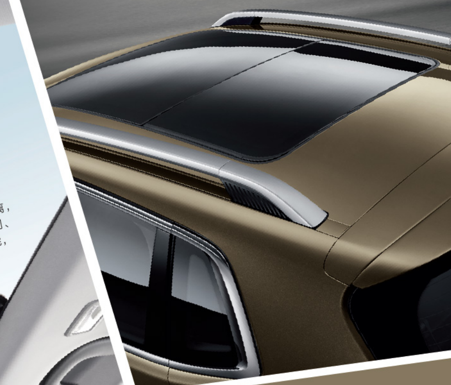
轻质铝合金行李架 全新造型设计的轻质铝合金行李架，搭配各种套件满足多种休闲生活所需，随时玩出无限精彩。