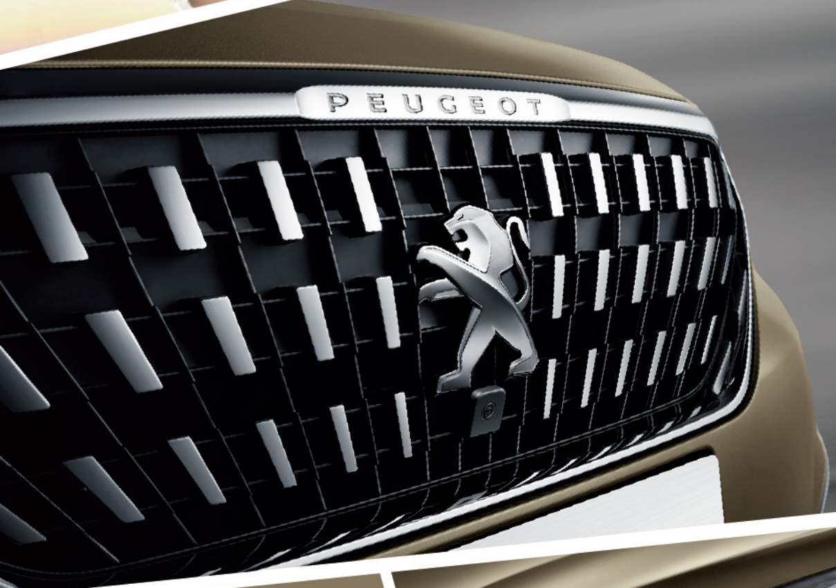
点阵式进气格栅 放射状的点阵式设计，如激起的水幕，如瞬间迸发的激情，动感刹那在此刻定格，逐乐之心尽情释放。