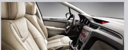
雅致格调灵动真皮内饰