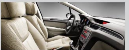
雅致格调灵动织物内饰