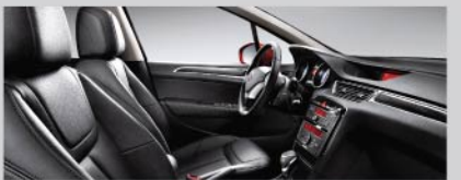
魅黑酷感灵动真皮内饰