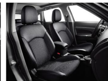
时尚型 手工织物内饰