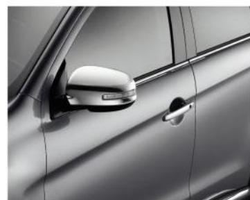
镀铬后视镜外壳 / 镀铬门把手外壳