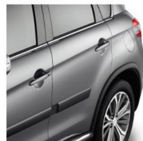
侧向半透明防擦条