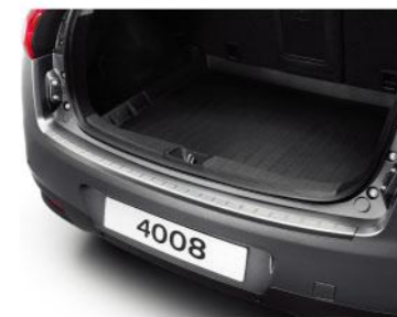
行李箱地板垫 / 尾门门槛防擦条