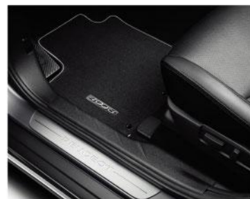
拉丝铝带 Logo 门槛饰条 / 带 4008 标牌的丝绒地垫