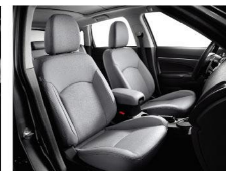
豪华型 灰色真皮内饰