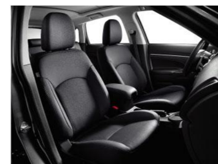
豪华型 黑色真皮内饰