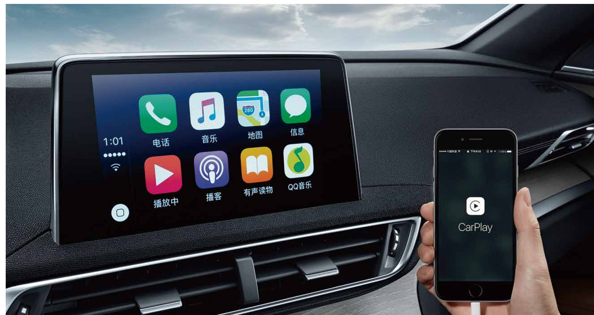
智能手机互联系统