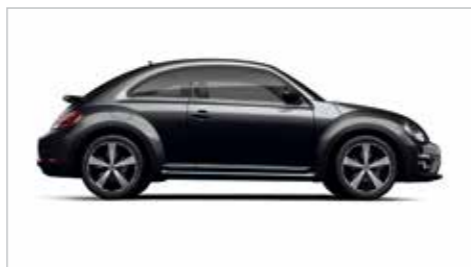
水墨黑 | 标准漆