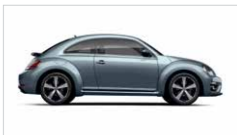
石磨蓝 | 金属漆