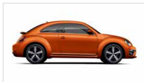
石楠橘 | 金属漆