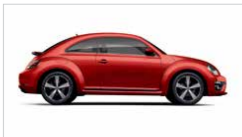
魅惑红 | 标准漆