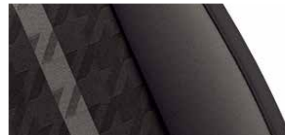
乌素/千鸟 双色织物座椅