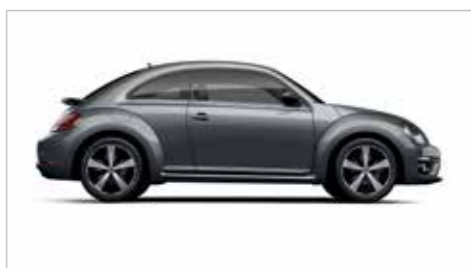
铂金灰 | 金属漆