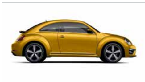
砂砾黄 | 金属漆