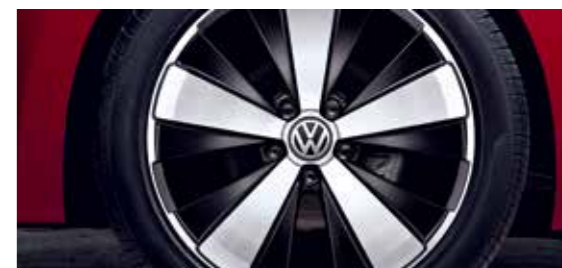
18 英寸铝合金轮毂 Twister