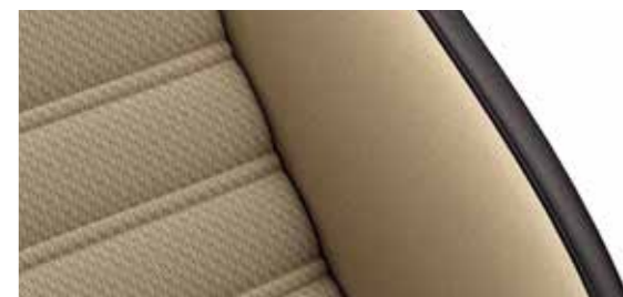
星域/流韵 双色 Vienna 真皮座椅