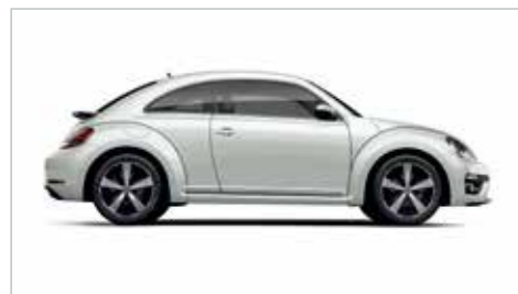
鹅卵石白 | 标准漆