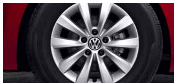
16 英寸铝合金轮毂 Whirl