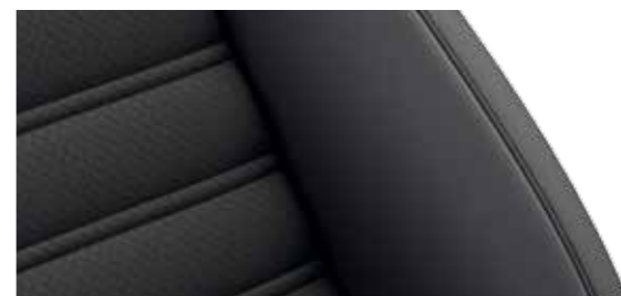
忍者黑 Vienna 真皮座椅