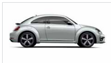
岩页银 | 金属漆