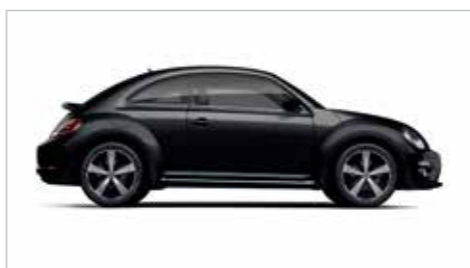
钢琴黑 | 珠光漆