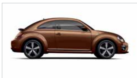
赤泊棕 | 金属漆