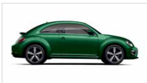
竹璃绿 | 金属漆