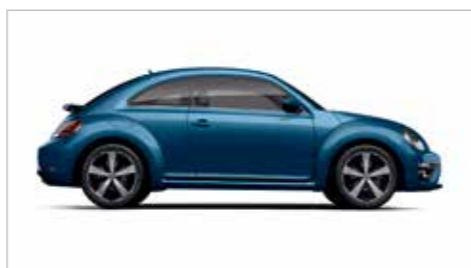
织锦蓝 | 金属漆