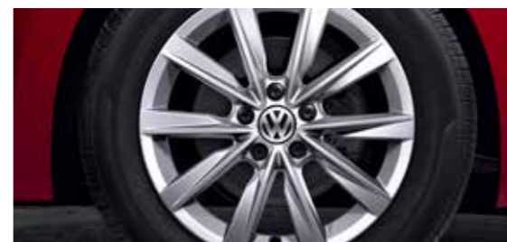
17 英寸铝合金轮毂 Philadelphia