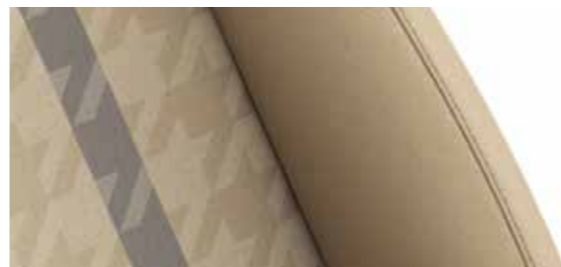
库锦/墨影 双色织物座椅