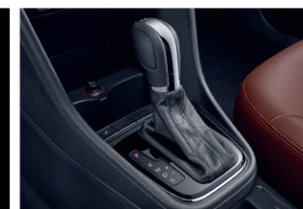
DSG七速双离合变速箱