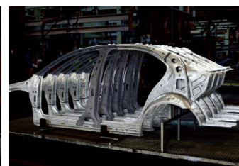
热成型高强度钢板