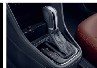
DSG七速双离合变速箱