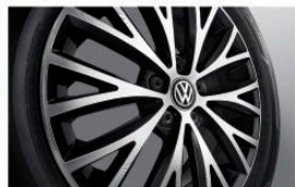
16吋二十辐锋驰铝合金高光轮毂