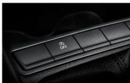
驻车启停及制动能量回收系统