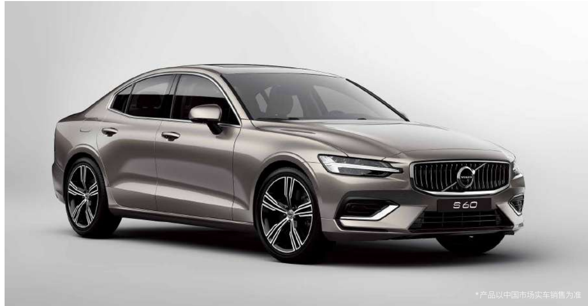
*产品以中国市场实车销售为准