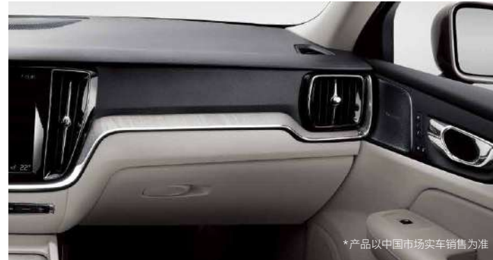
*产品以中国市场实车销售为准