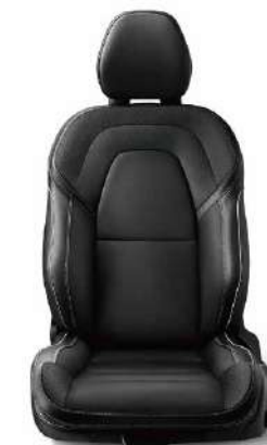
运动型座椅带多向调节功能，提供更好的包裹性及侧向支撑，Nappa真皮*+Open Grid网格织物搭配撞色缝线，动感而不失精致。