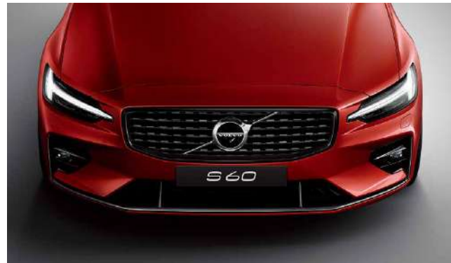
“雷神之锤”LED大灯、亮黑色运动风格前格栅、亮黑色进气格栅，令整车动感倍增。

S60运动版个性鲜明，车身亮黑色套件，不仅赏心悦目，更彰显其运动座驾本色。车内，运动型座椅、金属网格内饰条、黑色顶棚等配置，令座舱动感十足。底盘系统经特殊调校，更适宜中国路况，带来超越期待的驾驭体验。