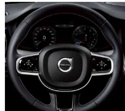
运动型三幅方向盘采用皮质包裹，12.3英寸液晶智能数字仪表盘具备四种图形模式。