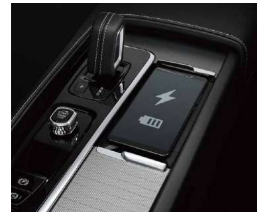
前排驾乘享受手机无线充电，摆脱束缚，无线更灵活便捷。