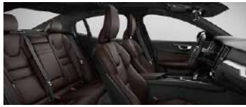
RE30' B4 智逸豪华版标配; T8 智逸豪华版标配 黑色内饰 | 人体工程学 棕色 Sakelyx 皮质座椅 | Iron Ore 拉丝铝内饰条