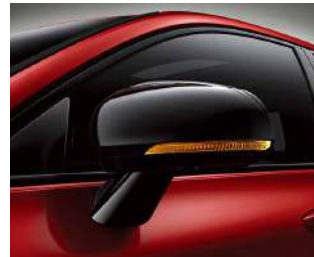
黑色外后视镜罩，焕发动感气息。