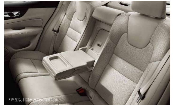
*产品以中国市场实车销售为准