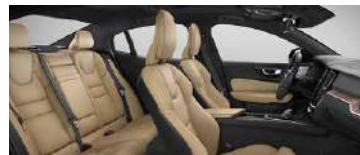
RC20' B4 智远豪华版选装 黑色内饰 | 人体工程学 琥珀色高级 Nappa 真皮座椅 | Linear Lime 直纹榎木内饰条