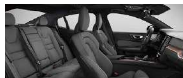
R471' B4 智远豪华版选装 黑色内饰 | 人体工程学 浅灰色高级羊毛织物运动 座椅 | Linear Lime 直纹榎木内饰条