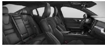
RG0R' B4 智远运动版标配; B5 智雅运动版标配; T8 智雅运动版标配 黑色内饰 | 人体工程学 黑色 Nappa 真皮 + Open Grid 织物运动座椅 | Metal Mesh 金属网格内饰条