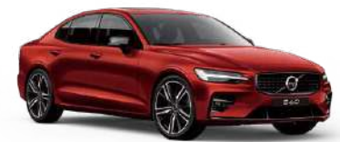
沃尔沃 S60 运动版 美学基因，澎湃内芯，释放动感天性。