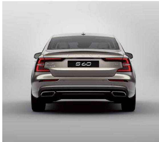
双E型尾灯，个性鲜明，增添车尾动感气息。

S60 豪华版造型高雅，线条中释放动感，细节处彰显质感。甄选上等材料打造座舱，匠心研磨只为更佳感官体验。皮质、金属网格内饰条等装饰，无不流露北欧豪华气息。