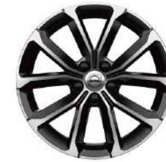
17 英寸 豪华版