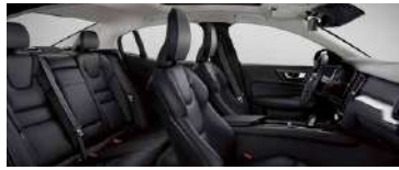
RD00 B3 智行豪华版标配; B4 智逸豪华版标配; T8 智逸豪华版标配 黑色内饰 | 人体工程学 棕色 Sakelyx 皮质座椅 | Iron Ore 拉丝铝内饰条