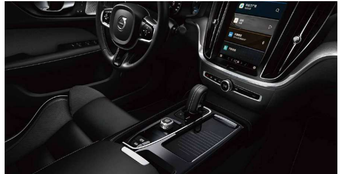
运动版内饰包括运动型皮质包裹三幅方向盘、运动型皮质包裹换挡杆、人体工程学Nappa真皮*+Open Grid织物运动座椅、Metal Mesh金属网格内饰条等。