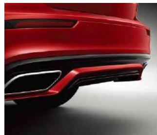
整合型双侧排气管，令人眼前一亮。