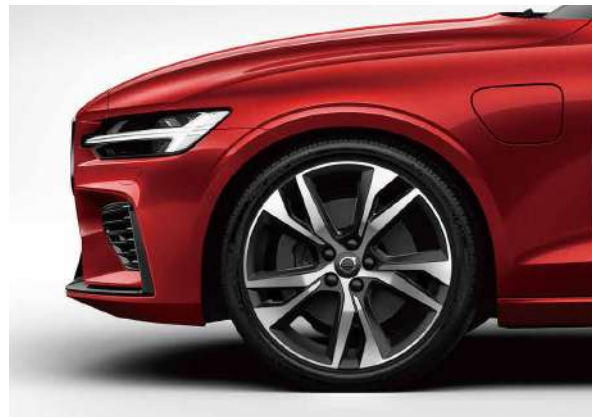
19英寸运动版铝合金轮毂，进一步加强路感。