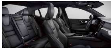
RC00 B4 智远豪华版选装 黑色内饰 | 人体工程学 黑色高级 Nappa 真皮座椅 | Drift Wood 漂流木内饰条