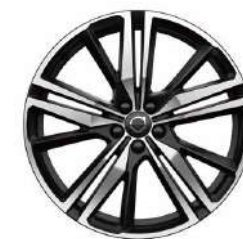
19 英寸 运动版