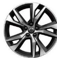
18 英寸 运动版