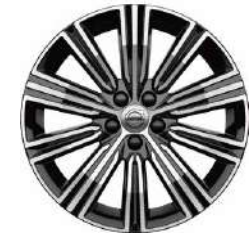
18 英寸 豪华版