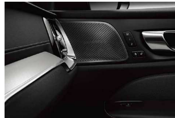
Metal Mesh金属网格内饰条点缀座舱，彰显动感与科技感。