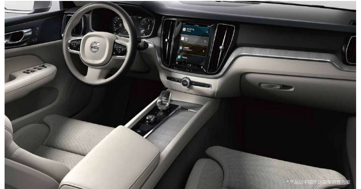
*产品以中国市场实车销售为准

Nappa真皮*的人体工程学电动座椅、可调节的前排座椅坐垫、Drift Wood 漂流木内饰条等，提升座舱豪华感官体验。