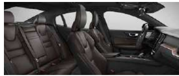
RC30' B4 智远豪华版选装 黑色内饰 | 人体工程学 棕色高级 Nappa 真皮座椅 | Linear Lime 直纹榎木内饰条