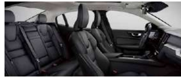
RA00 B4 智远豪华版标配 黑色内饰 | 人体工程学 黑色 Moritz 真皮座椅 | Drift Wood 漂流木内饰条