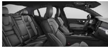
RGAR' B4 智远运动版标配; B5 智雅运动版标配; T8 智雅运动版标配 黑色内饰 | 人体工程学 灰色 Nappa 真皮 + Open Grid 织物运动座椅 | Metal Mesh 金属网格内饰条