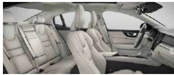
UC00 B4 智远豪华版选装 米色内饰 | 人体工程学 米色高级 Nappa 真皮座椅 | Drift Wood 漂流木内饰条