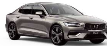
沃尔沃 S60 豪华版 严选臻材，精工匠造，铸就北欧豪华。