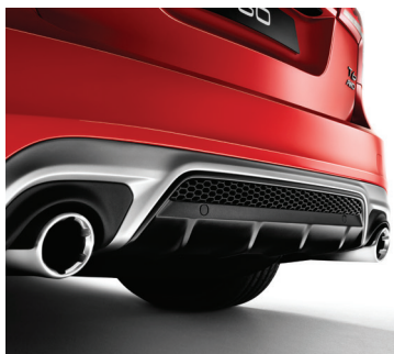
独有运动套件设计，一眼倾心不已

创新配备 SENSUS 系统，更多智能在线车载交互应用，全新云体验， 让您重识自己，既能稳进驾驭细品风景，亦能加速疾驰激享人生。