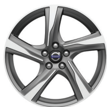
18" Ixion 运动轮毂