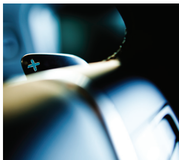
独有运动能量，魅力澎湃释放