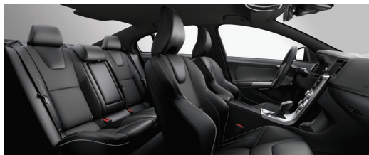
3R60 烟黑色内饰/黑色绒面配打孔真皮面料/运动型座椅