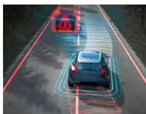
对向车辆智能避让