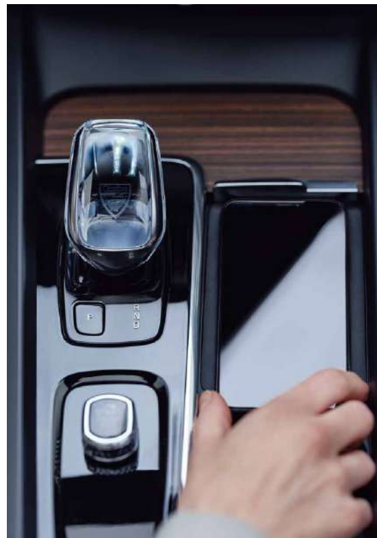
Orrefors 水晶换挡杆 / 手机无线充电