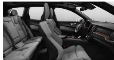
R471 1 RECHARGE T8 插电式混合动力 四驱 智雅豪华版(选装) 黑色内饰 | 人体工程学 浅灰色高级羊毛织物面料运动座椅 | Linear Lime直纹榎木内饰条