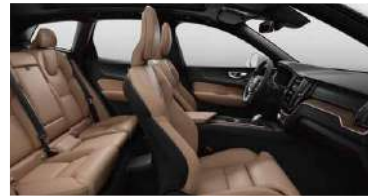
RC20 1 RECHARGE T8 插电式混合动力 四驱 智雅豪华版 黑色内饰 | 人体工程学 琥珀色高级Nappa真皮座椅 | Linear Lime直纹榎木内饰条