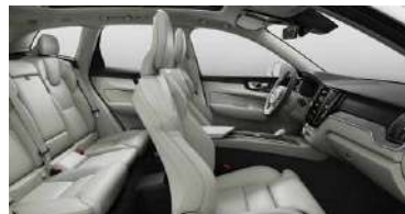
UC00 RECHARGE T8 插电式混合动力 四驱 智雅豪华版 米色内饰 | 人体工程学 米色高级Nappa真皮座椅 | Drift Wood 漂流木内饰条