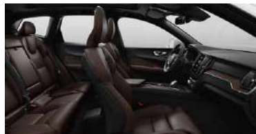
RC30 1 RECHARGE T8 插电式混合动力 四驱 智雅豪华版 黑色内饰 | 人体工程学 棕色高级Nappa真皮座椅 | Linear Lime 直纹榎木内饰条