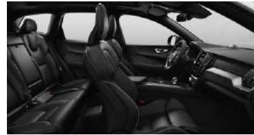
RG0R 1 B5 四驱 智远运动版 | RECHARGE T8 插电式混合动力 四驱 智远运动版 黑色内饰 | 人体工程学 黑色Nappa真皮+Open Grid 织物运动座椅 | Metal Mesh 金属网格内饰条