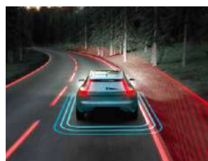
道路偏离预防系统