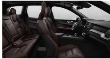
RE30 1 B5 四驱 智逸豪华版 黑色内饰 | 人体工程学 棕色Sakelyx皮质座椅 | Iron Ore 拉丝铝内饰条