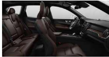
RA30 1 B5 四驱 智远豪华版 | B5 四驱 智雅豪华版 | RECHARGE T8 插电式混合动力 四驱 智远豪华版 黑色内饰 | 人体工程学 棕色Moritz真皮座椅 | Linear Lime直纹榎木内饰条