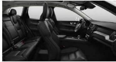
RD00 B4 智行豪华版 | B5 四驱 智逸豪华版 | B5 四驱 智逸运动版 1 黑色内饰 | 人体工程学 黑色Sakelyx皮质座椅 | Iron Ore 拉丝铝内饰条