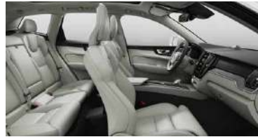
UA00 B5 四驱 智远豪华版 | B5 四驱 智雅豪华版 | RECHARGE T8 插电式混合动力 四驱 智远豪华版 米色内饰 | 人体工程学 米色Moritz真皮座椅 | Drift Wood 漂流木内饰条