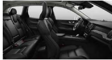
RA00 B5 四驱 智远豪华版 | B5 四驱 智雅豪华版 | RECHARGE T8 插电式混合动力 四驱 智远豪华版 黑色内饰 | 人体工程学 黑色Moritz真皮座椅 | Drift Wood 漂流木内饰条