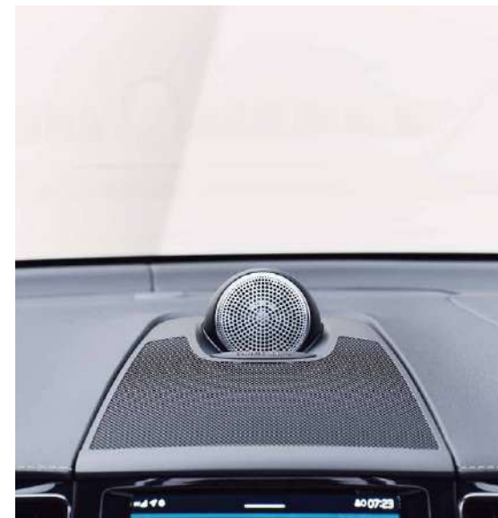
Bowers & Wilkins® 殿堂级音响系统