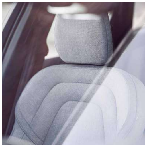
人体工程学座椅 / 高级羊毛织物面料