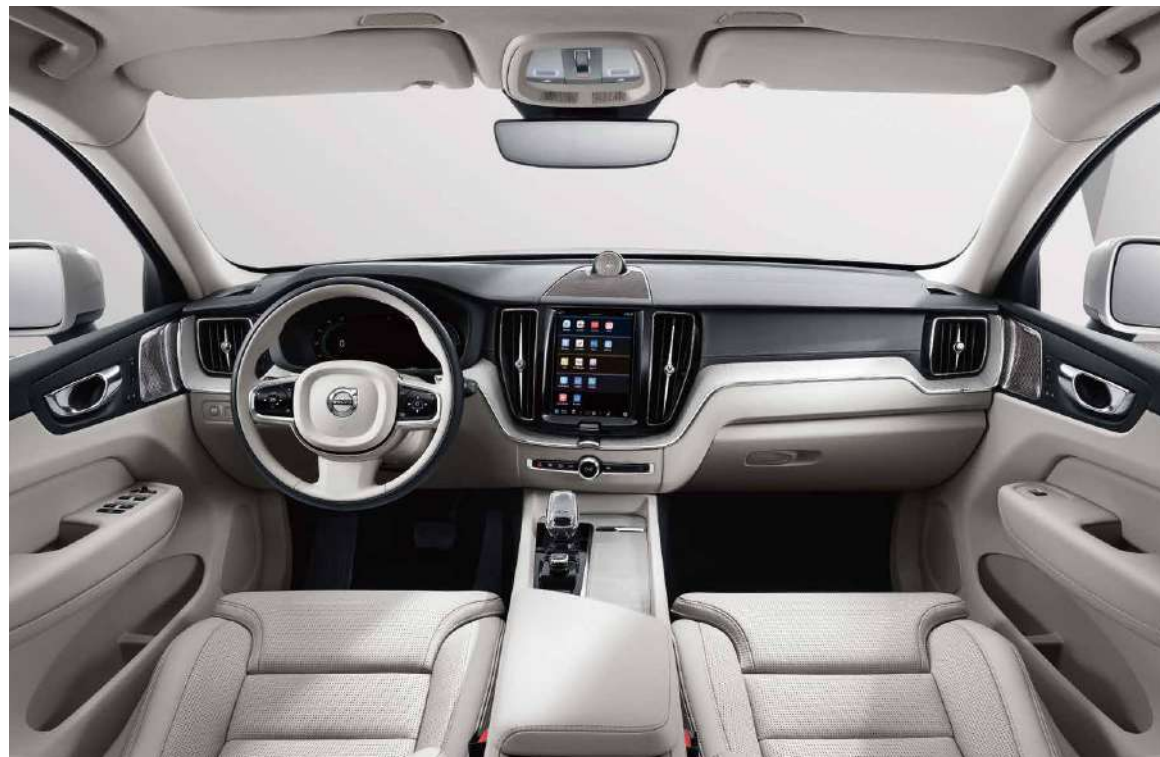
一体成型麋鹿之角座舱 / 天然漂流木内饰