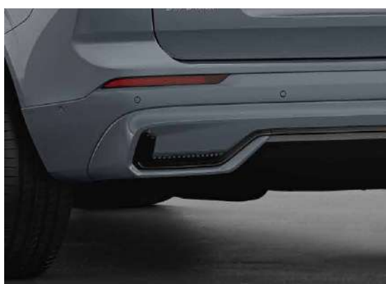
隐藏式排气尾管设计