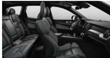
RGAR 1 B5 四驱 智远运动版 | RECHARGE T8 插电式混合动力 四驱 智远运动版 黑色内饰 | 人体工程学 灰色Nappa真皮+Open Grid 织物运动座椅 | Metal Mesh 金属网格内饰条