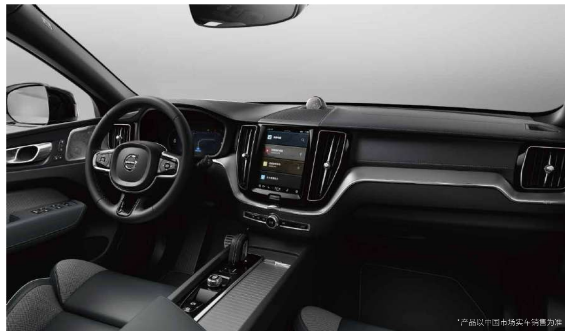
运动型皮质包裹三幅方向盘、运动型皮质包裹换挡杆