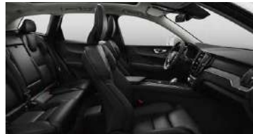
RC00 RECHARGE T8 插电式混合动力 四驱 智雅豪华版 黑色内饰 | 人体工程学 黑色高级Nappa真皮座椅 | Drift Wood 漂流木内饰条