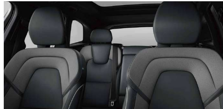
人体工程学Nappa真皮+Open Grid织物运动型座椅