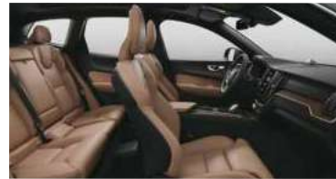
RC20 RECHARGE T8 插电式混合动力 四驱 长续航 智雅豪华版 黑色内饰 | 人体工程学 琥珀色高级Nappa座椅 | Linear Lime直纹榎木内饰条