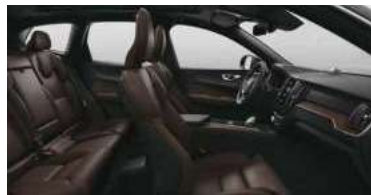
RC30 RECHARGE T8 插电式混合动力 四驱 长续航 智雅豪华版 黑色内饰 | 人体工程学 棕色高级Nappa座椅 | Linear Lime 直纹榎木内饰条