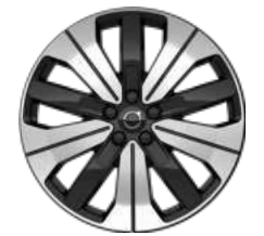
19英寸 峡湾版铝合金轮毂