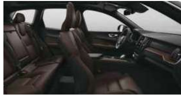
RA30 B5 四驱 智远豪华版 | RECHARGE T8 插电式混合动力 四驱 长续航 智远豪华版 黑色内饰 | 人体工程学 棕色Moritz座椅 | Linear Lime直纹榎木内饰条