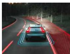
道路偏离预防系统