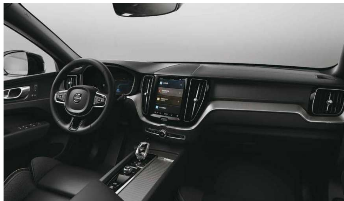
运动型皮质包裹三幅方向盘、Orrefors水晶换挡杆