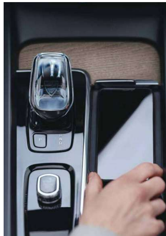
Orrrefors 水晶换挡杆 / 手机无线充电