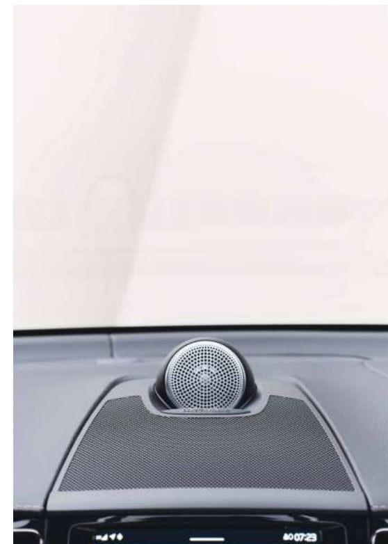
Bowers & Wilkins® 殿堂级音响系统