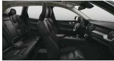
RD00 B5 四驱 智逸豪华版 黑色内饰 | 人体工程学 黑色Sakelyx皮质座椅 | Iron Ore 拉丝铝内饰条