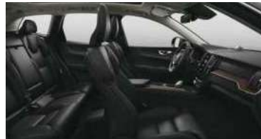
RC00 RECHARGE T8 插电式混合动力 四驱 长续航 智雅豪华版 黑色内饰 | 人体工程学 黑色高级Nappa座椅 | Linear Lime 直纹榎木内饰条