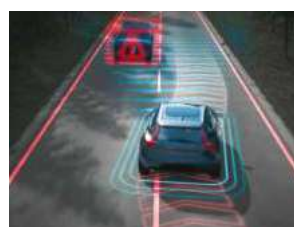
对向车辆智能避让