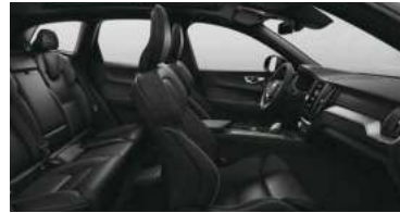
RG0R B5 四驱 智远运动版 | B5 四驱 峡湾版 | RECHARGE T8 插电式混合动力 四驱 长续航 智远运动版 黑色内饰 | 人体工程学 黑色Nappa+Open Grid 织物运动座椅 | Metal Mesh 金属网格内饰条