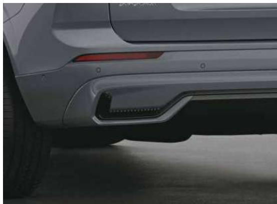
隐藏式排气尾管设计