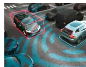
倒车车侧警示系统

安心安全, 个性化再加分 个人化安全智能管理 依据你的个人行驶数据, 为你定制专属安全智能升级方案, 从此走你的路更安心。