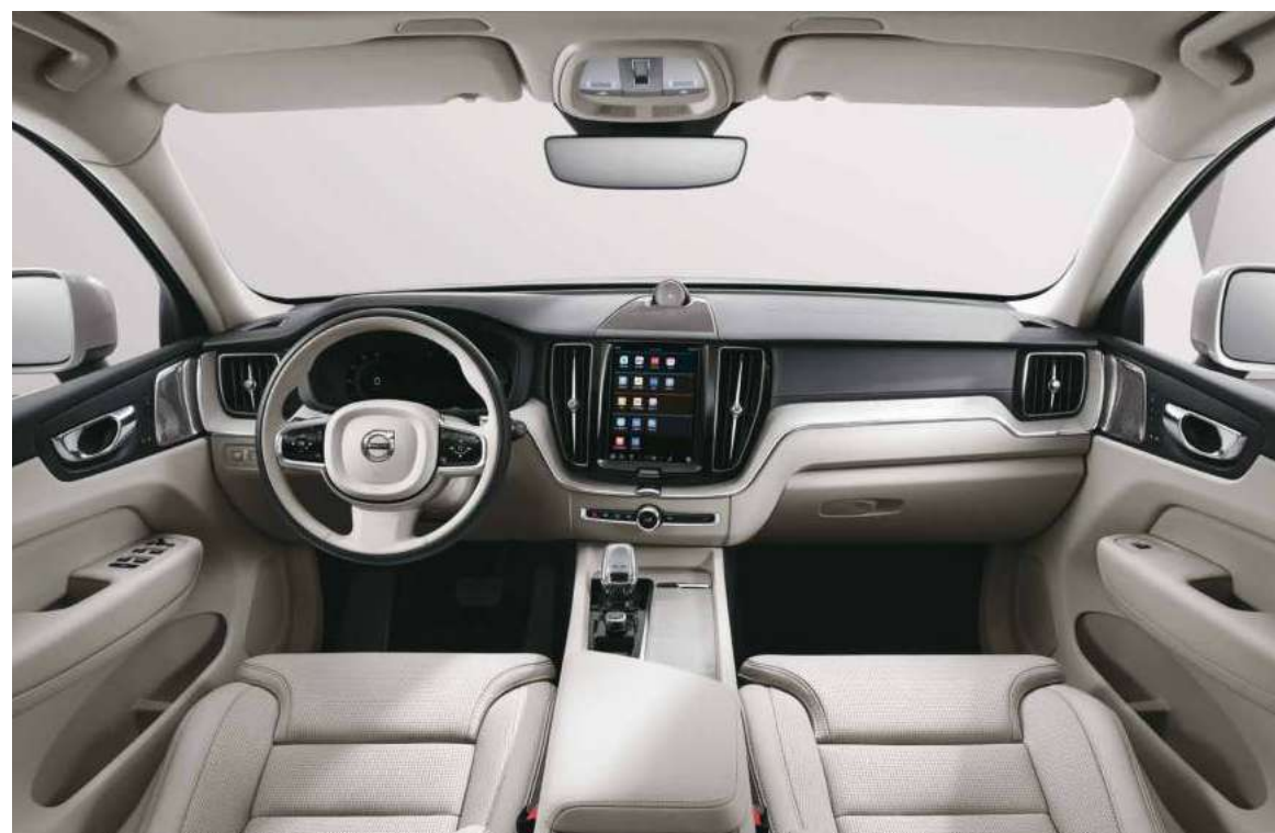
一体成型麋鹿之角座舱 / 天然漂流木内饰