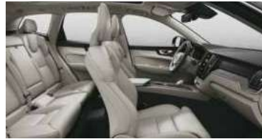
UA00 B5 四驱 智远豪华版 | RECHARGE T8 插电式混合动力 四驱 长续航 智远豪华版 米色内饰 | 人体工程学 米色Moritz座椅 | Drift Wood 漂流木内饰条