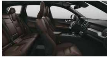
RE30 B5 四驱 智逸豪华版 黑色内饰 | 人体工程学 棕色Sakelyx皮质座椅 | Iron Ore 拉丝铝内饰条