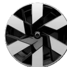
20英寸 RECHARGE 版 铝合金轮毂