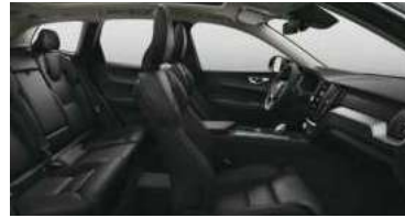
RA00 B5 四驱 智远豪华版 | RECHARGE T8 插电式混合动力 四驱 长续航 智远豪华版 黑色内饰 | 人体工程学 黑色Moritz座椅 | Metal Mesh 金属网格内饰条