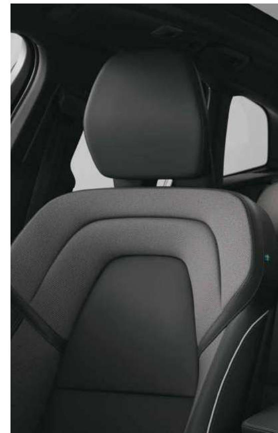
人体工程学Nappa+Open Grid织物运动型座椅