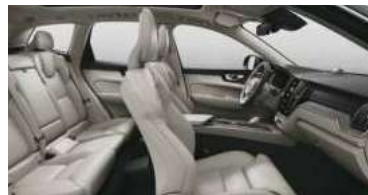
UC00 RECHARGE T8 插电式混合动力 四驱 长续航 智雅豪华版 米色内饰 | 人体工程学 米色高级Nappa座椅 | Drift Wood 漂流木内饰条