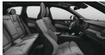
R471 RECHARGE T8 插电式混合动力 四驱 长续航 智雅豪华版(选装) 黑色内饰 | 人体工程学 浅灰色高级羊毛织物面料运动 座椅 | Drift Wood 漂流木内饰条