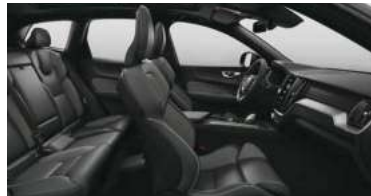
RGAR B5 四驱 智远运动版 | RECHARGE T8 插电式混合动力 四驱 长续航 智远运动版 黑色内饰 | 人体工程学 灰色Nappa+Open Grid 织物运动座椅 | Metal Mesh 金属网格内饰条