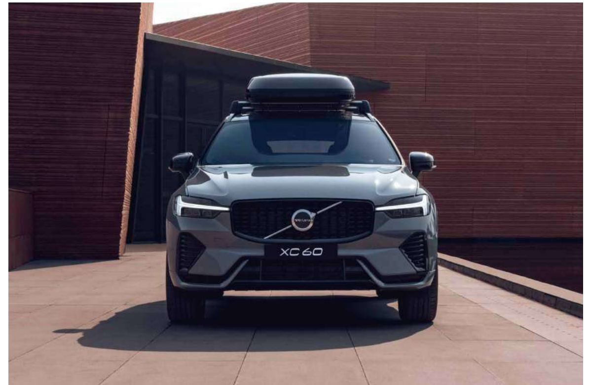
哑光黑饰条行李箱