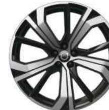
21英寸 RECHARGE 版 铝合金轮毂