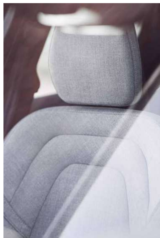
人体工程学座椅 / 高级羊毛织物面料