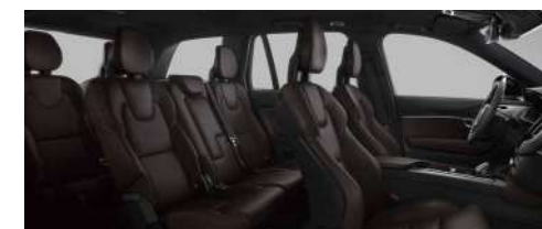
RC30 B6 智雅豪华版; RECHARGE T8 插电式混合动力 四驱 长续航 智尊豪华版 黑色内饰 | 人体工程学棕色高级 Nappa 座椅 | 黑栲木饰条