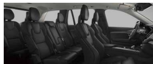
RC00 B6 智雅豪华版; RECHARGE T8 插电式混合动力 四驱 长续航 智尊豪华版 黑色内饰 | 人体工程学黑色高级 Nappa 座椅 | 灰栲木饰条