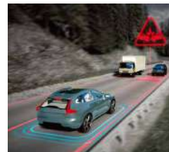
对向车辆智能避让

City Safety 城市智能安全系统如同一位出色的副驾驶员，关键时刻主动采取措施，其他时候则在后台默默守护。