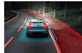
道路偏离预防系统