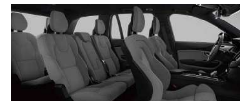
R471 RECHARGE T8 插电式混合动力 四驱 长续航 智尊豪华版 黑色内饰 | 人体工程学浅灰色高级羊毛织物运动座椅 | 黑栲木饰条