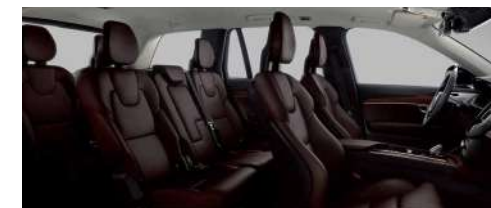
RA30 B5 智行豪华版; B6 智逸豪华版 黑色内饰 | 人体工程学棕色 Moritz 座椅 | 胡桃木饰条