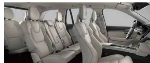
UC00 B6 智雅豪华版; RECHARGE T8 插电式混合动力 四驱 长续航 智尊豪华版 米色内饰 | 人体工程学米色高级 Nappa 座椅 | 灰栲木饰条