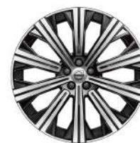
20 英寸 铝合金轮毂