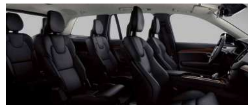
RA00 B5 智行豪华版; B6 智逸豪华版 黑色内饰 | 人体工程学黑色 Moritz 座椅 | 胡桃木饰条