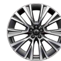
20 英寸 RECHARGE 版 铝合金轮毂