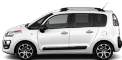
BÍLÁ BANQUISE (N)