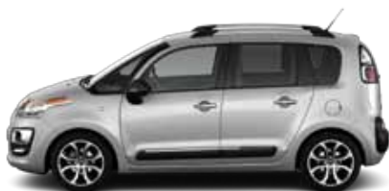
ŠEDÁ ALUMINIUM (M)