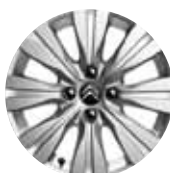
HLINÍKOVÝ DISK BLADE 16"