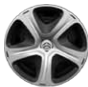
OKRASNÝ KRYT STEEL & STYLE 3D 16"