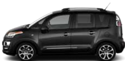
ČERNÁ PERLA NERA (P)