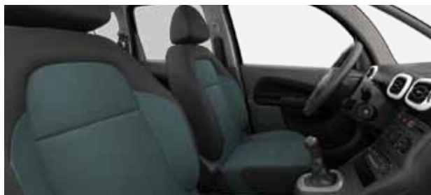
LÁTKA MICA BAHIA MODRÁ (1)