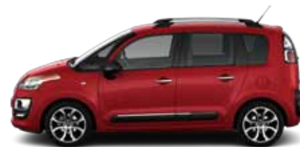
ČERVENÁ ADEN (N)