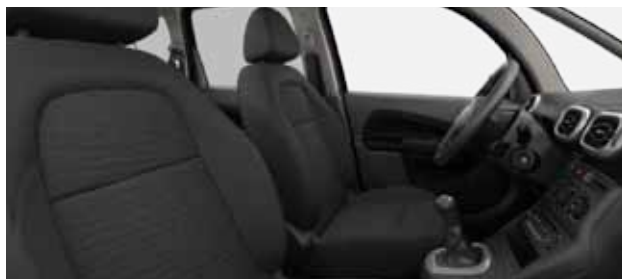
LÁTKA LIBÉRIA ŠEDÁ (1)