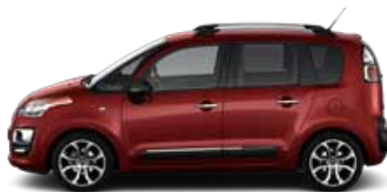
ČERVENÁ RUBI (P)