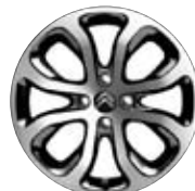
HLINÍKOVÝ DISK CLOVER 17"