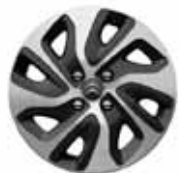
HLINÍKOVÝ DISK AIRFLOW 16"