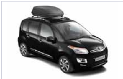
Střešní úložný box