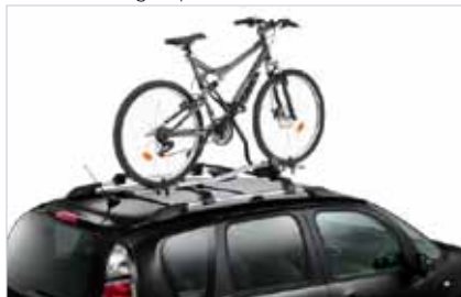
Nosič kol na střešní tyče

Pro model C3 PICASSO je k dispozici velké množství praktických prvků originálního příslušenství, které vyhoví všem Vaším přáním. Objevte celou nabídku v našem katalogu s příslušenstvím.