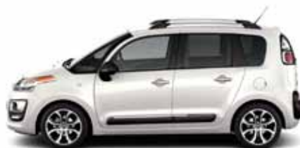
BÍLÁ NACRÉ (P)