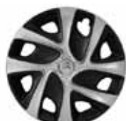
OKRASNÝ KRYT AIRFLOW 16"