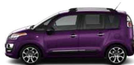
FIALOVÁ KARMA (M)