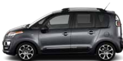
ŠEDÁ SHARK (M)