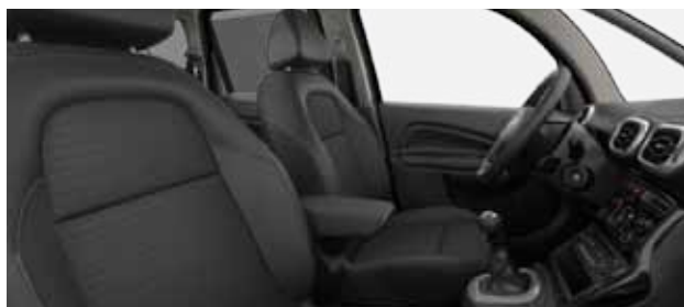
LÁTKA & KŮŽE (1)