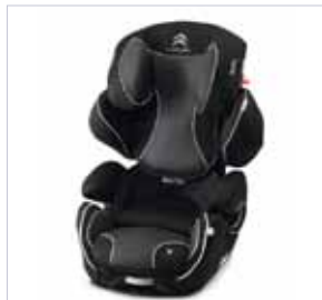
Dětská sedačka Kiddy Comfort Pro