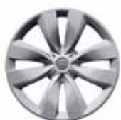
OKRASNÝ KRYT ASTÉRODÉA 15"