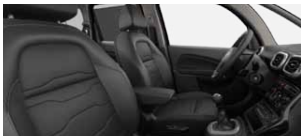
KŮŽE CLAUDIA (1)