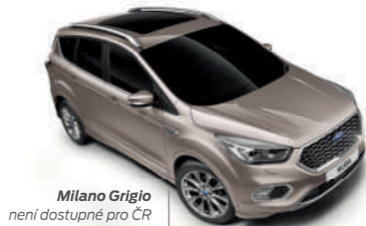
Milano Grigio není dostupné pro ČR

Vozy Ford Kuga vděčí za svůj oslnivý a odolný zevnějšek speciálnímu několikafázovému procesu lakování. Díky vstříkování vosku do ocelových částí karoserie či ochranné horní vrstvě nátěru, novým materiálům a postupům aplikace bude váš Ford Kuga vypadat dobře i za mnoho let.