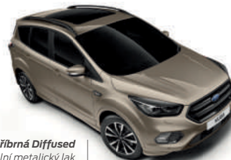
Stříbrná Diffused Speciální metalický lak karoserie*