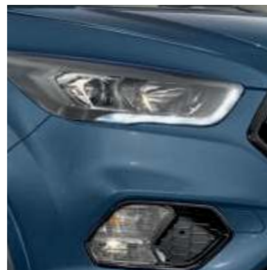
Světlomety tmavě tónované.