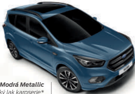
Modrá Metallic Metalický lak karoserie*