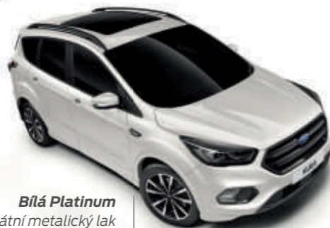
Bílá Platinum Unikátní metalický lak karoserie (4vrstvý)*