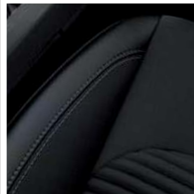
Čalounění sedadel kůže/látka.