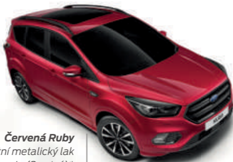
Červená Ruby Unikátní metalický lak karoserie (3vrstvý)*