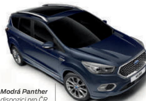
Modrá Panther není k dispozici pro ČR

*Nemetalické laky bílá Frozen, červená Race a šedá Stealth, Mica lak černá Shadow a metalické laky jsou dostupné jako výbava na přání, za příplatek. **Unikátní barva pro ST-Line Plus. Poznámka: Použité snímky vozidel slouží pouze pro ilustraci odstínů barev karoserie a nemusí přesně odpovídat aktuální specifikaci. Barvy karoserie a čalounění reprodukováné v tomto katalogu se mohou lišit od skutečných barev v důsledku omezení daných použitou tiskovou technologií.