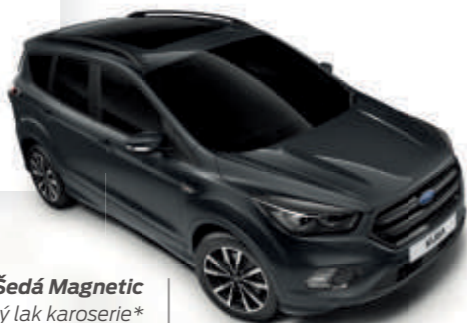
Šedá Magnetic Metalický lak karoserie*