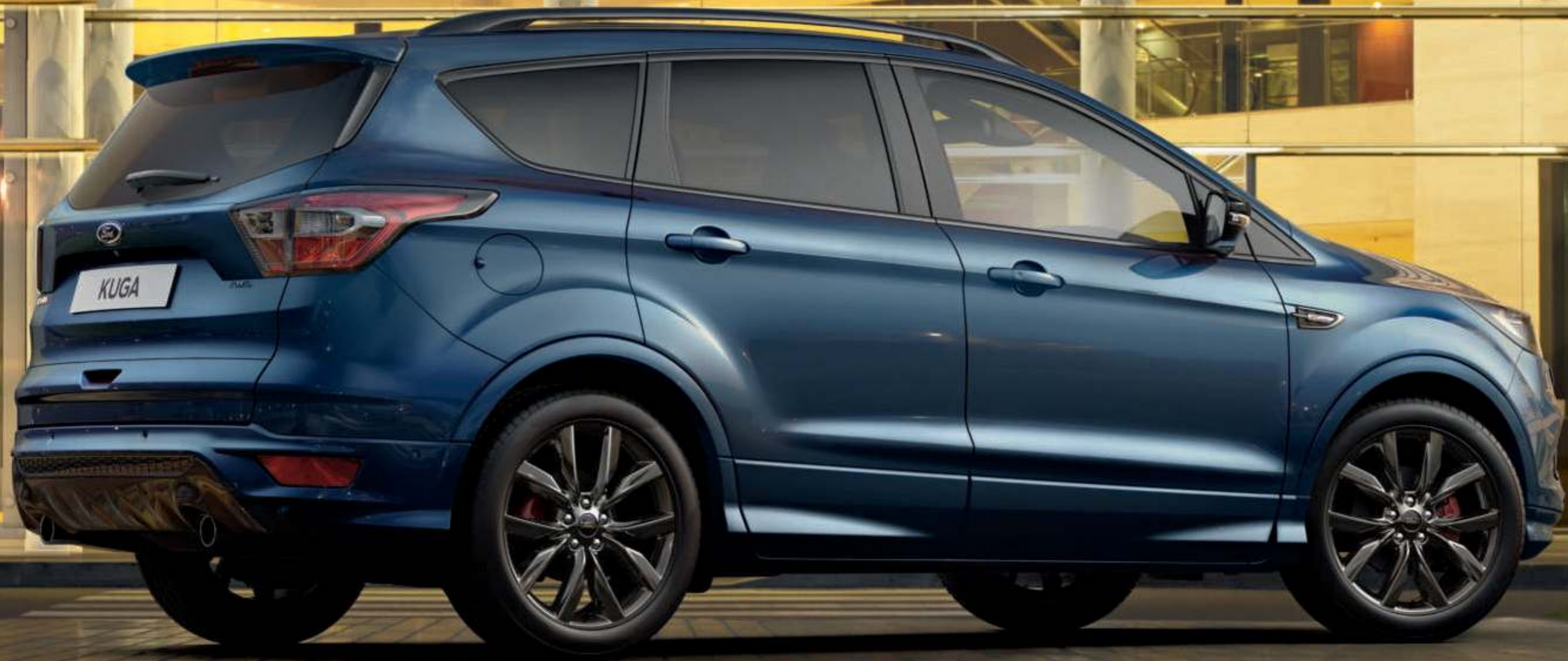
Na obrázku je model Kuga ST-Line Plus s metalickým lakem karoserie modrá Metallic a 19" koly z ľahkých slitín D2VA3 (výbava na pŕání).