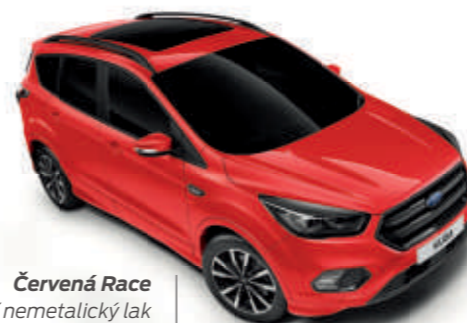
Červená Race Speciální nemetalický lak karoserie*