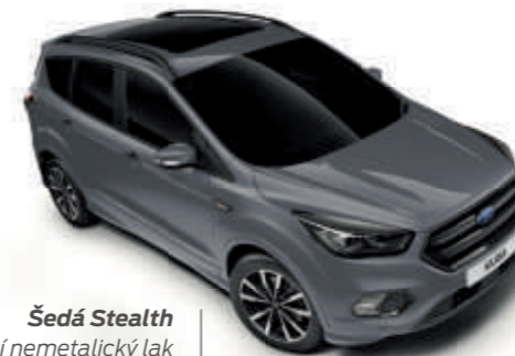
Šedá Stealth Speciální nemetalický lak karoserie**