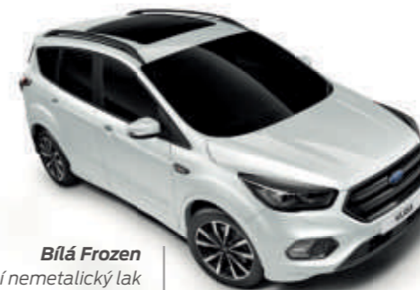
Bílá Frozen Speciální nemetalický lak karoserie*