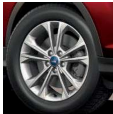
17" kola z lehkých slitin.