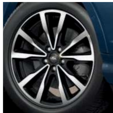
18" kola z lehkých slitin