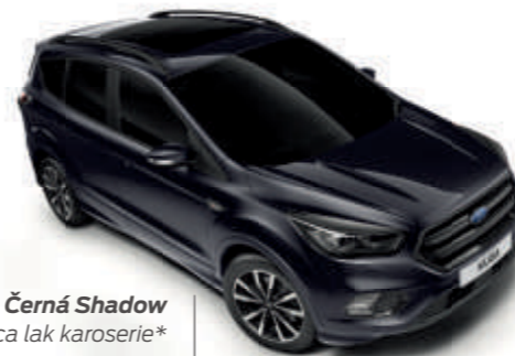
Černá Shadow Mica lak karoserie*