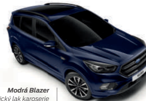
Modrá Blazer Nemetalický lak karoserie