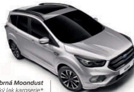
Stříbrná Moondust Metalický lak karoserie*