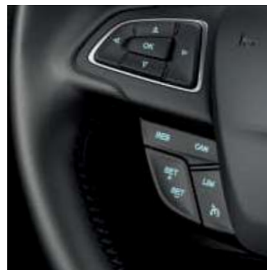
Tempomat s nastavitelným omezovačem rychlosti