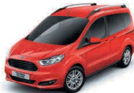
Červená Race Nemetalická barva karoserie