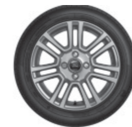
16" kola z lehkých slitin se 7 paprsky