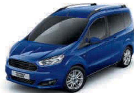
Modrá Deep Impact Metalická barva karoserie*