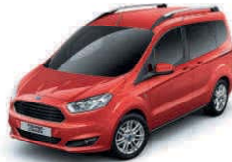
Červená Venice Speciální metalická barva karoserie*