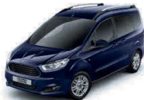
Modrá Blazer Nemetalická barva karoserie

Exteriér modelů Tourneo Courier získal na odolnosti díky důkladnému několikafázovému procesu lakování. Díky vstřikování vosku do ocelových částí karoserie či odolné horní vrstvě nátěru na bázi vody, novým materiálům a inovativním postupům aplikace bude váš vůz vypadat dobře i za mnoho let.