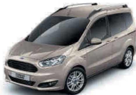
Stříbrná Tectonic Metalická barva karoserie*