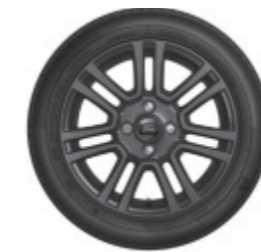
16" kola z lehkých slitin se 7 paprsky v barvě Magnetic Grey