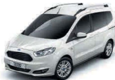
Bílá Frozen Nemetalická barva karoserie