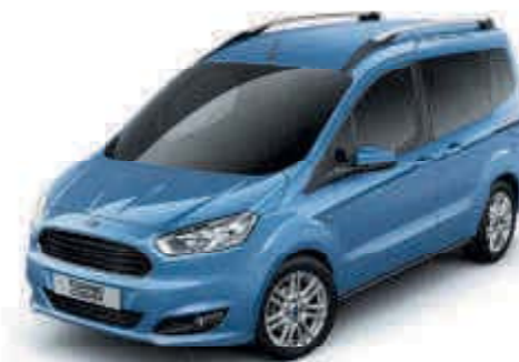
Modrá Iceberg Speciální metalická barva karoserie*