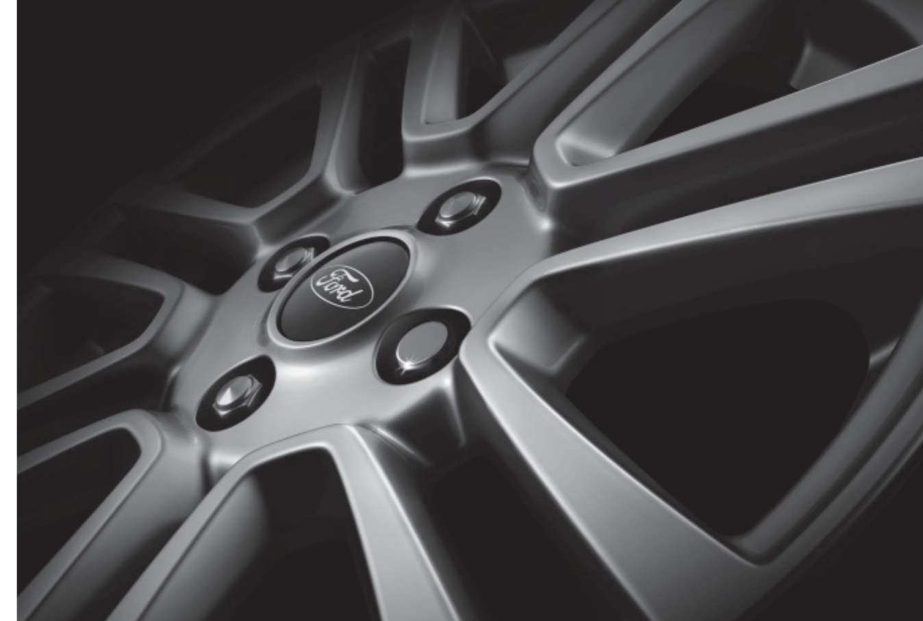
16" kola z lehkých slitin se 7 paprsky