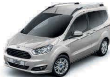
Stříbrná Moondust Metalická barva karoserie*