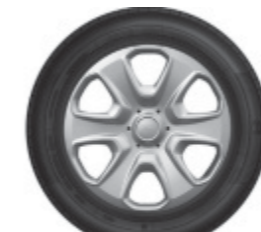
15" ocelová kola s 6 paprskovými poklicemi