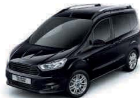
Černá Shadow Lakování Mika