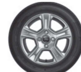
15" kola z lehkých slitin s 5 paprsky