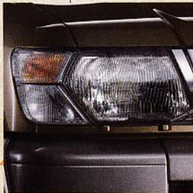
Ostřikovače předních světlometů se stěrači.