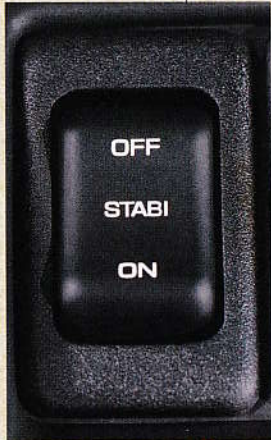
Vypínač stabilizátoru na přístrojové desce.