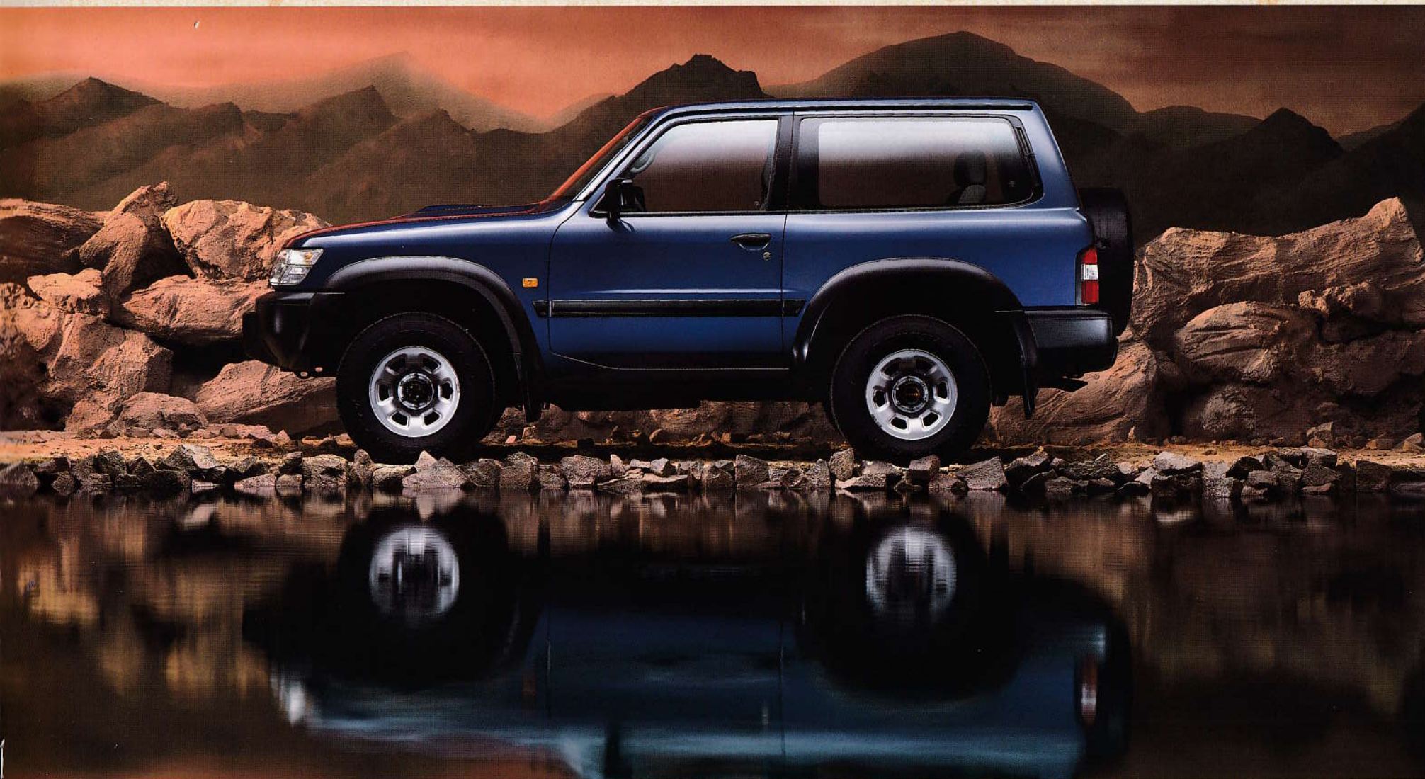
Třídveřový Hard Top.