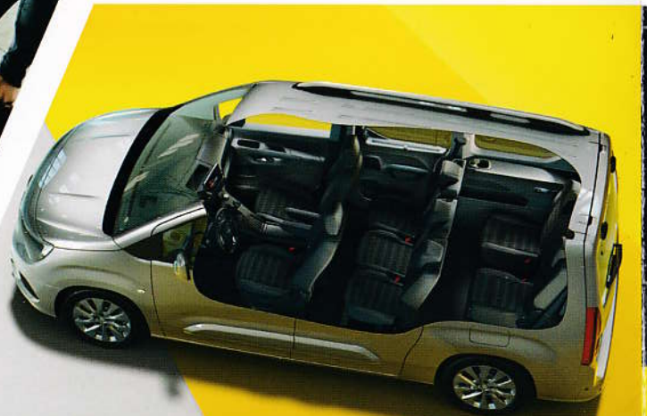
Pět nebo sedm míst k sezení