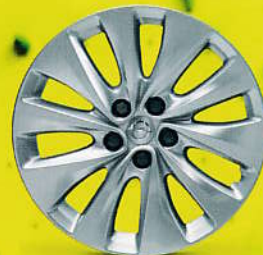
17" stříbrné ráfky z lehkých slitin