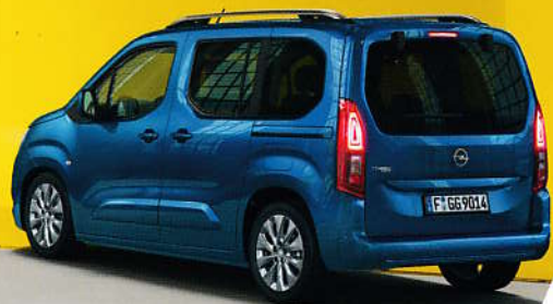
Automatické nouzové brzdění