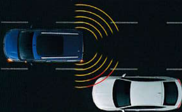
Hlídní slepého úhlu