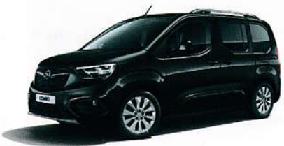
Černá Noir Perla