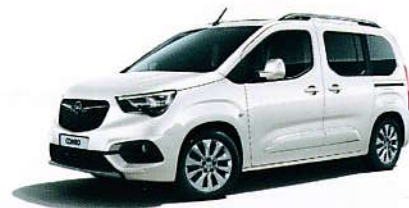
Bílá White Jade