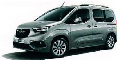
Šedá Quartz Grey