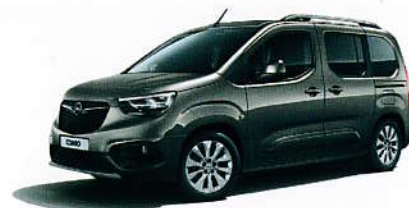
Šedá Stone Grey