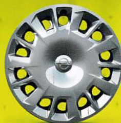
16" ocelové ráfky s kryty