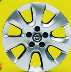
16" stříbrné ráfky z lehkých slitin