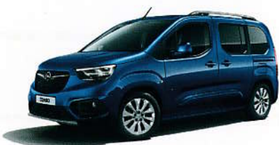
Modrá Night Blue