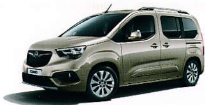
Šedá Cool Grey