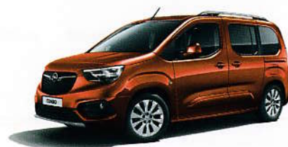
Hnědá Copper Brown