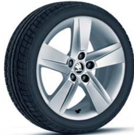
16" kola z lehké slitiny Rock