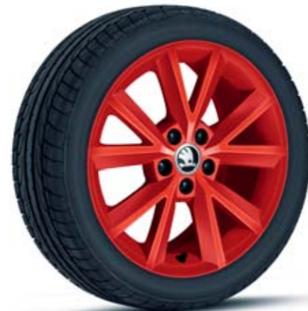
16" kola z lehké slitiny Beam, červená*