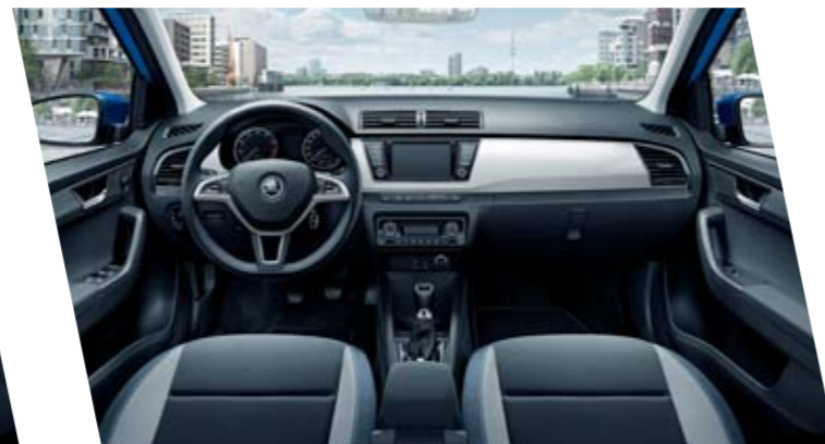
Interiér Ambition, modrý, dekor Piano White