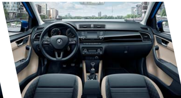
Interiér Style, béžový, dekor Piano Black