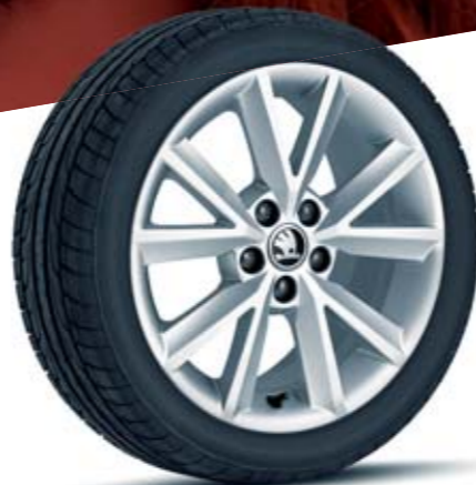
16" kola z lehké slitiny Beam, stříbrná