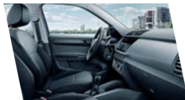
Interiér Active, černý, dekor Wild Grey Grain