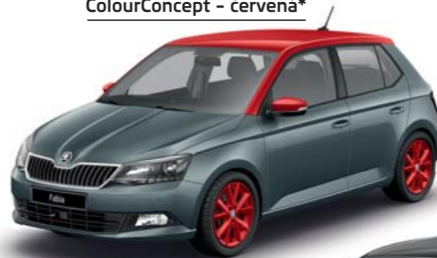
ColourConcept - červená*

Vyberte si střechu, vnější zpětná zrcátka a kola v bílém, stříbrném, červeném nebo černém provedení a zkombinujte je s barvou karoserie z naší nabídky.