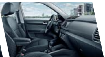
Interiér Style, černý, dekor Basket Matt