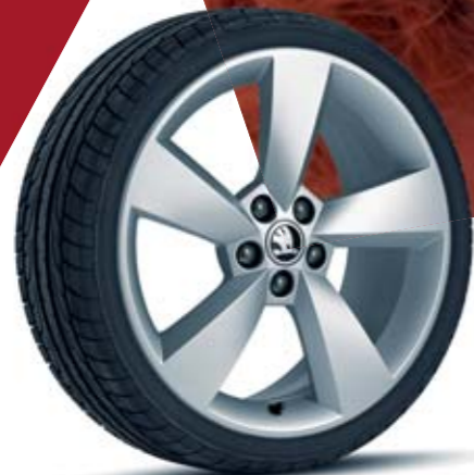
17" kola z lehké slitiny Prestige