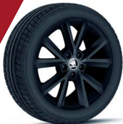
16" kola z lehké slitiny Beam, černá