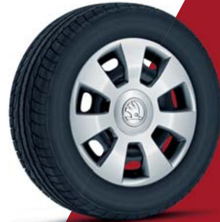
14" ocelová kola s kryty Flair

Na některých fotografiích v této brožuře je vůz vybaven 17" koly z lehké slitiny Savio v černém provedení z nabídky ŠKODA Originálního příslušenství.