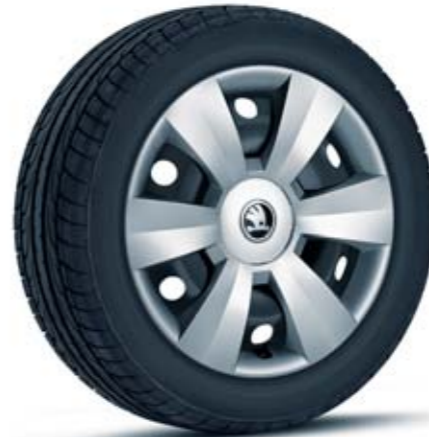
15" ocelová kola s kryty Dentro