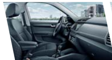
Interiér Style, černý, dekor Dark Brushed