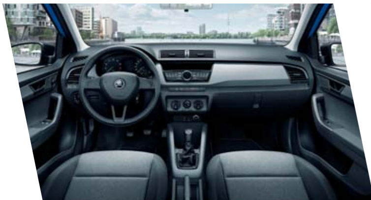
Interiér Active, černý, dekor Wild Grey Grain