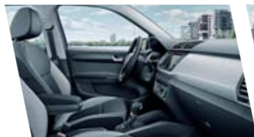
Interiér Ambition, šedý, dekor Light Brushed