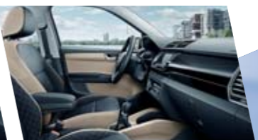
Interiér Style, béžový, dekor Piano Black