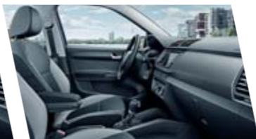
Interiér Ambition, šedý, dekor Basket Matt