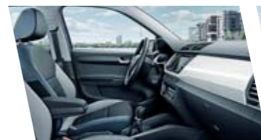
Interiér Style, modrý, dekor Piano White