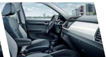
Interiér Ambition, modrý, dekor Piano White