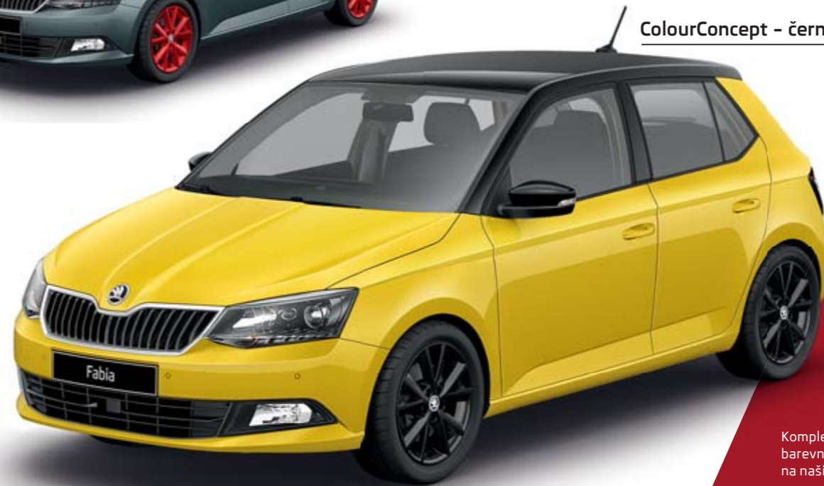
ColourConcept - černá

Kompletní přehled nabízených barevných kombinací najdete na našich webových stránkách.