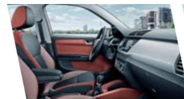
Interiér Ambition, červený, dekor Light Brushed