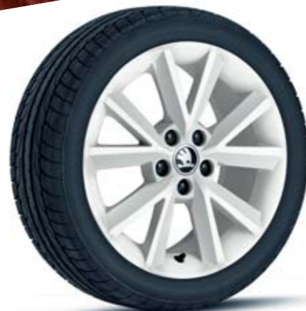
16" kola z lehké slitiny Beam, bílá