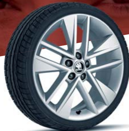
17" kola z lehké slitiny Clubber