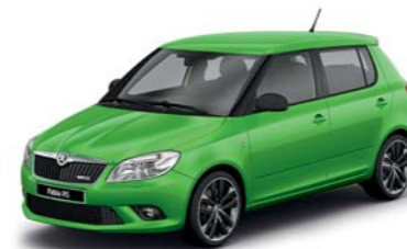
Zelená Rallye metalíza