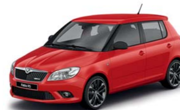
Červená Corrida uni