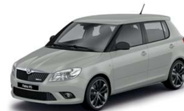
Šedá Steel uni