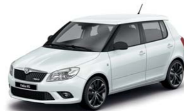
Bílá Moon metalíza