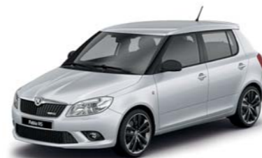
Stříbrná Brilliant metalíza