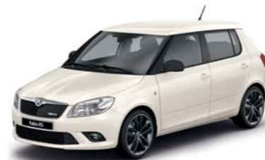
Bílá Candy uni