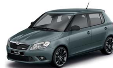
Šedá Metal metalíza