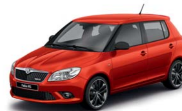
Červená Rio metalíza