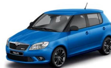
Modrá Race metalíza