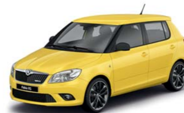
Žlutá Sprint special