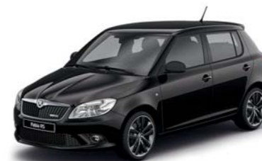
Černá Magic s perletovým efektem

Navrhňte si svůj vůz v barevném provedení, které zdůrazní Vaši individualitu. Vyberte si pro sebe tu nejlepší kombinaci vnějšího laku, barevné střechy a kol z lehké slitiny tak, aby Vaše Fabia RS odrážela Váš styl. Nabízené kombinace vnějších laků a barevných střech najdete v příložené tabulce. A jaká zvolíte kola, záleží jen na Vás.