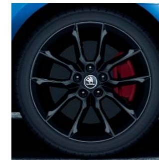
18" kola z lehké slitiny Gemini v černé barvě

Všechny vozy RS jsou standardně vybaveny červeně lakovanými brzdovými třmeny.