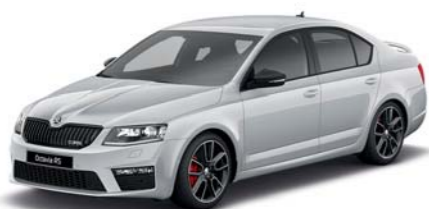
Stříbrná Brilliant metaliza