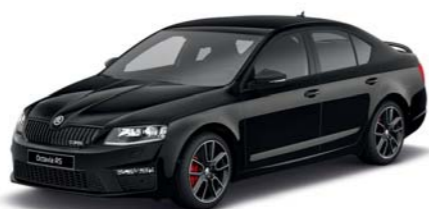
Černá Magic s perleťovým efektem*

* Barva je k dispozici i pro verzi RS 230. Pro základní verzi vozu RS jsou dostupné všechny barvy. Vyobrazené vozy jsou vybaveny černým designovým paketem z nabídky mimořádných výbav.