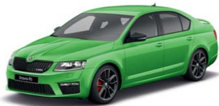
Zelená Rallye metaliza