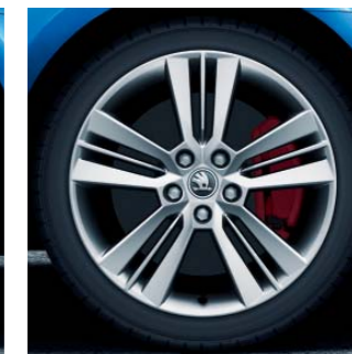
18" kola z lehké slitiny Pictoris