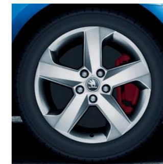
17" kola z lehké slitiny Dorado

Interiér v kombinaci látky/kůže/umělá kůže s červeným prošitím, se sportovními předními sedadly a s integrovanými hlavovými opěrkami.