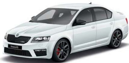
Bílá Moon metaliza*