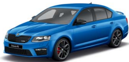
Modrá Race metaliza