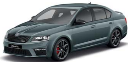
Šedá Quartz metaliza