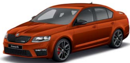
Červená Rio metaliza