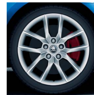
18" kola z lehké slitiny Gemini