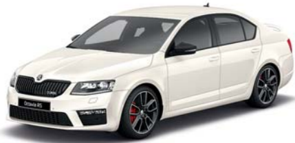
Bílá Candy uni