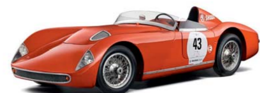
ŠKODA 1100 OHC, Spider, cca 1957