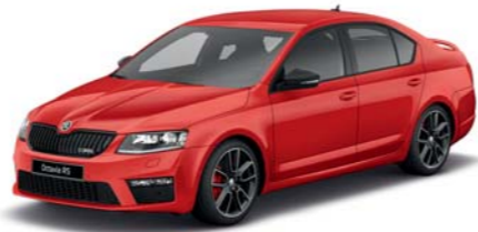
Červená Corrida uni*