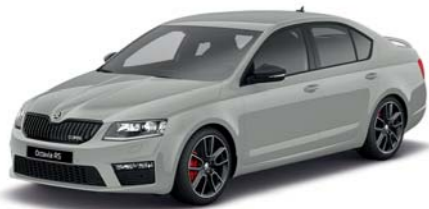
Šedá Steel uni*