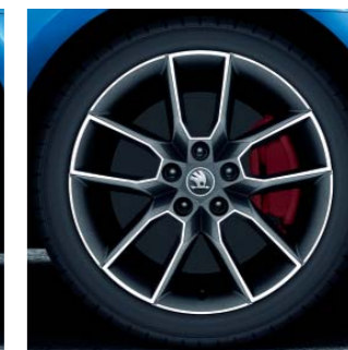
18" kola z lehké slitiny Gemini v antracitové barvě