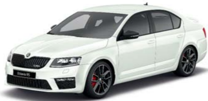
Bílá Laser uni