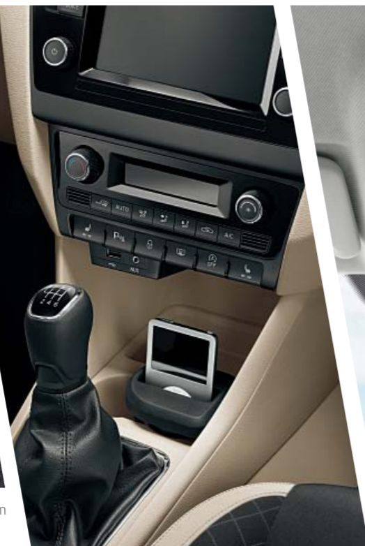
K bezpečnému převážení externích přístrojů je určen držák na multimediální přístroje, který lze umístit do dvojitého držáku nápojů ve středové konzole.