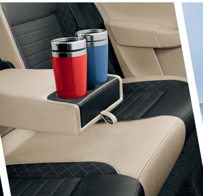
Sklopná loketní opěra vzadu s integrovaným držákem na dva nápoje dává cestujícím na zadních sedadlech možnost užívat si jízdu i občerstvení.