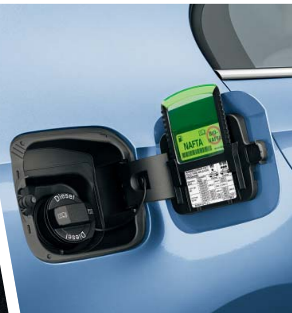
Škrabka na led, umístěná na krytu palivové nádrže, bude ve chvíli, kdy ji potřebujete, po ruce. A navíc nevádí, že ji sem odkládáte mokrou.