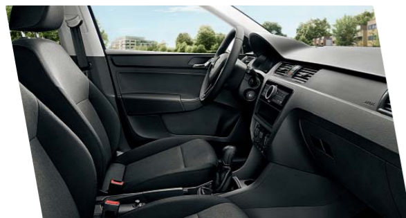
Interiér Active, černý

Verze Active nabízí černé dekorativní prvky jako kliky dveří, rámečky ventilace a rámečky přístrojů ve sdruženém panelu. Základní výbava zahrnuje například elektrické ovládání oken vpředu a výškově nastavitelná přední sedadla.