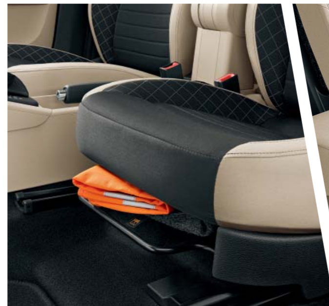
Jeden z mnoha Simply Clever prvků se nachází pod sedadlem řidiče. Najdete tu speciální kapsu na výstražnou vestu, kterou máte v případě potřeby okamžitě k dispozici.