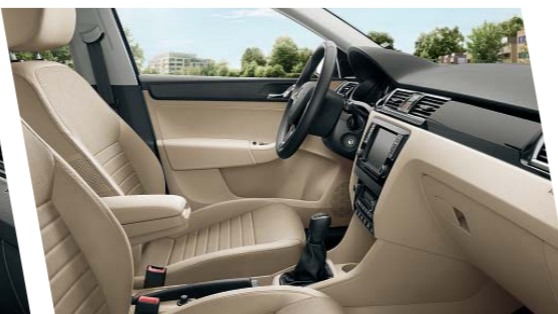
Interiér Style, béžová látka-umělá kůže, dekor Piano Black