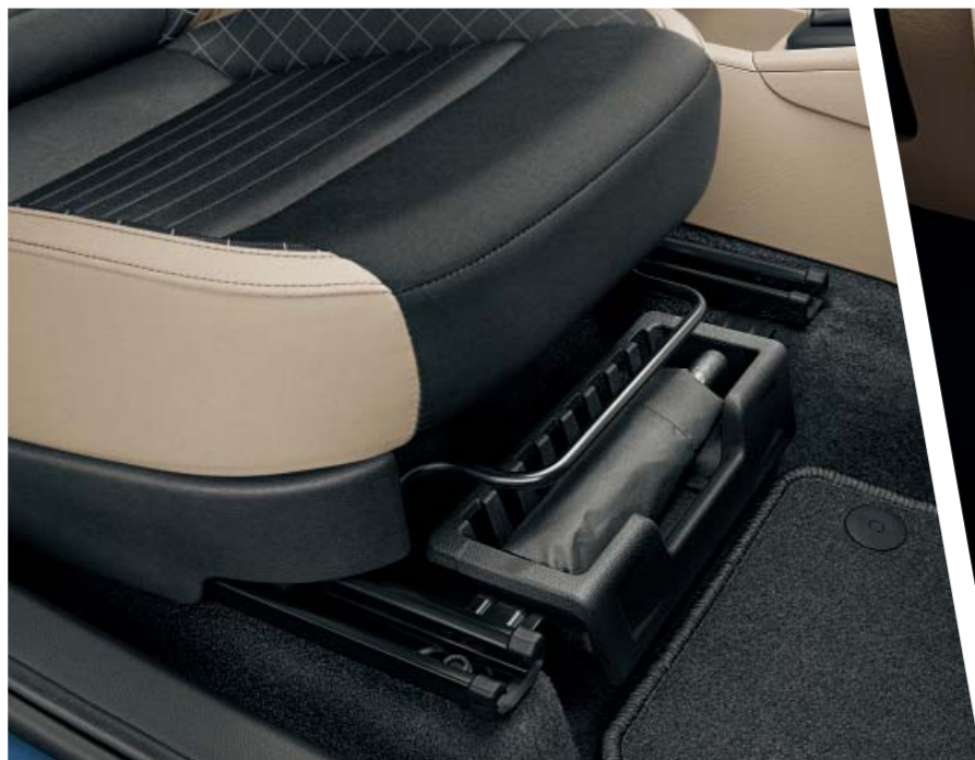
Pod pravým předním sedadlem může být umístěna schránka s originálním deštníkem ŠKODA.

Důmyslné detaily či řešení, včetně úložných míst v interiéru, podstatně zvyšují praktičnost vozu. Dokážou totiž jednoduše znásobit jeho přepravní možnosti, pomáhají Vám udržet pořádek a zpříjemňují celé posádce cestování.