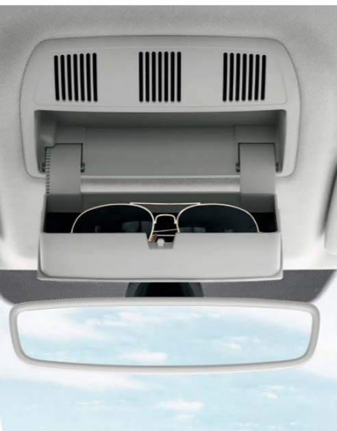
Schránku na brýle umístěnou nad zpětným zrcátkem uvítají zejména řidiči, kteří si před jízdou mění sluneční brýle za dioptrické.