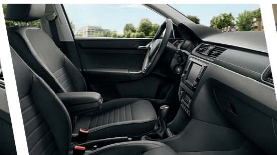
Interiér Style, černá látka-umělá kůže, dekor Dark Brushed