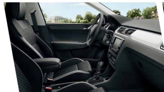
Interiér Dynamic, dekor Piano White