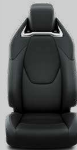
Čalúnenie pravá / syntetická koža čierne Pre paket VIP