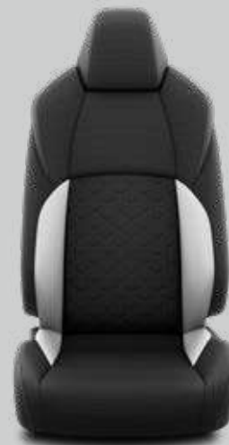
Látkové čalúnenie svetlé Pre výbavu Comfort, pakety Business a Business Hybrid