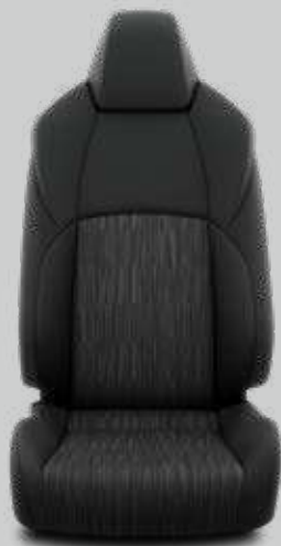
Látkové čalúnenie čierne Pre výbavu Active