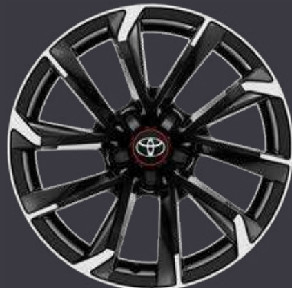
18" zliatinové disky kolies, pneumatiky 225/40 R18 Pre výbavu GR Sport s paketom Dynamic (okrem TS 1.8 Hybrid)