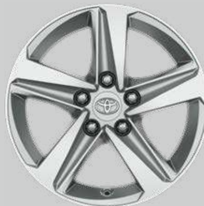
16" zliatinové disky kolies