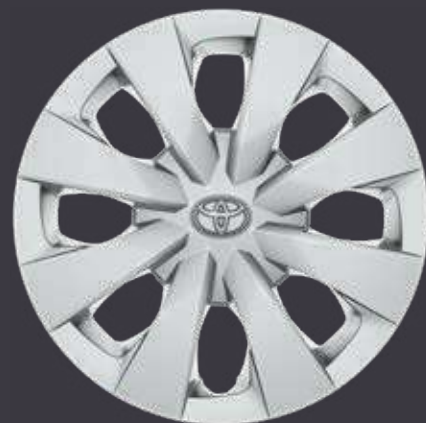
15" ocelové disky kolies s ozdobnými krytmi, pneumatiky 195/65 R15 Pre výbavu Active