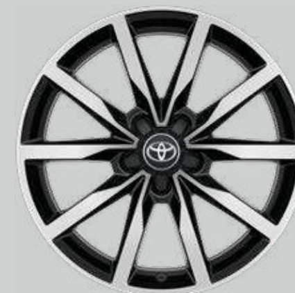
18" zliatinové brúsené disky kolies