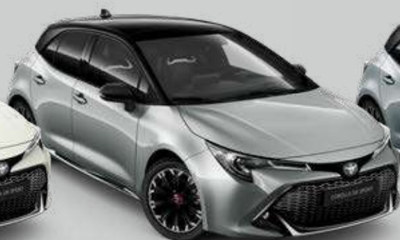
2TX* Strieborná – metalická so strechou v čiernej farbe