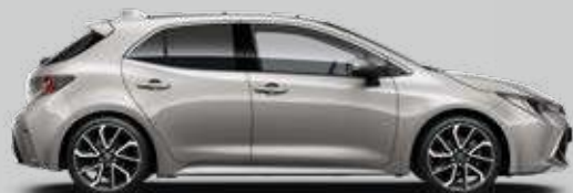
1J6 Strieborná – zamatová Špeciálny lak