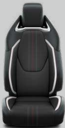
Čalúnenie textilné / syntetická koža v dizajne GR Sport s červeno-sivým prešívaním Pre výbavu GR Sport