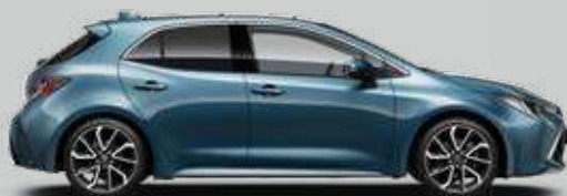
8U6 Modrá – Denim Metalický lak