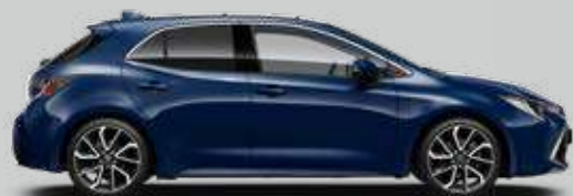
8X8 Modrá - temná Metalický lak