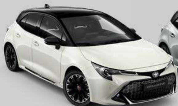
2PU* Biela – platinová so strechou v čiernej farbe