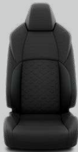
Látkové čalúnenie čierne Pre výbavu Comfort, pakety Business a Business Hybrid