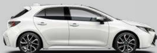
040 Biela – čistá Štandardný lak