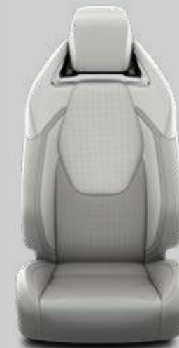
Čalúnenie pravá / syntetická koža svetlé Pre paket VIP