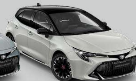
2RZ* Sivá – Dynamic so strechou v čiernej farbe