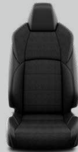
Čalúnenie prémiové textilné / syntetická koža čierne Pre paket Style