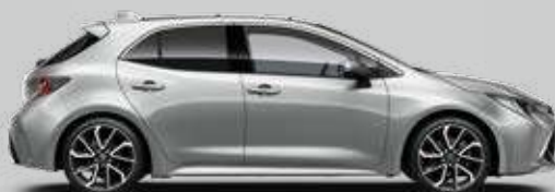
1L0 Strieborná – metalická Metalický lak