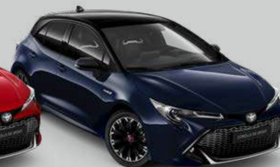
2UQ* Modrá – tmná so strechou v čiernej farbe