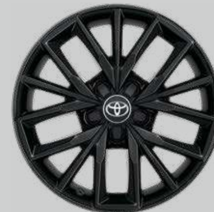
17" čierne zliatinové disky kolies