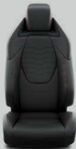
Čalúnenie textilné / syntetická koža čierne Pre výbavu Executive