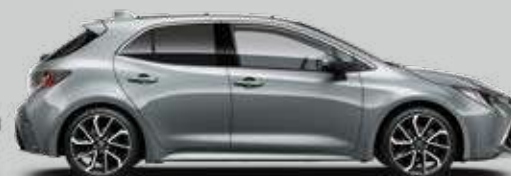
1H5 Sivá – Manhattan Metalický lak