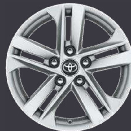
16" zliatinové disky kolies, pneumatiky 205/55 R16 Pre výbavu Comfort, paket Business Hybrid