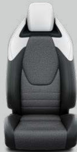
Čalúnenie textilné / syntetická koža svetlé Pre výbavu Executive