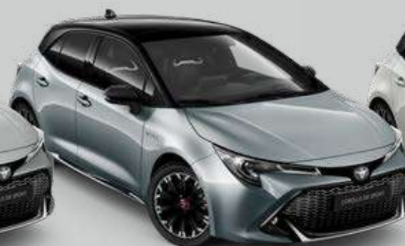
2QS* Sivá – Manhattan so strechou v čiernej farbe