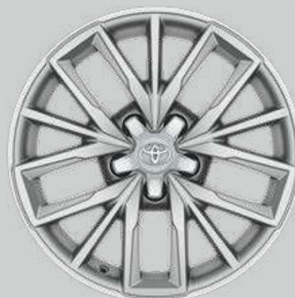
17" strieborné zliatinové disky kolies