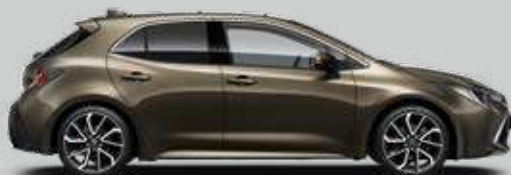
6X1 Bronzová – oxid Metalický lak