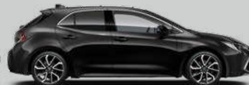
209 Čierna – nočná obloha Metalický lak