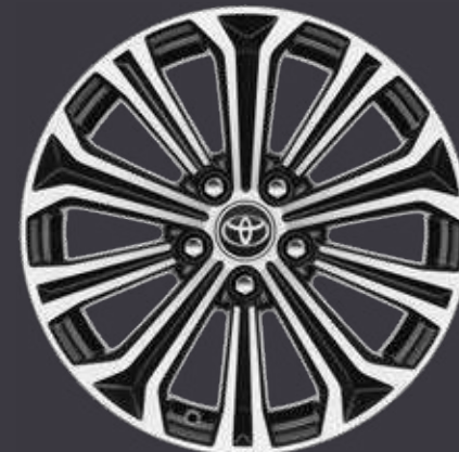
17" zliatinové disky kolies, pneumatiky 225/45 R17 Pre výbavu Executive