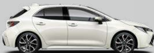
089 Biela – platinová Perleťový lak