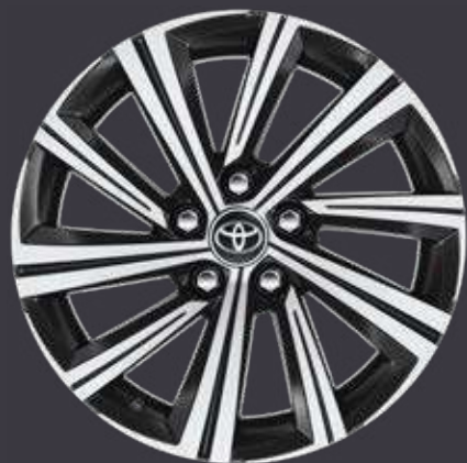
17" zliatinové disky kolies, pneumatiky 225/45 R17 Pre paket Style