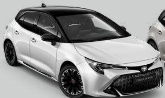
2NR* Biela – čistá so strechou v čiernej farbe