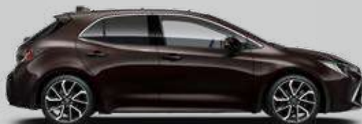
4W9 Hnedá – kávové zrnko Metalický lak