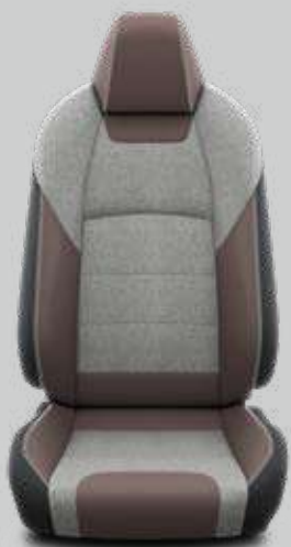
Látkové čalúnenie hnedo-sivé s bielym prešívaním Pre výbavu Trek