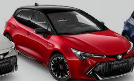
2SZ* Červená – karmínová so strechou v čiernej farbe