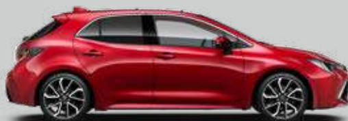
3U5 Červená – karmínová Špeciálny lak