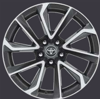
18" zliatinové disky kolies, pneumatiky 225/40 R18 Pre paket VIP