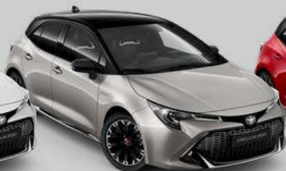
2RD* Strieborná – zamatová so strechou v čiernej farbe