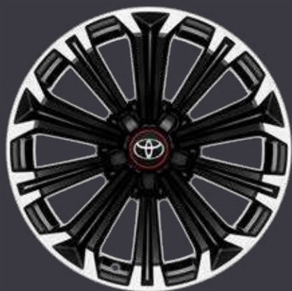
17" zliatinové disky kolies, pneumatiky 225/45 R17 Pre výbavu GR Sport