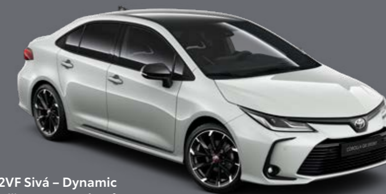
2VF Sivá – Dynamic s čiernou strechou §