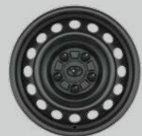
15" ocelové disky kolies Voliteľne