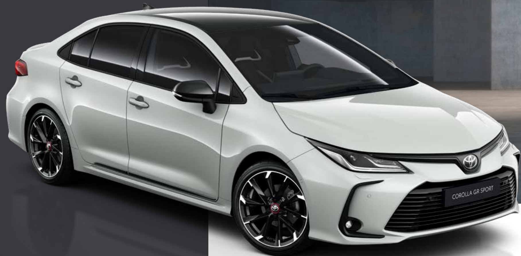
Zobrazená výbava: GR SPORT Hybrid s paketom Dynamic.