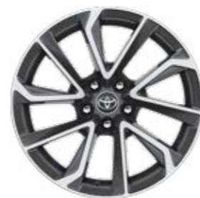
18" zliatinové disky kolies Štandard pre Executive s paketom VIP