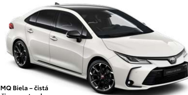
2MQ Biela – čistá s čiernou strechou