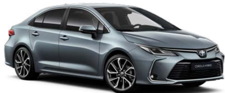
1K3 Sivá – celestín §