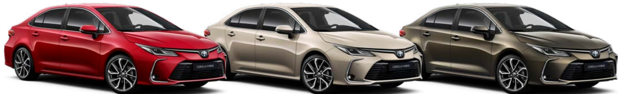
3U5 Červená – karmínová