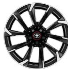
18" zliatinové disky kolies, pneumatiky 225/40 R18 Štandard pre GR SPORT s paketom Dynamic