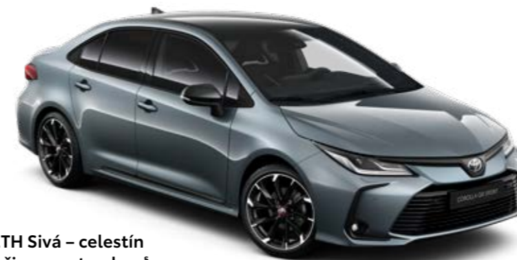
2TH Sivá – celestín s čiernou strechou §