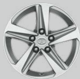
16" strieborné zliatinové disky kolies Voliteľne