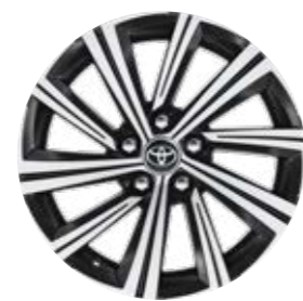
17" zliatinové disky kolies Štandard pre Comfort s paketom Style Štandard pre Executive