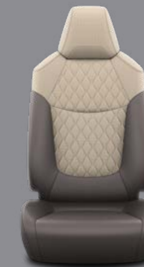
Hnedé látkové čalúnenie v kombinácii s kožou a svetlým prešivaním Štandard pre výbavu Executive