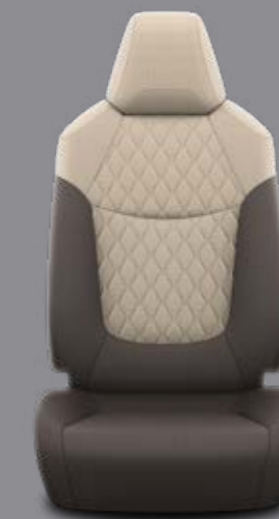
Hnedé látkové čalúnenie s prešivanými svetlými panelmi Štandard pre výbavu Active Hybrid, Active Business a Comfort