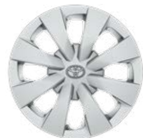
15" ocelové disky kolies s ozdobnými krytmí Štandard pre Active