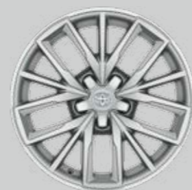
17" strieborné zliatinové disky kolies Voliteľne