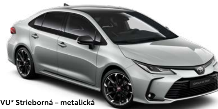
2VU* Strieborná – metalická s čiernou strechou §