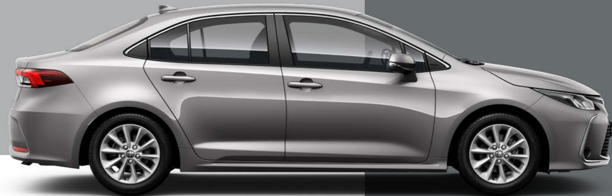
Zobrazená výbava: Comfort Hybrid.

DIZAJN, INTERIÉROVÉ PREVEDENIE A PRVKY VÝBAVY NAVRHNUTÉ TAK, ABY VÁM AJ VAŠIM PASAŽIEROM PONÚKLI NIEČO VIAC.