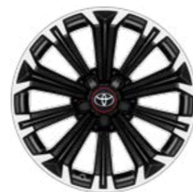
17" zliatinové disky kolies, pneumatiky 225/45 R17 Štandard pre GR SPORT