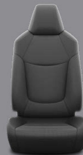
Látkové čalúnenie čierne Štandard pre výbavu Active, konvečný motor