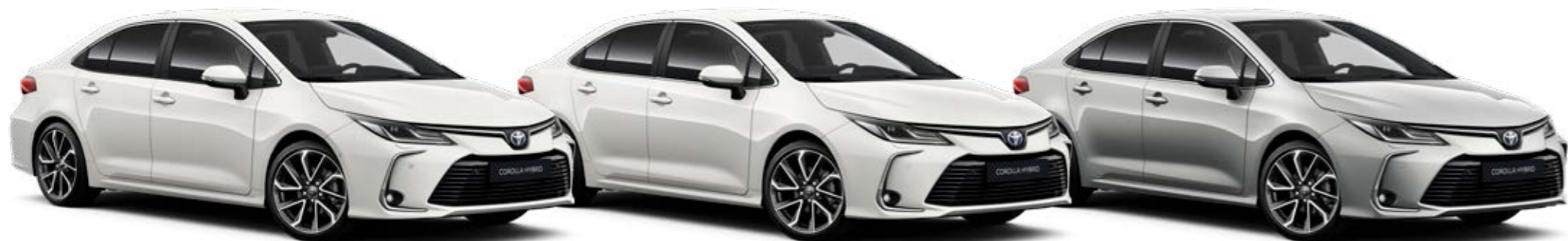
040 Biela – čistá