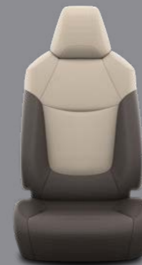
Látkové čalúnenie hnedé so svetlými panelmi Štandard pre výbavu Active, konvečný motor