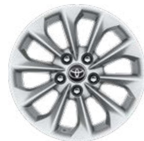
16" zliatinové disky kolies Štandard pre Comfort