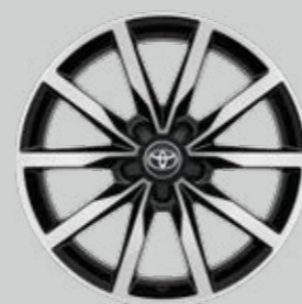
18" zliatinové disky kolies Voliteľne