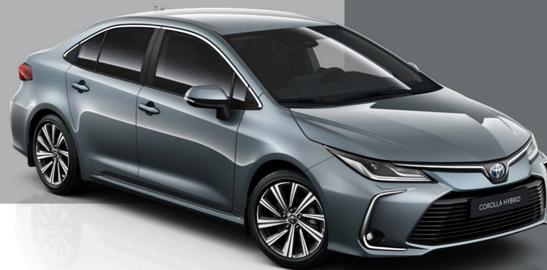
Zobrazená výbava: Executive Hybrid.

COROLLA SEDAN VO SVOJOM NAJLEPŠOM PREVEDENÍ – PONÚKA PRÉMIOVÚ ÚPRAVU INTERIÉRU AJ EXTERIÉRU, BEZKONKURENČNÝ KOMFORT A INOVATÍVNE TECHNOLOGIE.