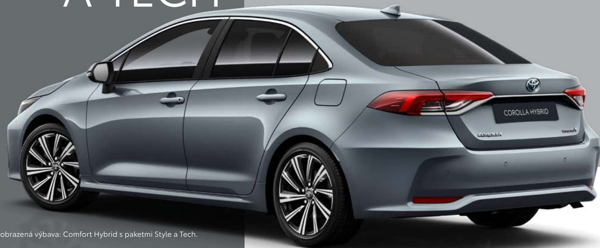
Zobrazená výbava: Comfort Hybrid s paketmi Style a Tech.

MNOŽSTVO NOVÝCH TECHNOLOGIÍ A EXTRA ŠTÝL – PRE TÝCH, KTORÍ TÚŽIA PO VOZIDLE ODRÁŽAJÚCOM ICH AMBÍCIE, AKO AJ ŽIVOTNÝ ŠTÝL.