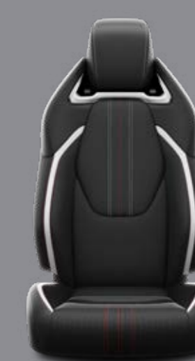
Látkové čalúnenie v kombinácii so syntetickou kožou v dizajne GR SPORT s červeno-sivým prešivaním Pre výbavu GR SPORT