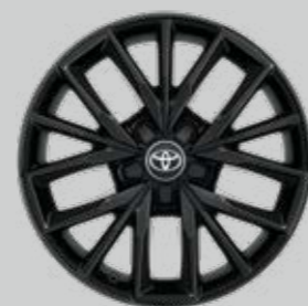
17" čierne zliatinové disky kolies Voliteľne