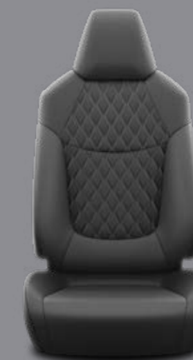
Prešivané čierne látkové čalúnenie v kombinácii s kožou Štandard pre výbavu Executive