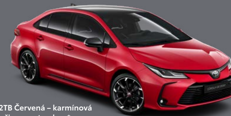
2TB Červená – karmínová s čiernou strechou*

Dostupnosť jednotlivých farieb karosérie sa môže líšiť v závislosti od výbavy.