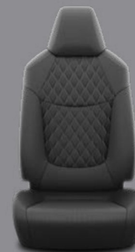
Čierne látkové čalúnenie s prešivanými panelmi Štandard pre výbavu Active Hybrid, Active Business a Comfort