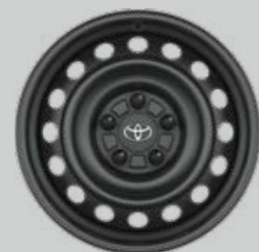
16" ocelové disky kolies Voliteľne