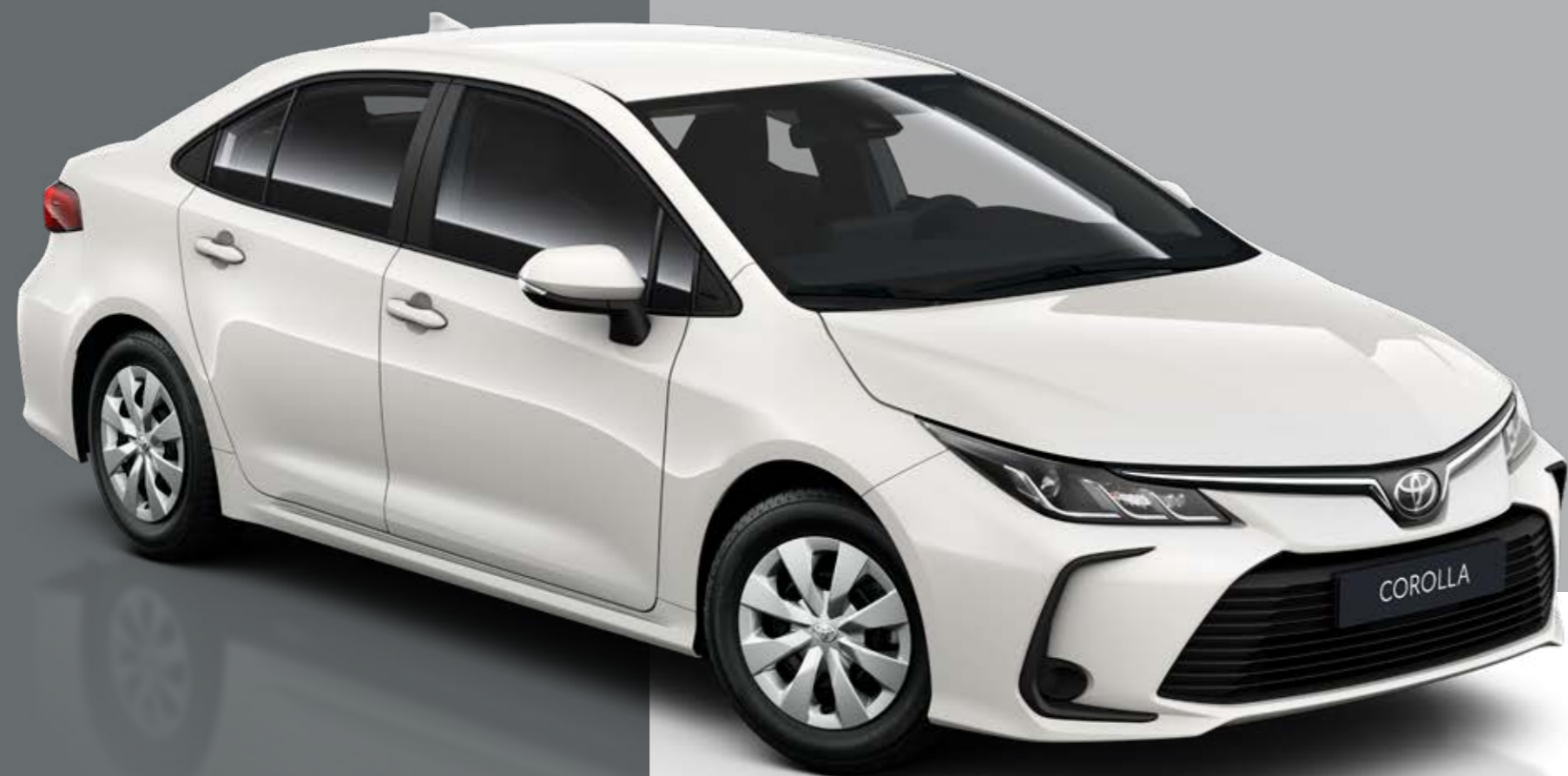
Zobrazená výbava: Active.

VYNIKAJÚCO SKOMBINOVANÉ ZÁKLADNÉ PRVKY VÝBAVY – OD POKROKOVÉHO BEZPEČNOSTNÉHO SYSTÉMU TOYOTA SAFETY SENSE AŽ PO KOMFORT PRE VŠETKÝCH CESTUJÚCICH.