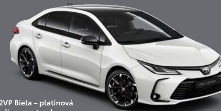
2VP Biela – platinová s čiernou strechou