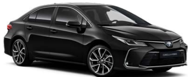
209 Čierna – nočná obloha §