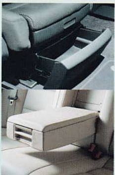
Ablagepaket* Schubladen unter den Vordersitzen

Raum ist im Audi A4 Avant nicht nur eine Frage der Abmessungen – sondern auch eine Frage der Variabilität. Das überaus großzügige Platzangebot im Innen- und Gepäckraum eröffnet Ihnen ungeahnte Möglichkeiten – besonders durch die unterschiedlichen Kombinationen der serienmäßigen Elemente Gepäckraumabdeckung, geteilt umklappbare Rück Sitzlehne, Trennnetz, zusätzliche Staufächer und doppelter Gepäckraumboden mit darunter liegender Schmutzwanne. Insgesamt wird Ihnen sofort auffallen: auch im Gepäckraum werden hochwertige Materialien höchsten Ansprüchen gerecht.