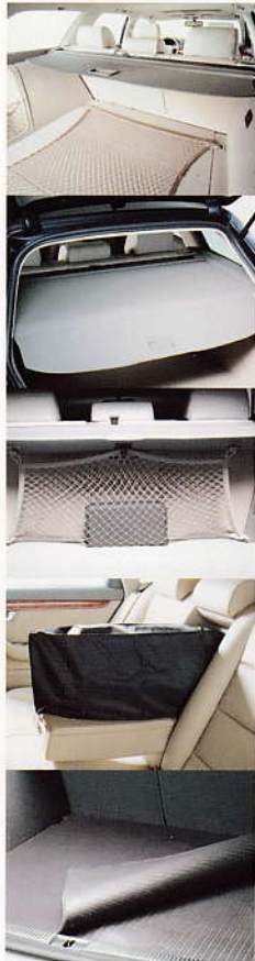
Kombi-Kassette mit herausnehmbarer Gepäckraumabdeckung und Trennnetz