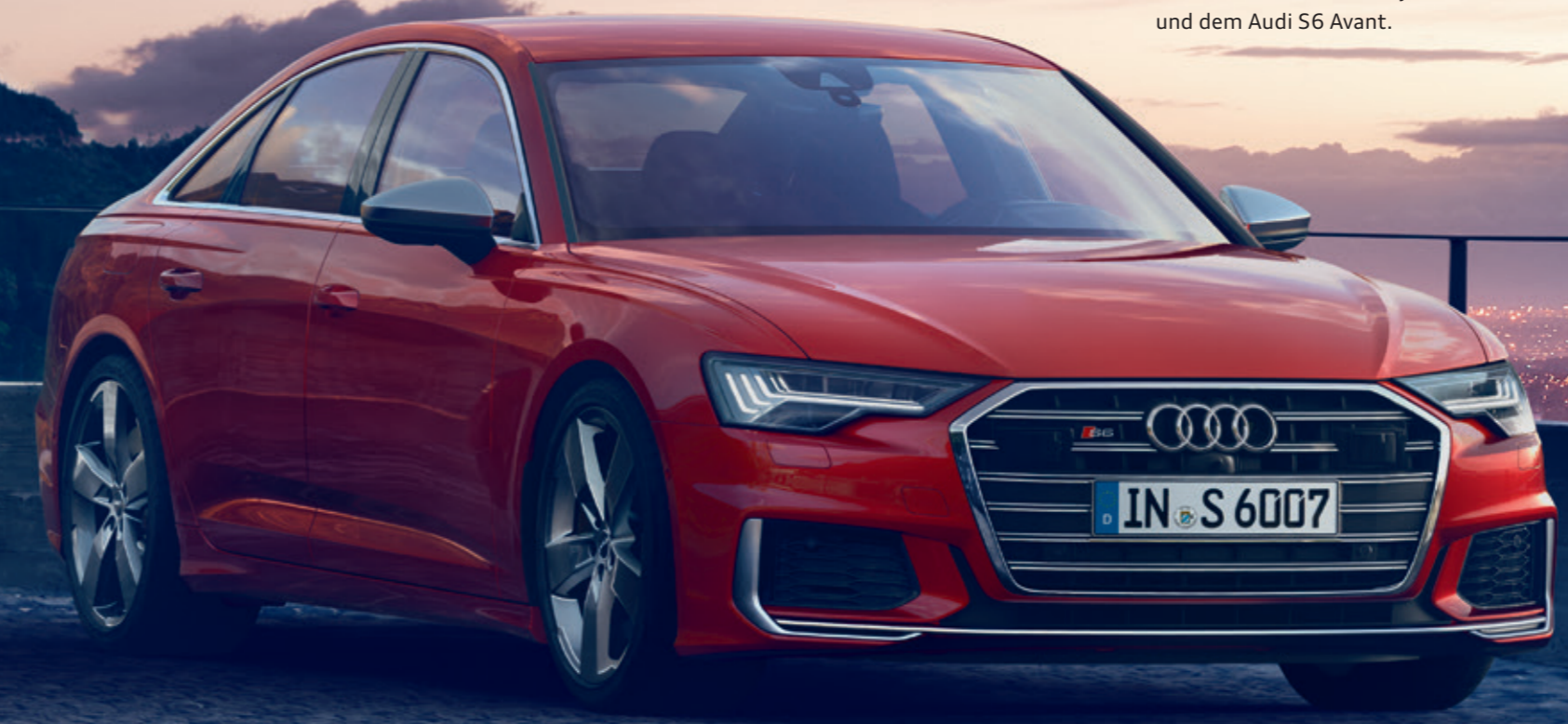
S6 Limousine | S6 Avant