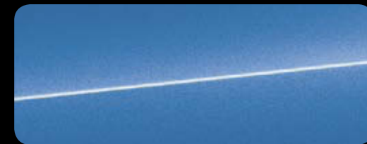
Arablau Kristalleffekt sideblades in Carbon matt