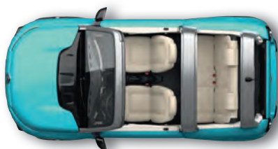
OZEANBLAU Beigefarbene Sitzbezüge