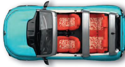
OZEANBLAU Rot-Orangefarbene Sitzbezüge