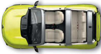
YELLOW SUBMARINE Beigefarbene Sitzbezüge