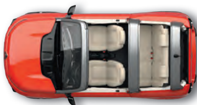
LEUCHTEND ROT-ORANGE Beigefarbene Sitzbezüge