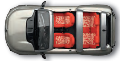
MODISCHES BEIGE* Rot-Orangefarbene Sitzbezüge