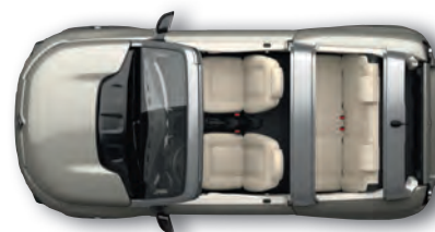
MODISCHES BEIGE* Beigefarbene Sitzbezüge