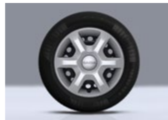
Abbildungen zeigen Sonderausstattung.