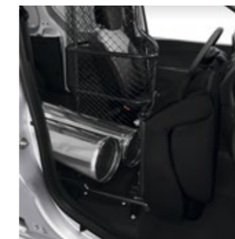
Dacia Easy Seat-System, gewickelt