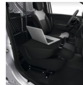
Dacia Easy Seat-System, mit umgeklappter Rückenlehne als Schreibtisch zu nutzen

Nähere Informationen zu den hier dargestellten Ausstattungsmerkmalen finden Sie in der aktuellen Preisliste.