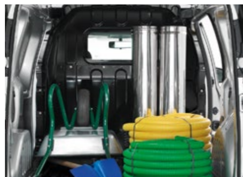
Trennwand geschlossen mit Fenster

Nähere Informationen zu den hier dargestellten Ausstattungsmerkmalen finden Sie in der aktuellen Preisliste.