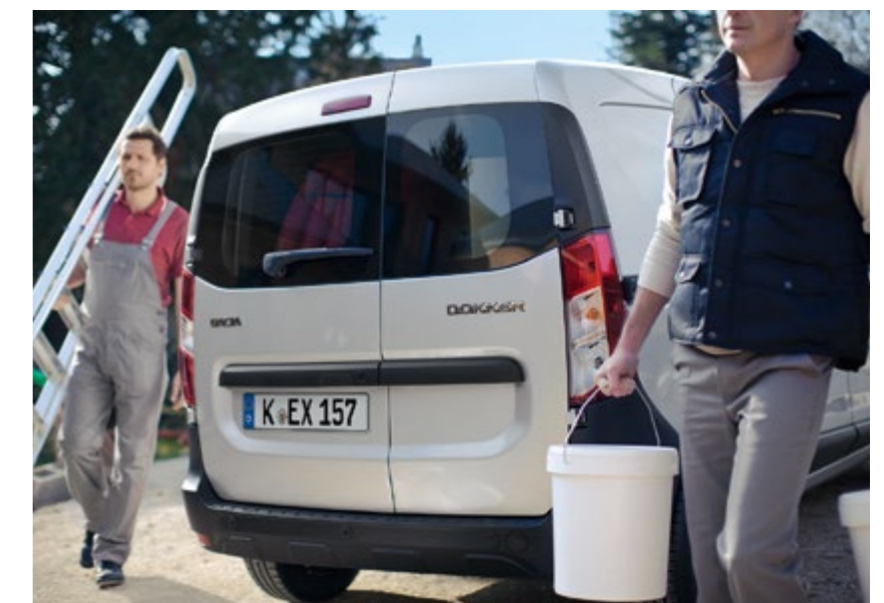
Abbildungen zeigen Sonderausstattung.