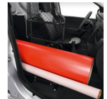
Dacia Easy Seat-System, ausgebaut