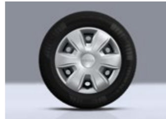
15-ZOLL-STAHLRAD MIT KOMPLETTER RADZIERBLENDE