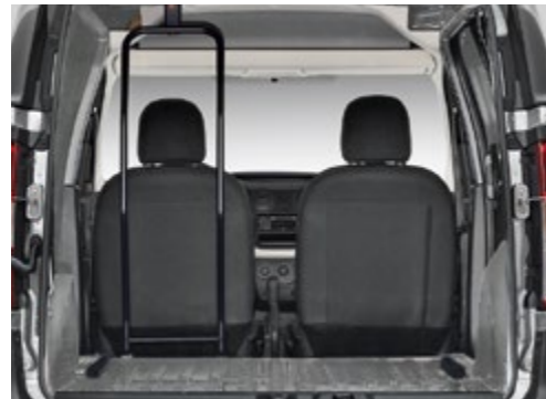
Schutzstange hinter dem Fahrersitz