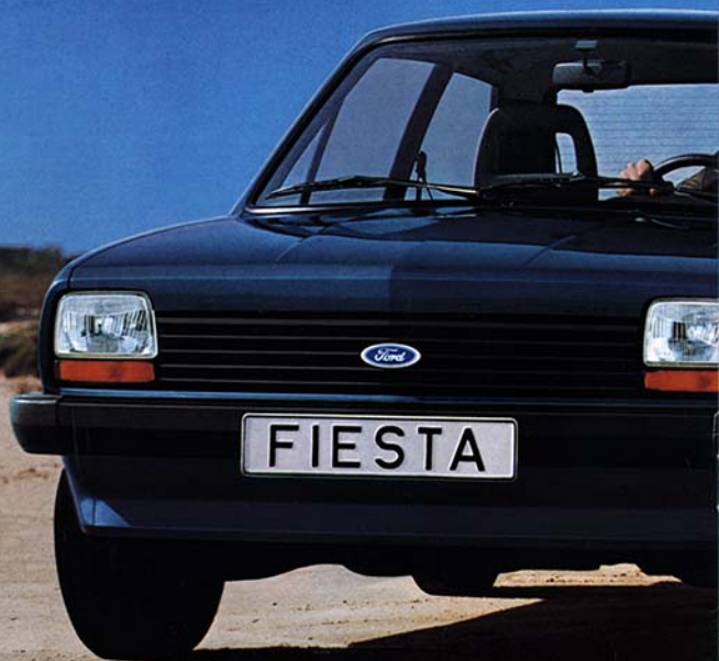
Ford Fiesta S. Intensiv-Metallic-Lackierung Sonderausstattung.