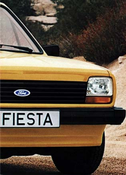
Ford Fiesta Grundmodell.