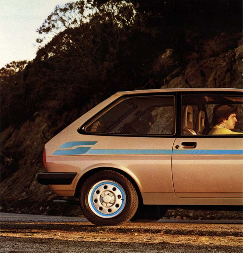
Ford Fiesta S. Intensiv-Metallic-Lackierung. Sonderausstattung.