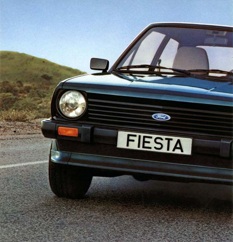
Ford Fiesta XR2. Stoßstangenhörner Sonderausstattung.