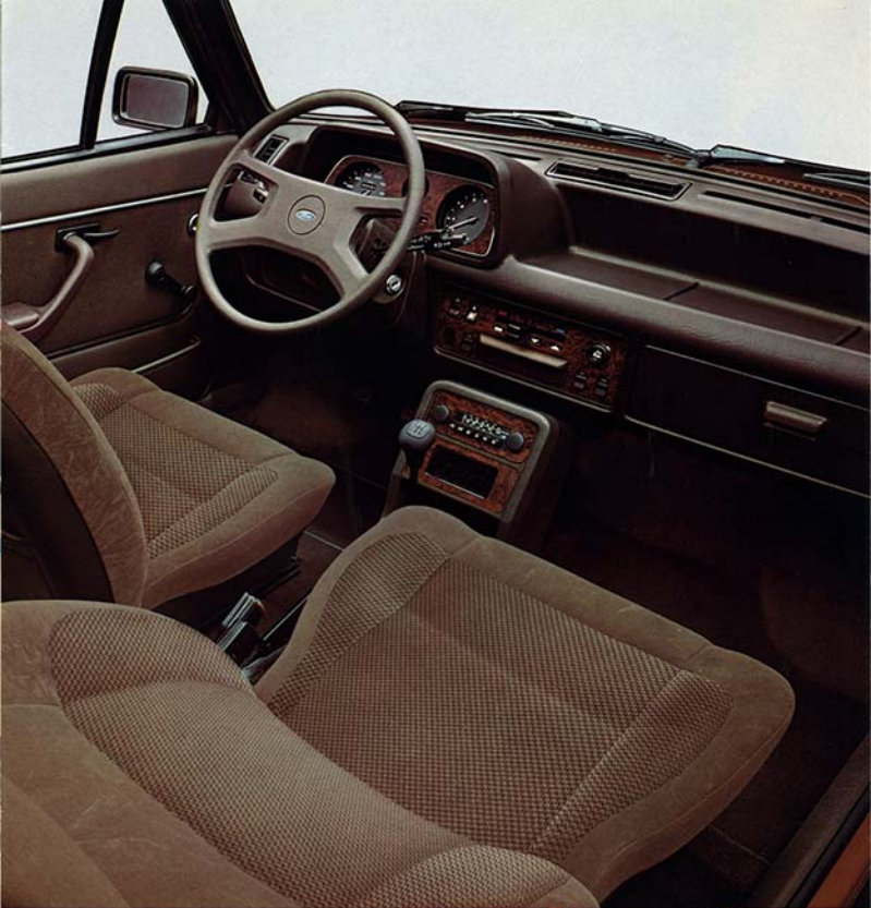
Ford Fiesta Ghia. Radio Sonderausstattung.