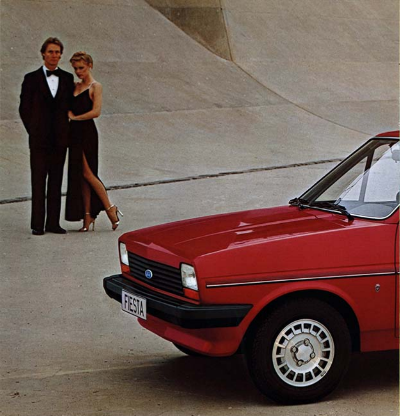
Ford Fiesta Ghia. Leichtmetallfelgen Sonderausstattung.