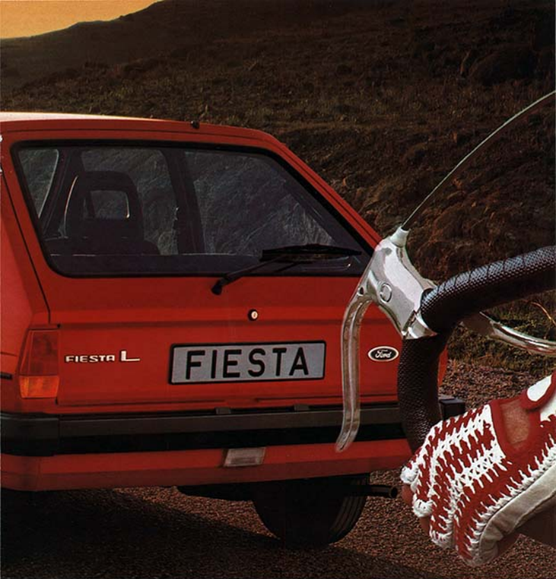
Ford Fiesta L.