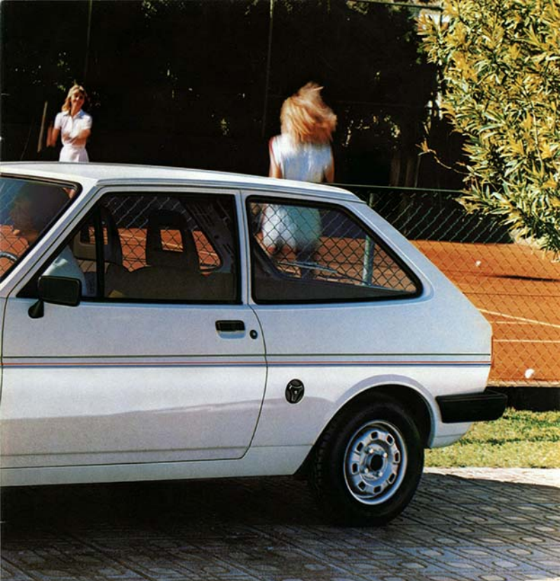
Ford Fiesta L.