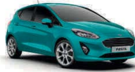
Lagun-Blau spezielle Metallic-Lackierung*