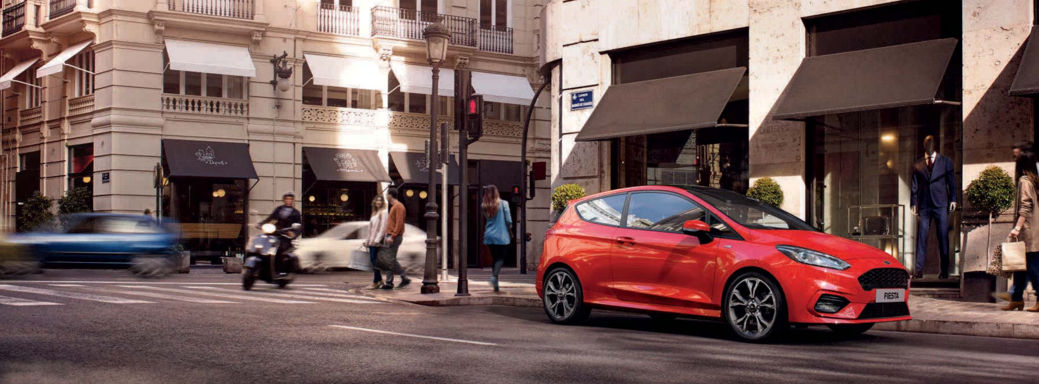
Abb. zeigt einen Ford Fiesta ST-Line in Race-Rot (Wunschausstattung).