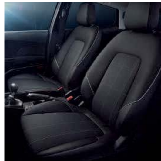
Stoffpolsterung in Anthrazit Serienmäßig bei Trend und Cool & Connect

Aussehen und Haptik der Premium-Materialien setzen den eindrucksvollen Innenraum des neuen Ford Fiesta perfekt in Szene. Mit viel Detailarbeit produzierte Vordersitze bieten einen ausgezeichneten Halt und Komfort. Außerdem wurde viel Wert auf das Design und die Verarbeitung der Sitzbezüge des Ford Fiesta gelegt, um das gesamte Fahrerlebnis nochmals zu steigern.