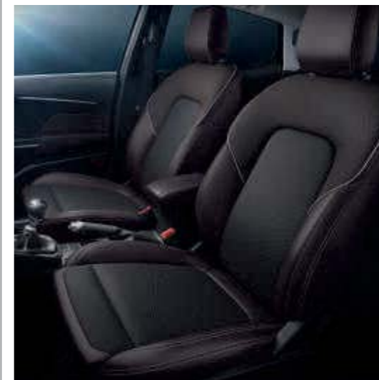
Leder-Stoffpolsterung in Black Ruby (Sitzwangen in Leder) Serienmäßig bei Vignale