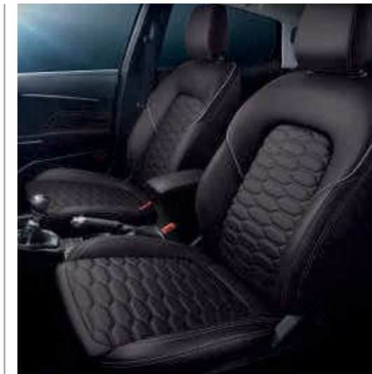
Lederpolsterung, wabenförmig gesteppt, in Black Ruby Wunschausstattung bei Vignale