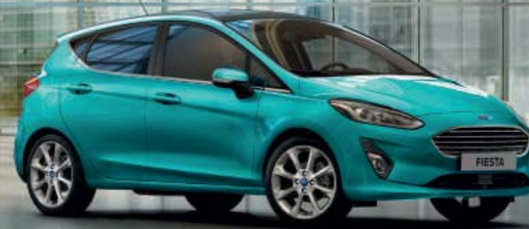
Fiesta Titanium 5-Türer in Lagun-Blau und mit 17"-Leichtmetallrädern im 8-Speichen- Design. Abb. zeigt Wunschausstattung.