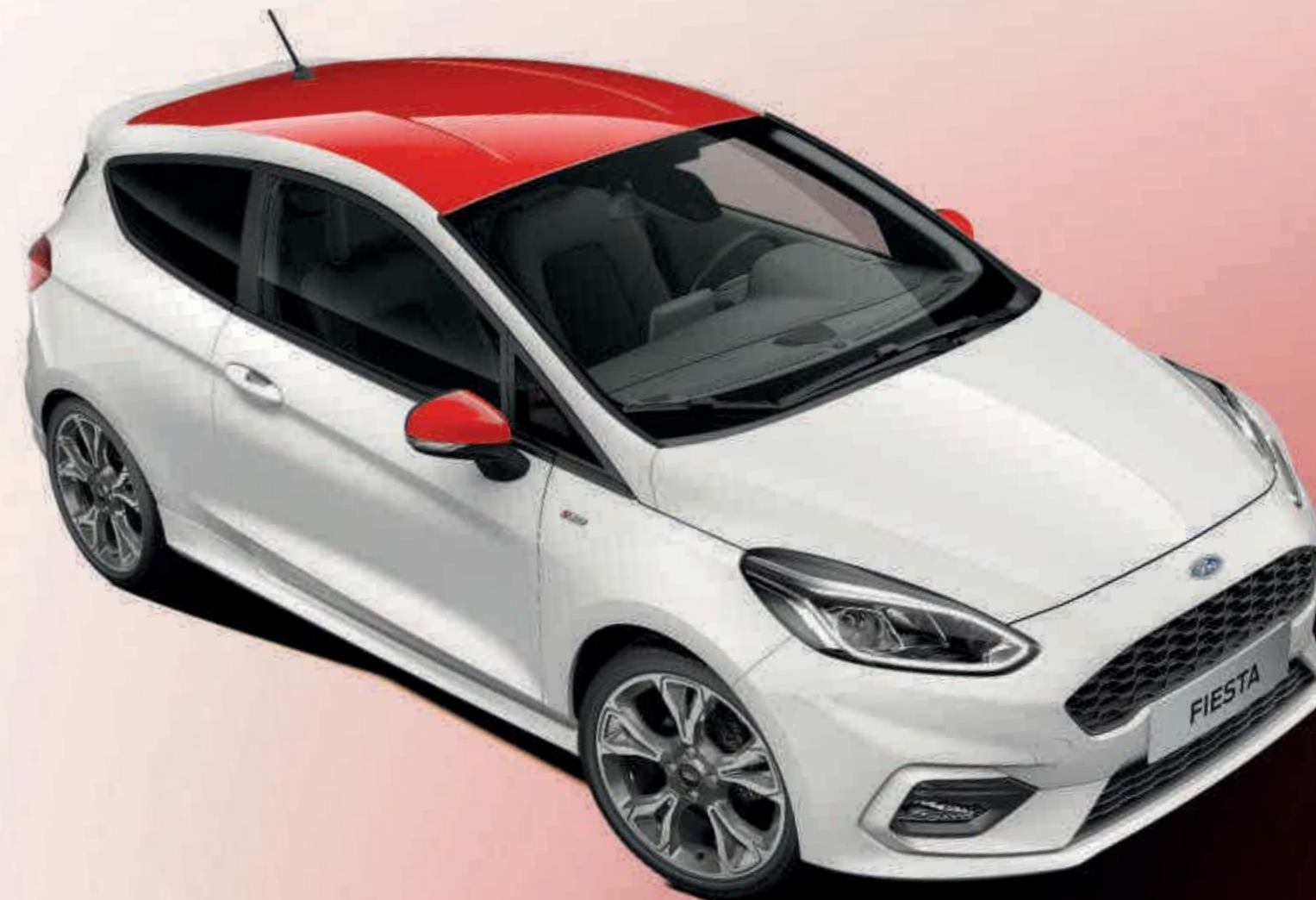
Abb. zeigt einen Ford Fiesta ST-Line mit Kontrast-Paket in Race-Rot (Wunschausstattung).

Serienausstattung Wunschausstattung gegen Mehrpreis siehe Ausstattungs-Pakete