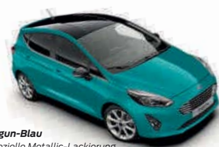
Lagun-Blau spezielle Metallic-Lackierung