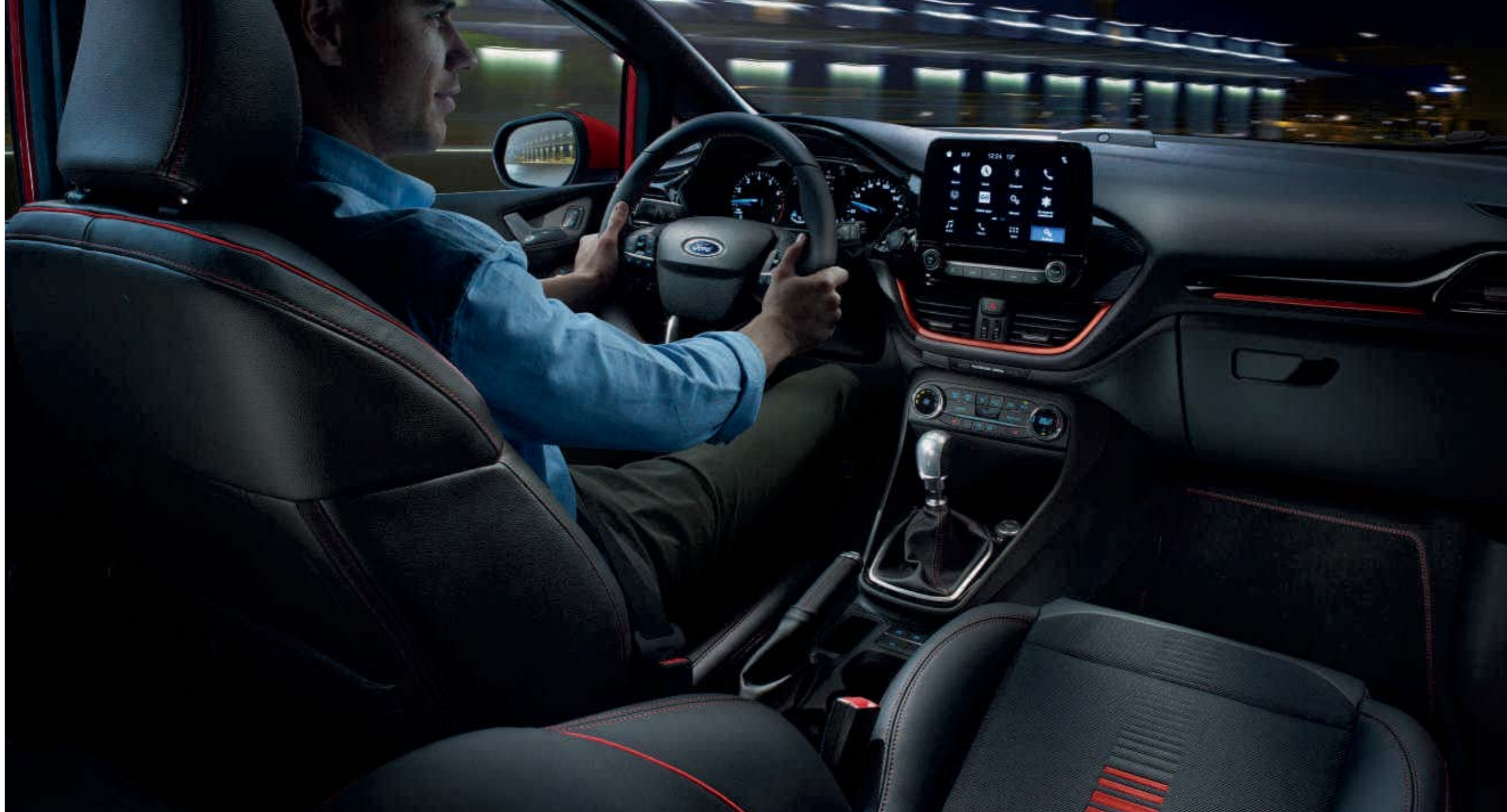
Abb. zeigt einen Ford Fiesta ST-Line mit Styling-Paket Race-Rot II (Wunschausstattung).

Für das optimale Wohlfühlklima in Ihrem neuen Ford Fiesta können Sie nun auch eine Lenkradheizung bestellen. Das heißt – nie mehr kalte Hände im Winter, insbesondere bei ausgekühltem Fahrzeug. (Wunschausstattung)