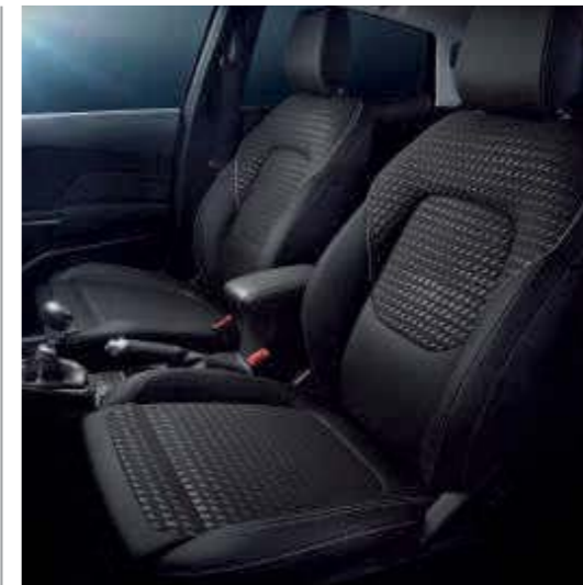
Stoffpolsterung in Anthrazit Serienmäßig bei Titanium