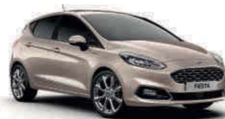
Milano Grigio exklusive Vignale-Lackierung*