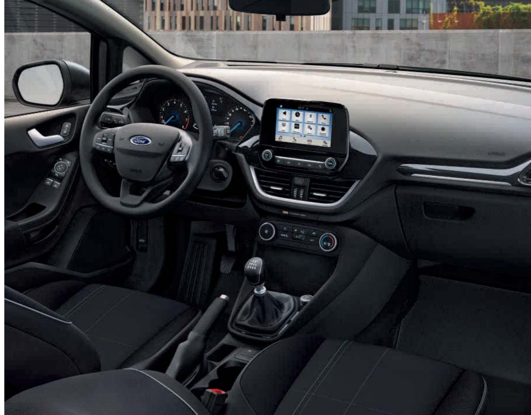
Abb. rechts zeigt Wunschausstattung gegen Mehrpreis.

Hinweis: Die jeweiligen Verbrauchs- und Emissionswerte finden Sie ab Seite 67 dieser Broschüre.