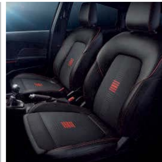
Styling-Paket Race-Rot II

Wunschausstattung bei Trend und Cool & Connect