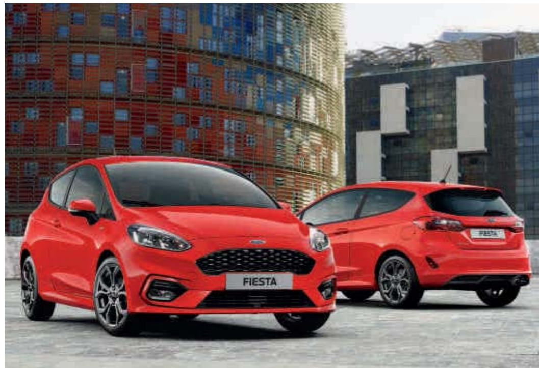
Abb. rechts zeigt Wunschausstattung gegen Mehrpreis.

Hinweis: Die jeweiligen Verbrauchs- und Emissionswerte finden Sie ab Seite 67 dieser Broschüre.