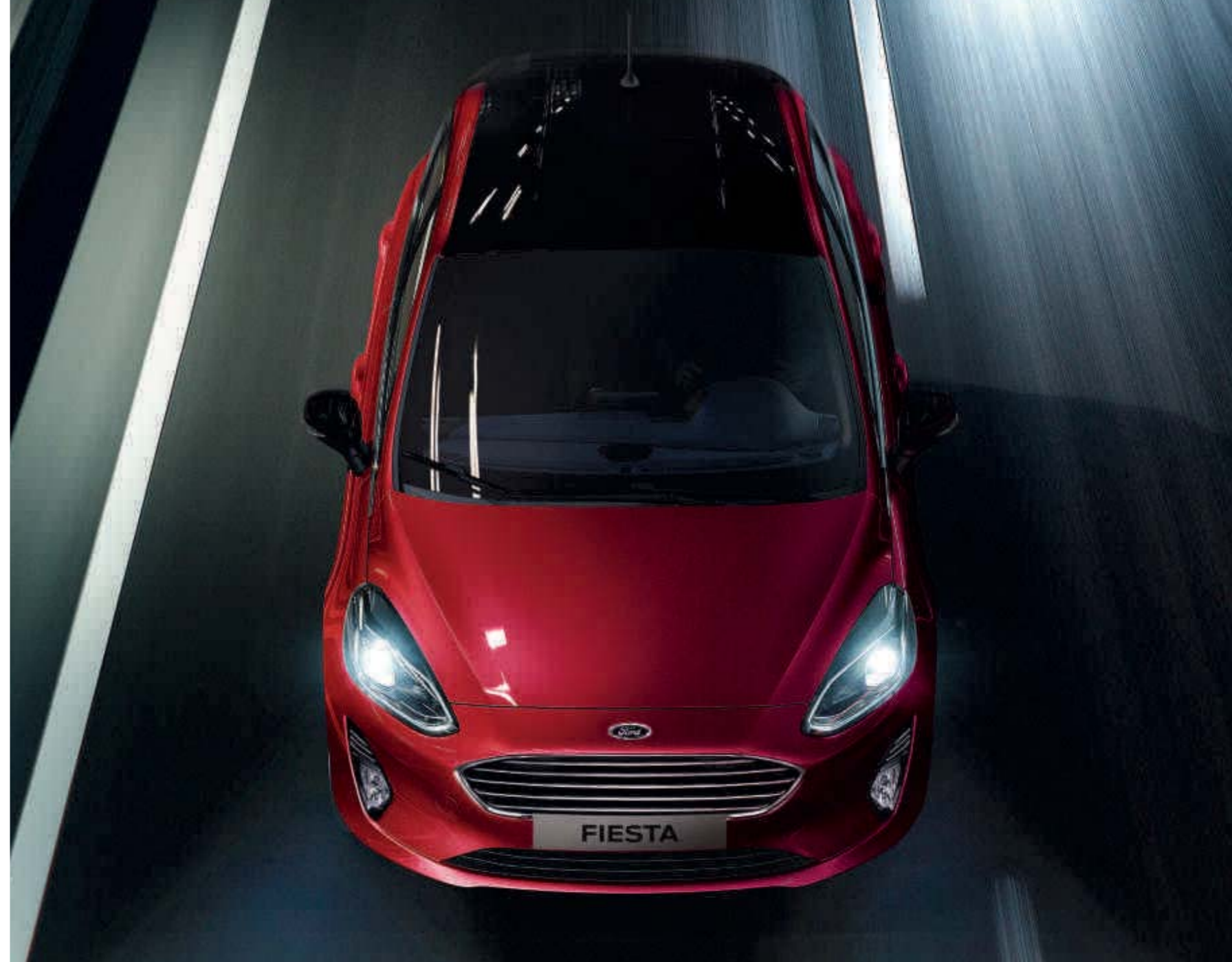
Abb. rechts zeigt einen Ford Fiesta Titanium in Ruby-Rot Metallic mit Kontrast-Paket (Wunschausstattung).