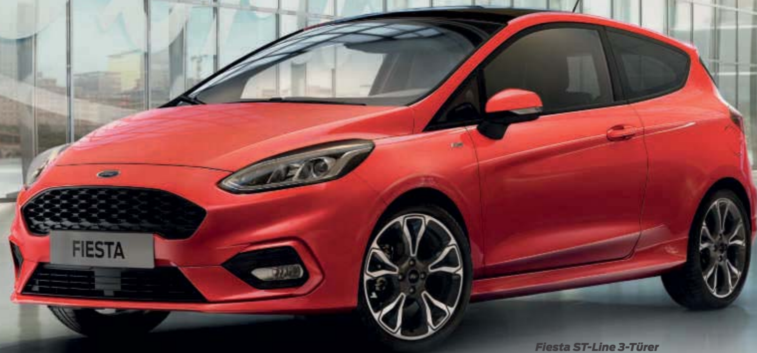
Fiesta ST-Line 3-Türer in Race-Rot und mit 18"-Leichtmetallrädern im 5x2-Speichen- Design in Rock-Metallic, glanzgedreht. Abb. zeigt Wunschausstattung.