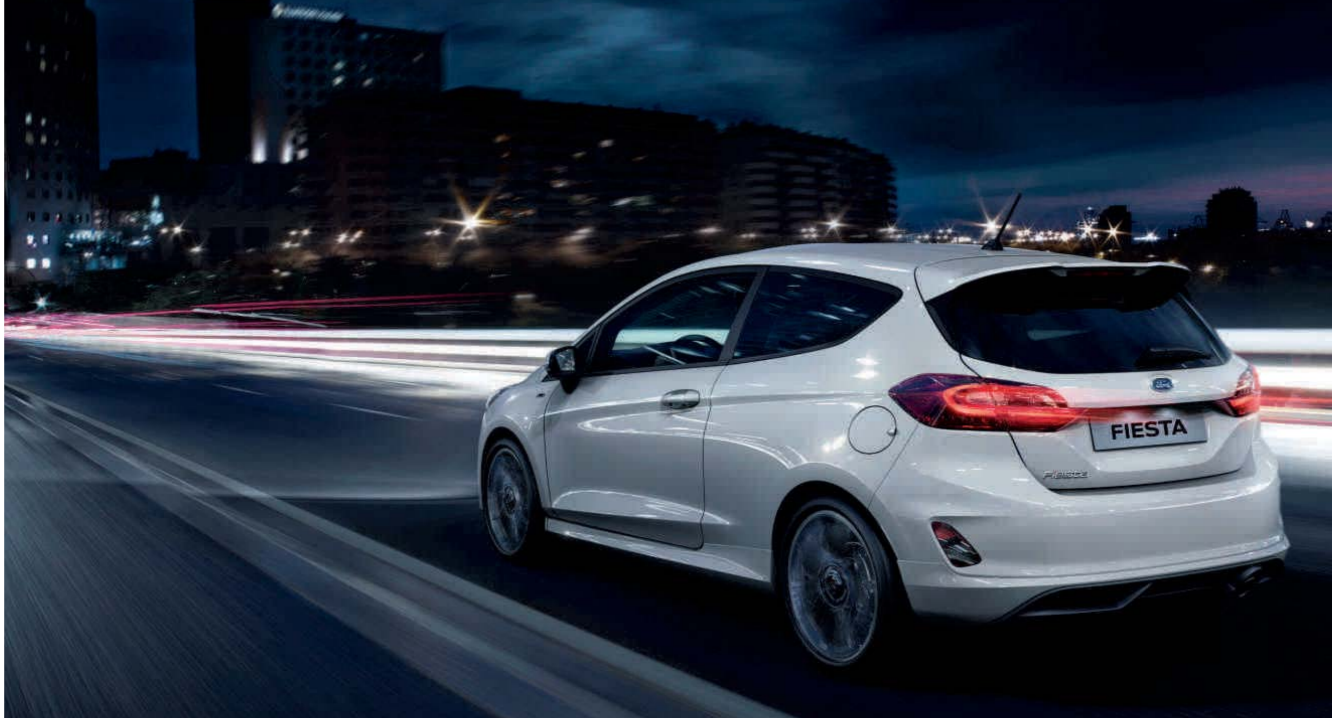
Abb. zeigt einen Ford Fiesta ST-Line in Frost-Weiß (Wunschausstattung).