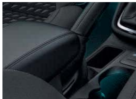
■ Mittelkonsole vorn, zusätzlich mit integrierter Armlehne