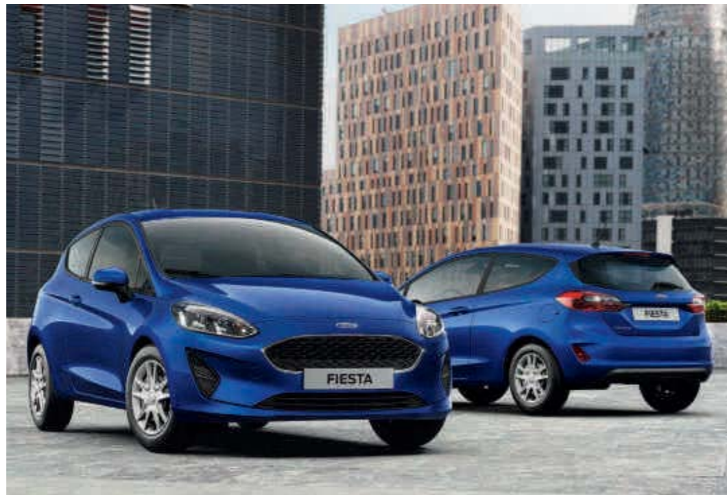
Abb. rechts zeigt Wunschausstattung gegen Mehrpreis.

Hinweis: Die jeweiligen Verbrauchs- und Emissionswerte finden Sie ab Seite 67 dieser Broschüre.