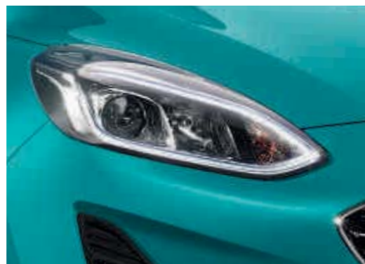
■ Tagfahrlicht mit LED-Technik und LED-Rückleuchten