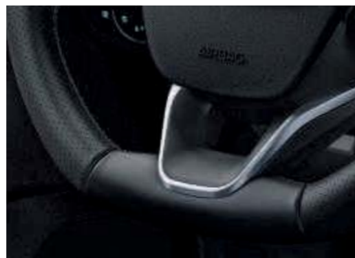
■ Lederlenkrad im „ST-Line“-Design