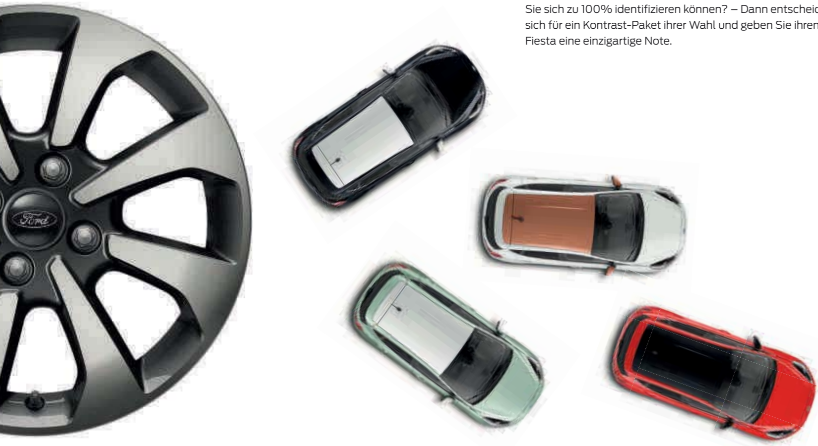
Abb. links zeigen Ford Fiesta mit Kontrast-Paketen (Wunschausstattung).

Sie wollen ein Fahrzeug das perfekt zu Ihnen passt und mit dem Sie sich zu 100% identifizieren können? – Dann entscheiden Sie sich für ein Kontrast-Paket ihrer Wahl und geben Sie ihrem Ford Fiesta eine einzigartige Note.