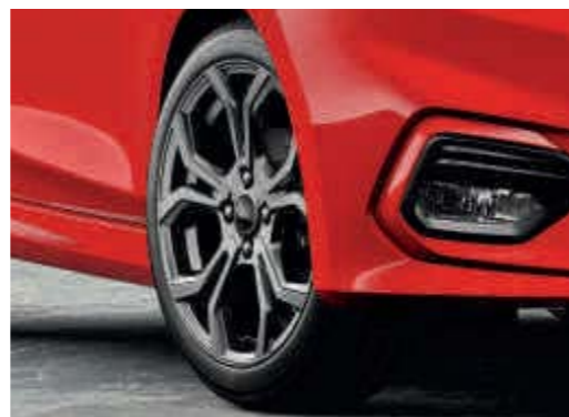
■ ST-Line Stoßfänger vorn