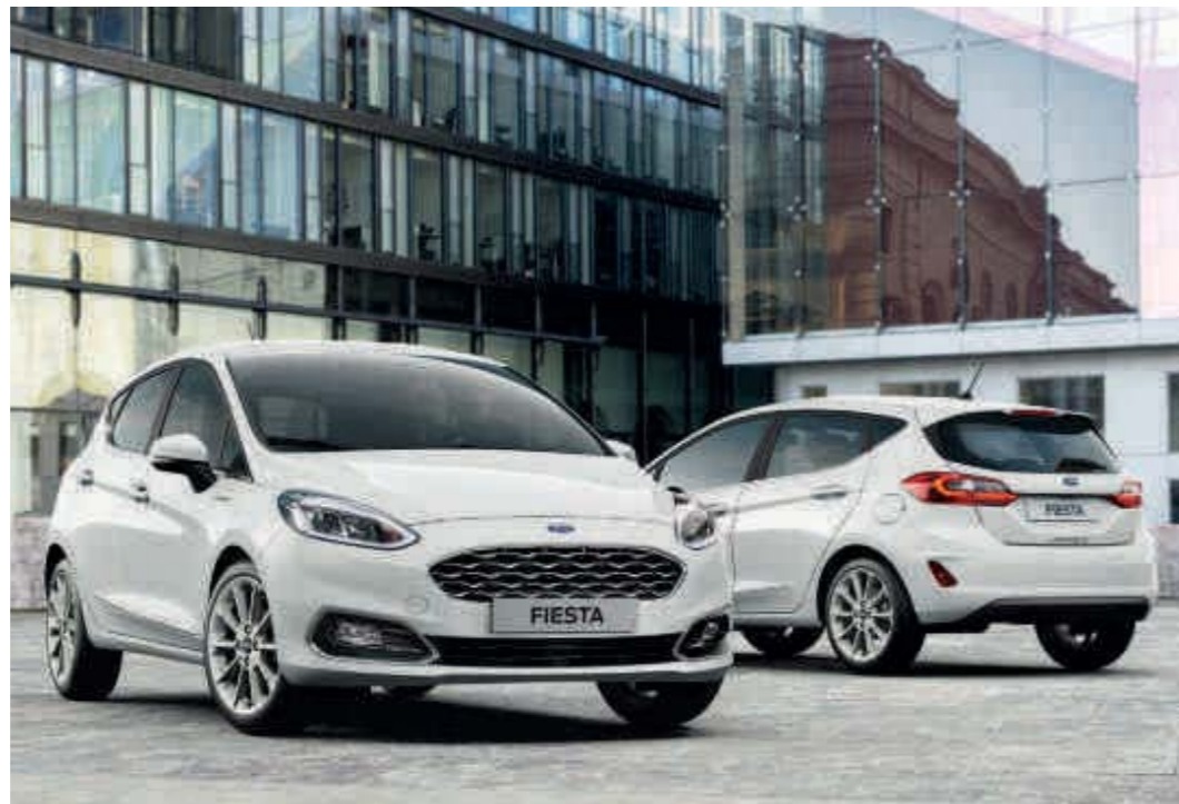
Abb. rechts zeigt Wunschausstattung gegen Mehrpreis.

Hinweis: Die jeweiligen Verbrauchs- und Emissionswerte finden Sie ab Seite 67 dieser Broschüre.