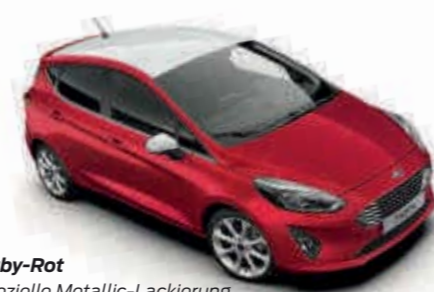
Ruby-Rot spezielle Metallic-Lackierung