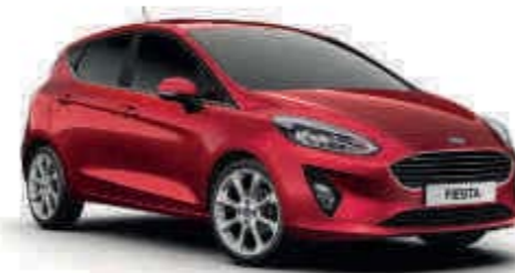
Ruby-Rot spezielle Metallic-Lackierung*