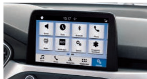
Ford Navigationssystem inkl. Ford SYNC 3 mit AppLink und 8"-Touchscreen (20,3 cm Bildschirmdiagonale)

(diverse Funktionen nur i. V. mit kompatibelem Mobiltelefon)