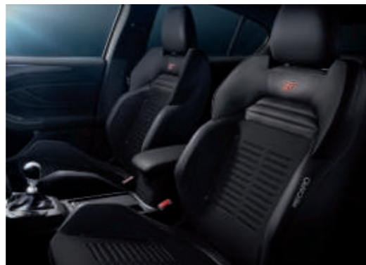
„ST“-Schriftzug in den Recaro-Sportsitzen mit Leder-Stoff-Polsterung (Sitzwangen in Leder)