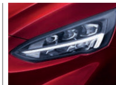
LED-Scheinwerfer mit automatischer Leuchtweitenregulierung