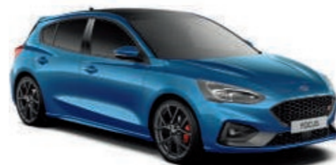
Performance-Blau spezielle Metallic-Lackierung*