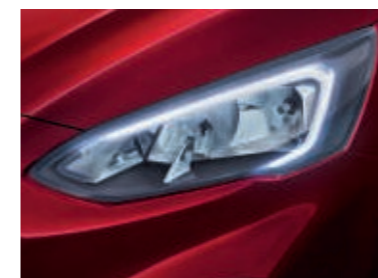
Halogen-Scheinwerfer mit LED-Tagfahrlicht