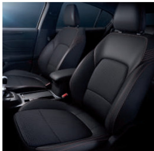
Leder-Stoff-Polsterung (Sitzwangen in Leder) mit Ziernähten in Rot