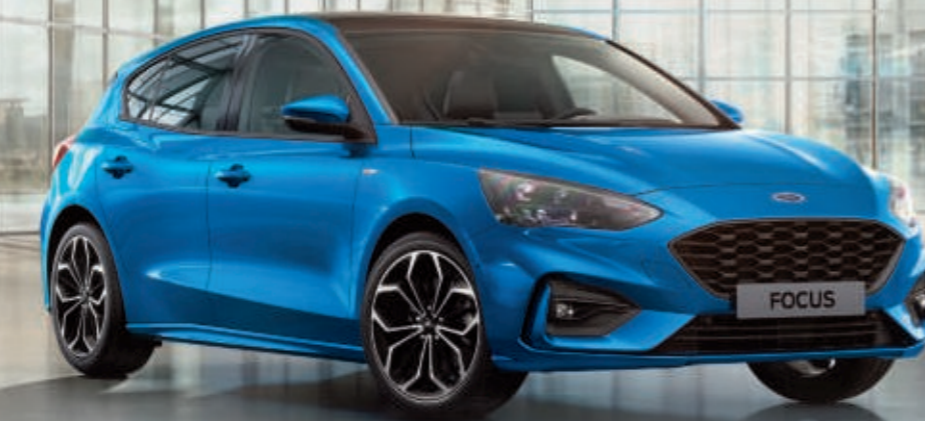
Focus ST-Line in Dynamic-Blau Metallic (Wunschausstattung).