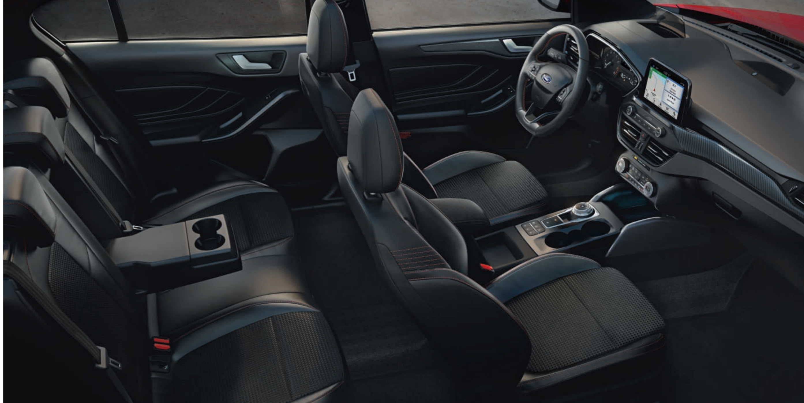
Abbildung zeigt einen Ford Focus ST-Line Innenraum mit Leder-Stoff-Polsterung (Sitzwangen in Leder) und roten Ziernähten (Wunschausstattung).