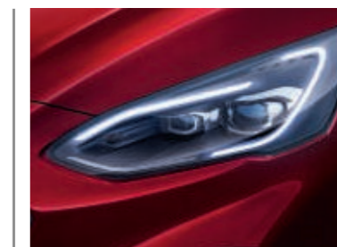
Intelligente LED-Scheinwerfer mit blendfreiem Fernlicht-Assistenten und kamerabasiertem Kurvenlicht