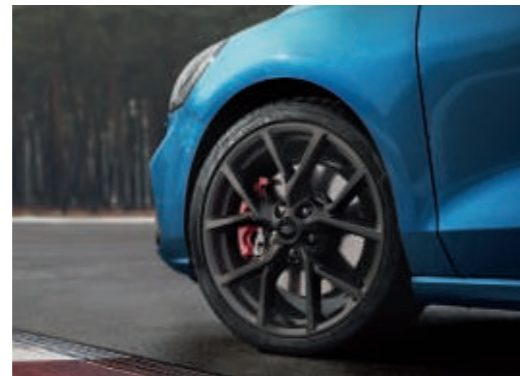
Leichtmetallräder im 5x2-Speichen-Design, in Magnetite Premiumlackierung