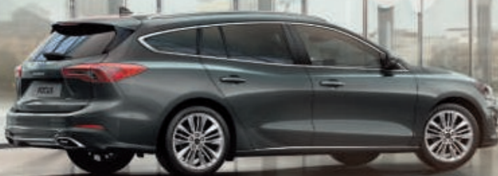
Focus Vignale Turnier in Magnetic-Grau Metallic (Wunschausstattung).