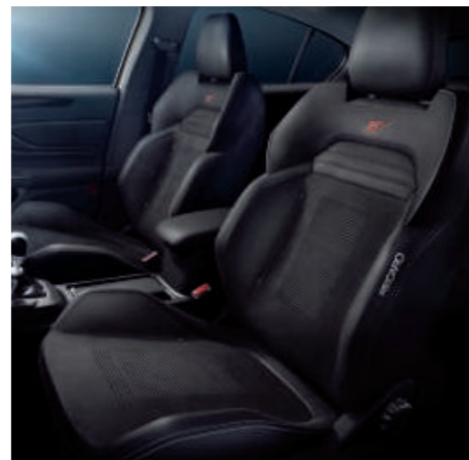
Recaro-Sportsitze mit Leder-Stoff-Polsterung (Sitzwangen in Leder) "Dinamica"

Serienausstattung bei ST mit Styling-Paket