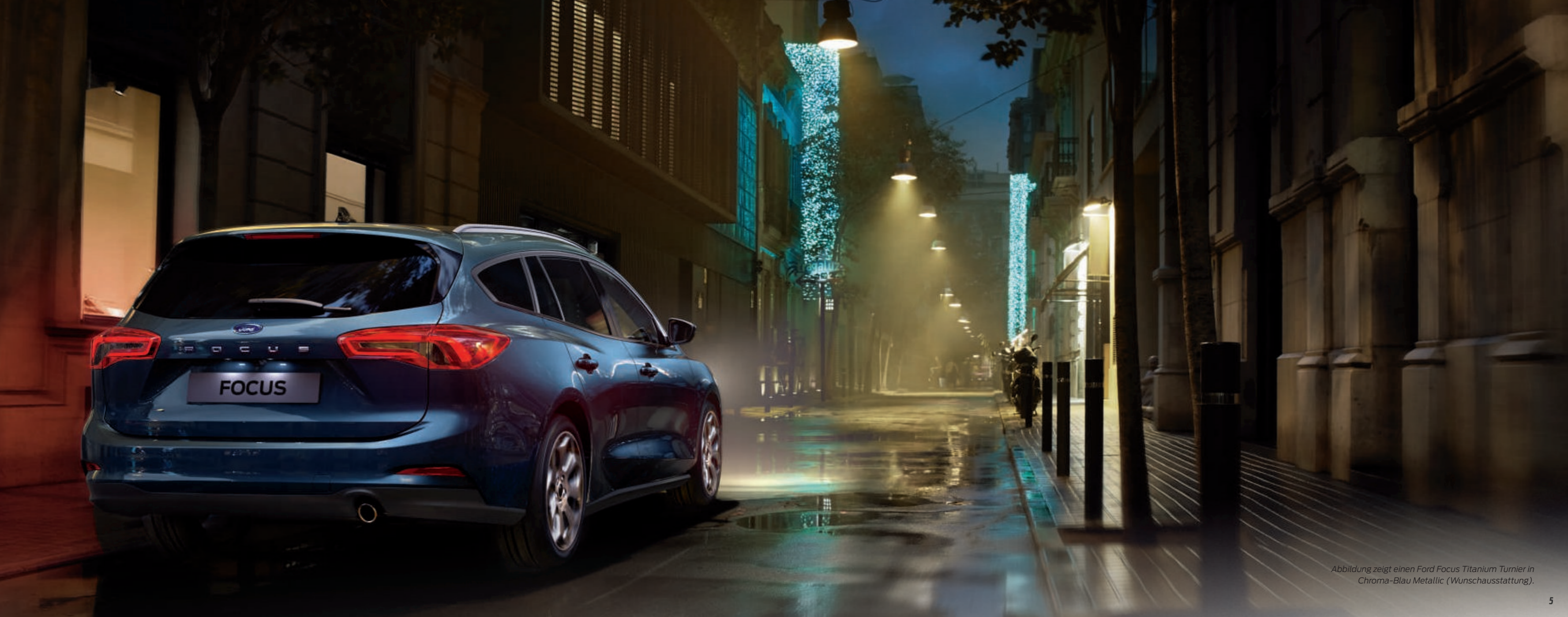
Abbildung zeigt einen Ford Focus Titanium Turnier in Chroma-Blau Metallic (Wunschausstattung).