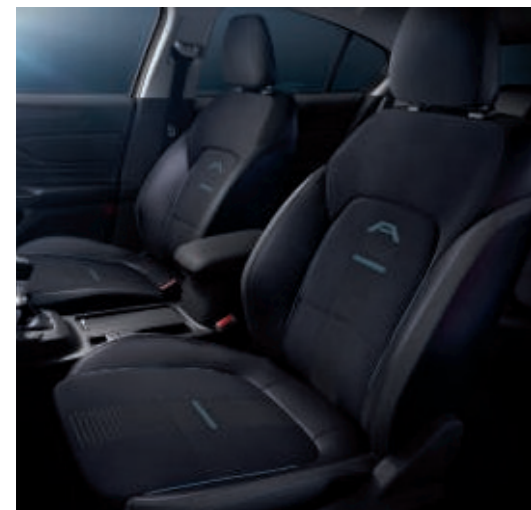
Leder-Stoff-Polsterung (Sitzwangen in Leder) mit Ziernähten in Nordic-Blau