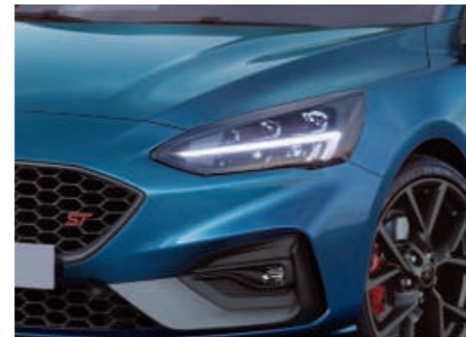
LED-Scheinwerfer mit automatischer Leuchtweitenregulierung

Abbildung zeigt Wunschausstattung gegen Mehrpreis.