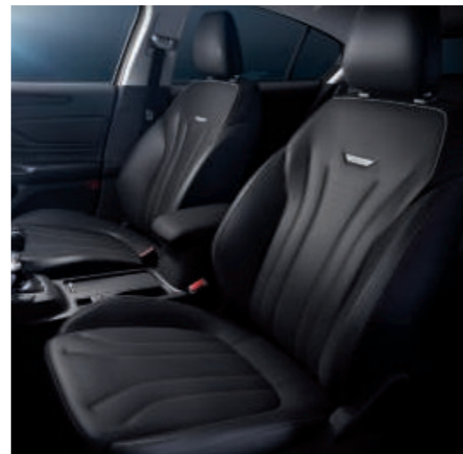
Premium-Lederpolsterung* in Anthrazit