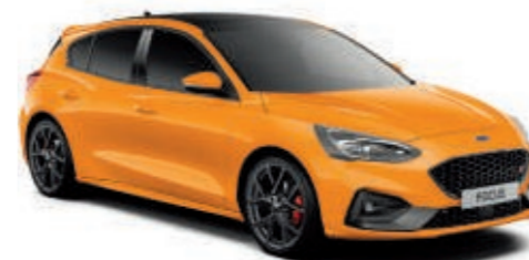
Tropical-Orange spezielle Metallic-Lackierung*