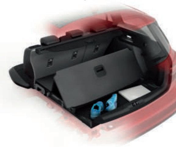
Abbildung zeigt einen Ford Focus Vignale Turnier in Ruby-Rot Metallic (Wunschausstattung).