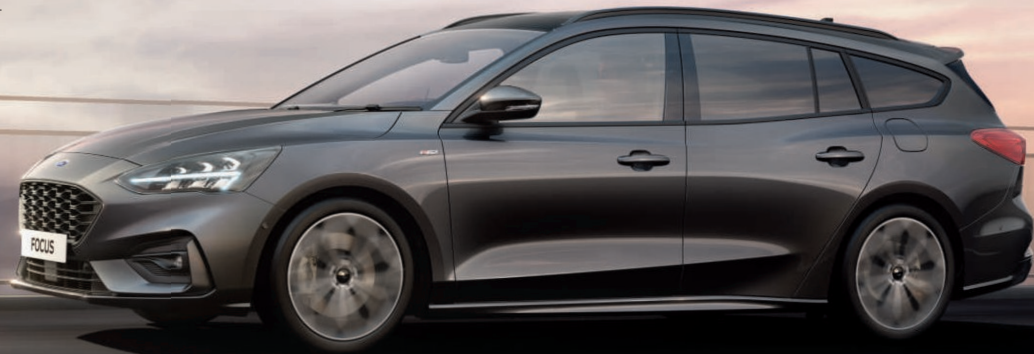
Abbildung zeigt einen Ford Focus ST-Line Turnier in Magnetic-Grau Metallic (Wunschausstattung).

Dunkle, kurvige Straßen. Stark befahrene Autobahnen. Hektische Zeitpläne. Stop-and-Go-Verkehr. Enge Parklücken. In dieser Broschüre erfahren Sie, warum der Ford Focus all das zum reinsten Kinderspiel macht.