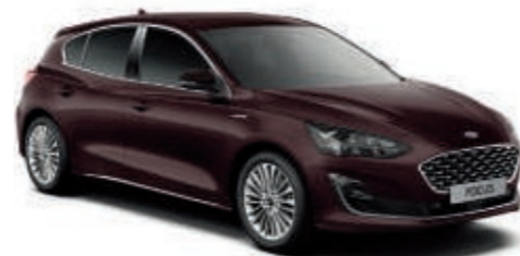
Dark Berry spezielle Metallic-Lackierung*