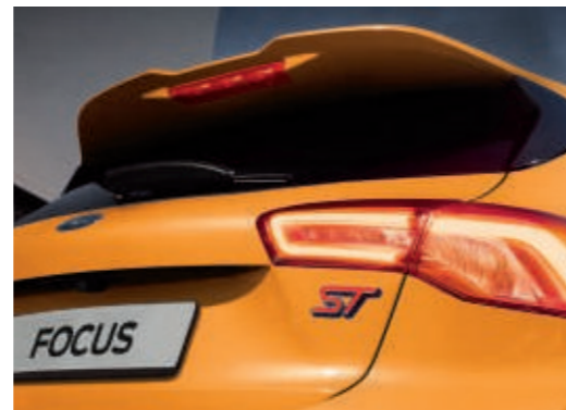
Dachspoiler, groß, in speziellem Design