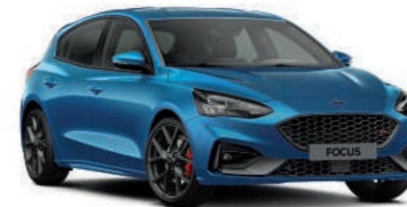
ST mit Styling-Paket

Das markante Außendesign des Ford Focus ST-Line , des neuen Ford Focus ST und des neuen Ford Focus ST mit Styling-Paket verbindet das dynamische Fahrerlebnis mit einem aufsehenerregenden sportlichen Auftritt.