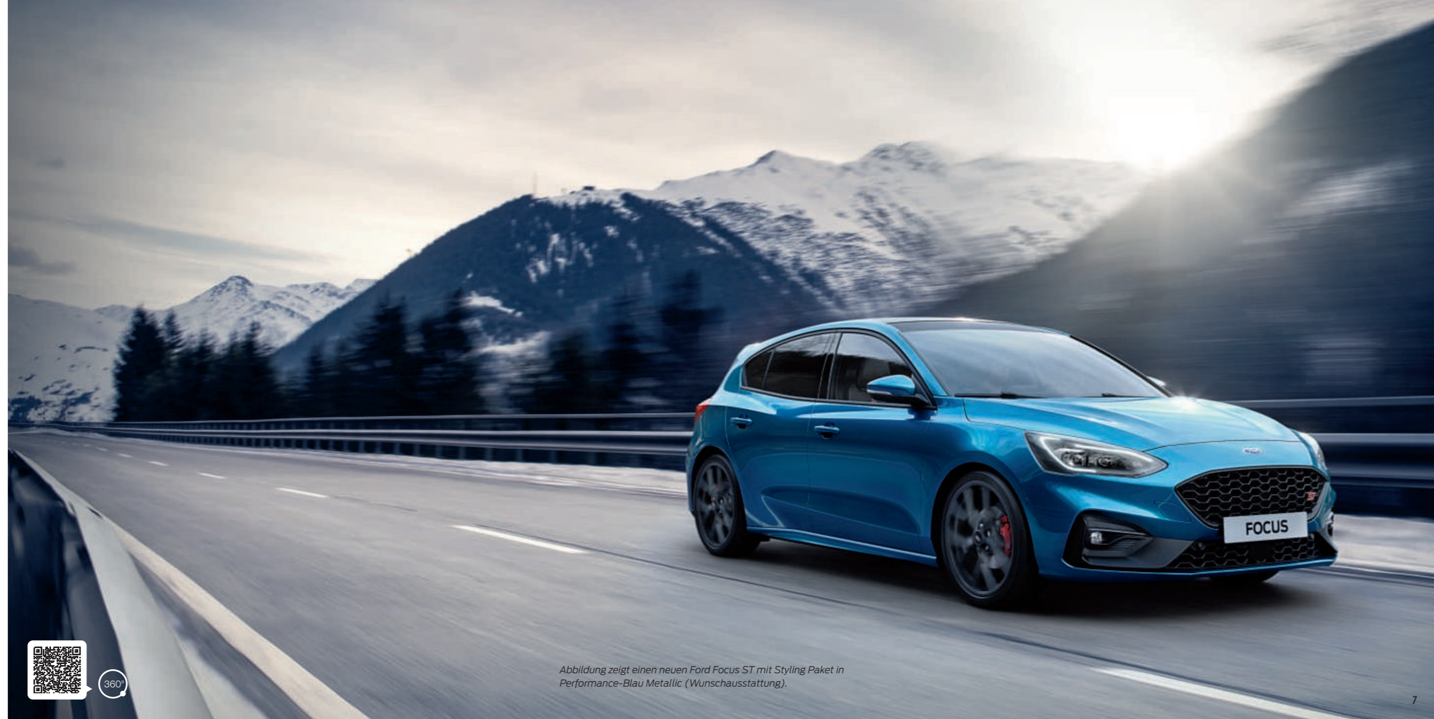
Abbildung zeigt einen neuen Ford Focus ST mit Styling Paket in Performance-Blau Metallic (Wunschausstattung).