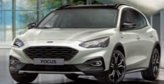
Focus Active in Metropolis-Weiß Metallic (Wunschausstattung).