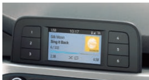
Ford Audiosystem 4,2"-Display (10,7 cm Bildschirmdiagonale)

(diverse Funktionen nur i. V. mit kompatibelem Mobiltelefon)