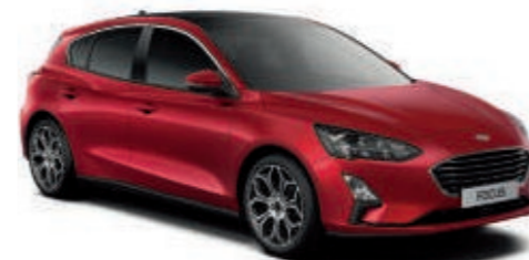
Ruby-Rot spezielle Metallic-Lackierung*

Wir haben uns für Dynamic-Blau entschieden. Für welche Farbe entscheiden Sie sich?