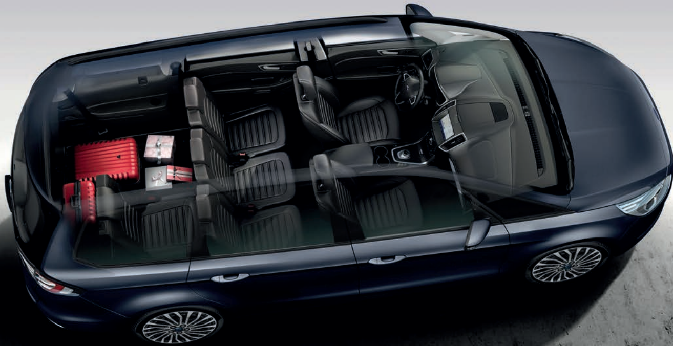
Abbildung zeigt Ford Galaxy.

MAXIMALES RAUMANGEBOT FÜR BIS ZU 7 PERSONEN.