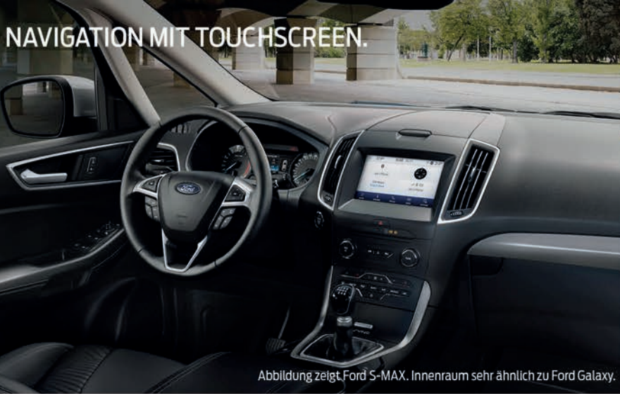
Abbildung zeigt Ford S-MAX. Innenraum sehr ähnlich zu Ford Galaxy.

MEHR SICHERHEIT DANK PRE-COLLISION-ASSIST.