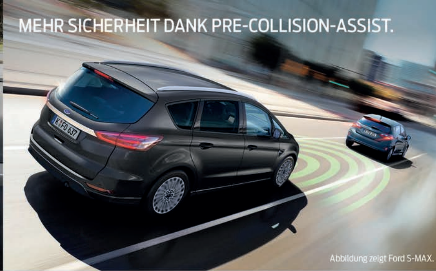
Abbildung zeigt Ford S-MAX.

MEHR SICHERHEIT DANK PRE-COLLISION-ASSIST.