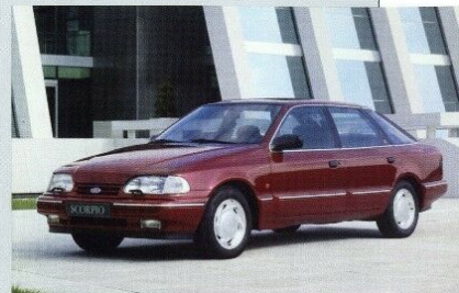
Der neue Scorpio Ghia Fließheck. Metalllackierung Sonderausstattung.

Jetzt ist die Scorpio-Modellpalette weiter optimiert worden. Angefangen bei den CLX-Limousinen über die GLX, GLX 4x4 und GLX 24V-Modelle bis hin zum luxuriösen Scorpio Ghia und Ghia 24V findet sich für jeden Anspruch der richtige Scorpio. Durch verbesserte Stylingdetails, durch funktionell verbesserte Technik und durch unsere Liebe zu sinnvollen Detaillösungen hat der Scorpio weiter an Attraktivität gewonnen. Die Einzelheiten erfahren Sie auf den folgenden Seiten.