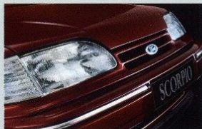
Die neue Front mit dem überarbeiteten Grill für verbesserten Luftdurchsatz und mit Klarglas-Blinkern.