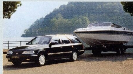
Der Scorpio GLX Turnier. Metalllackierung, Winter-Paket und Anhängervorrichtung Sonderausstattung.