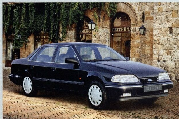
Der neue Scorpio CLX Stufenheck. Winter-Paket und Metalllackierung Sonderausstattung.