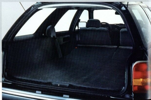
... bis zu 1600 Litern (VDA).