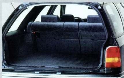
Der Gepäckraum wächst mit durch die zu 1/2, 2/3 oder in ganzer Breite umklappbare Rücksitzlehne. Von 550 ...