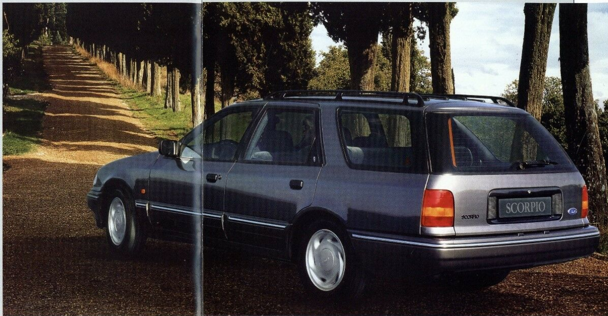
Die neue Dimension: der Scorpio Ghia Turnier. Metalllackierung und Anhängervorrichtung Sonderausstattung.