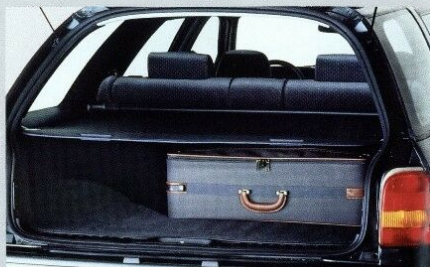
Der gesamte Gepäckraum ist mit Teppich verkleidet. Durch die Laderaumabdeckung (Rollo) ist Ihr Gepäck vor Einblicken geschützt.